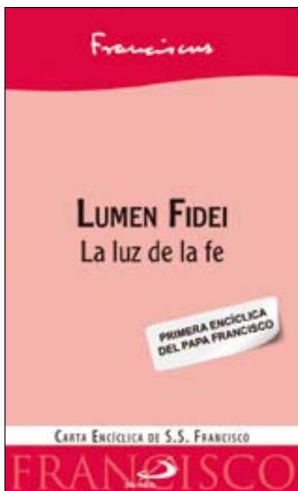
Portada de la encíclica “Lumen Fidei”, escrita por los papas Benedicto XVI y Francisco.

Francisco asegura que “cuando falta la luz, todo se vuelve confuso, es imposible distinguir el bien del mal, la senda que lleva a la meta de aquella otra que nos hace dar vueltas y vueltas, sin una dirección fija”.