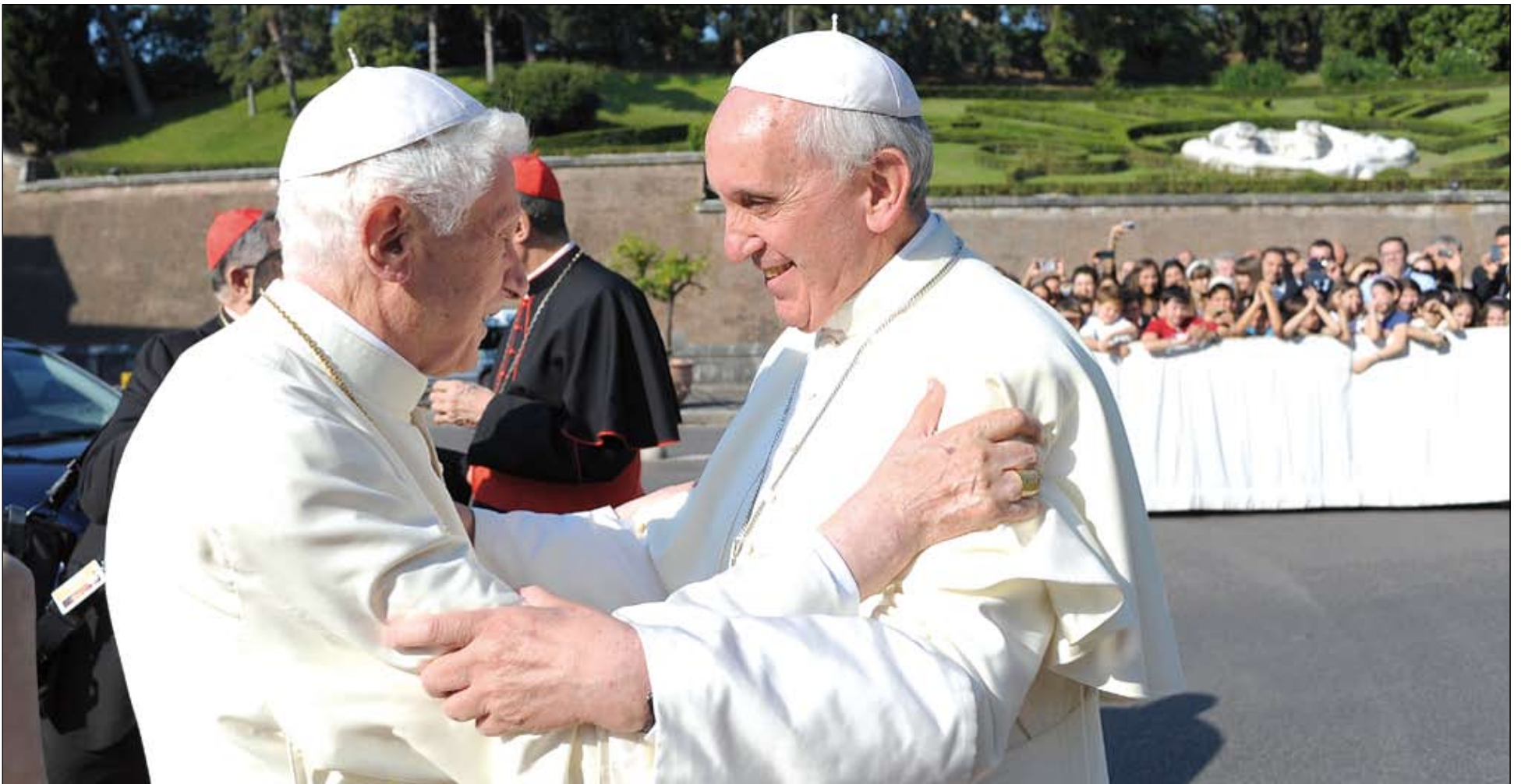
El Papa emérito Benedicto XVI (izda.) y el Papa Francisco se encontraron en los Jardines del Vaticano el mismo día que veía la luz la encíclica “Lumen Fidei”.