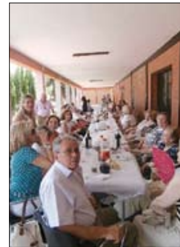
Asistentes al encuentro.

la coincidencia de estar coordinando el cursillo que se clausuraba. Todos ellos hablaron y expusieron sus ilusiones y planes para desarrollar en sus diócesis respectivas.