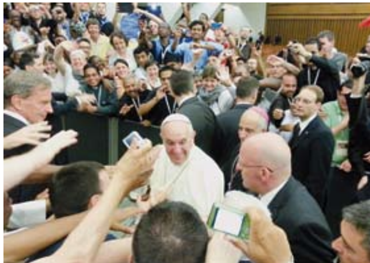
El Papa saludó a los seminaristas, novicios y novicias participantes.

Sobre el tema recordó una poesía en español: "Esta tarde Señora la promesa es sincera, pero por las dudas no te olvides las llaves fuera". Y alertó que "si uno deja siempre la llave fuera no va, tenemos que aprender a cerrar la puerta desde dentro". Y recomendó que si no estoy seguro me tomo un