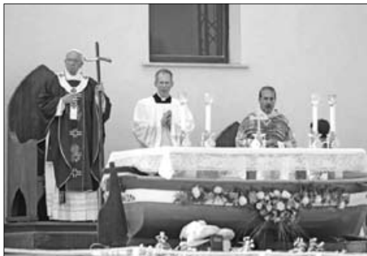
Arriba, el Papa Francisco escucha la historia de uno de los refugiados. Abajo, el Papa durante la Eucaristía en la que utilizó báculo y cáliz hecho con madera de los barcos de inmigrantes llegados a la isla, al igual que el altar.

nal para acabar con el estado del bienestar y denunciar la indiferencia hacia tantos hermanos y hermanas de la que recordó, el estado del bienestar es el responsable.