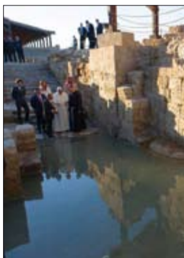
El Papa Francisco en su visita al río Jordán, a su paso por Betania.

Algunas de las iglesias más antiguas del planeta se encuentran en Jordania, como la sala de oración del siglo II de Betania, la iglesia del siglo IV de Umm Qays y las ruinas del que se cree que es el templo más antiguo del mundo en la ciudad de Áqaba al sur