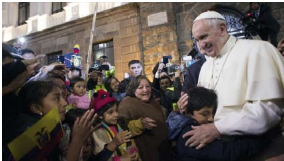
El papa Francisco saludó a las personas que esperaban para verlo durante su viaje a Ecuador.

Su primera parada fue el Santuario Nacional de la Divina Misericordia, donde el Papa fue recibido con entusiasmo por los fieles allí reunidos, enfermos y ancianos en su mayoría. Dentro