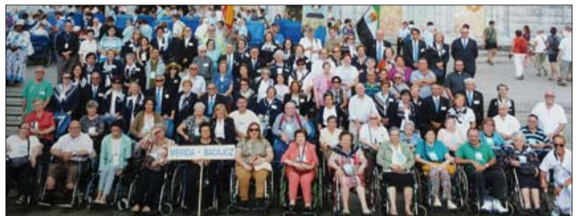
Participantes en la peregrinación

El pasado lunes finalizaba la peregrinación de enfermos que ha venido realizando a Lourdes la Hospitalidad de Mérida-Badajoz, en la que participa un centenar de personas.