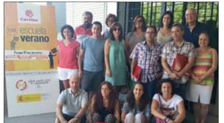
Técnicos de Cáritas diocesana que han participado en la Escuela de la Caridad.

Cáritas Española ha venido celebrando del 4 al 11 de julio su XXIII Escuela de Verano en El Escorial.