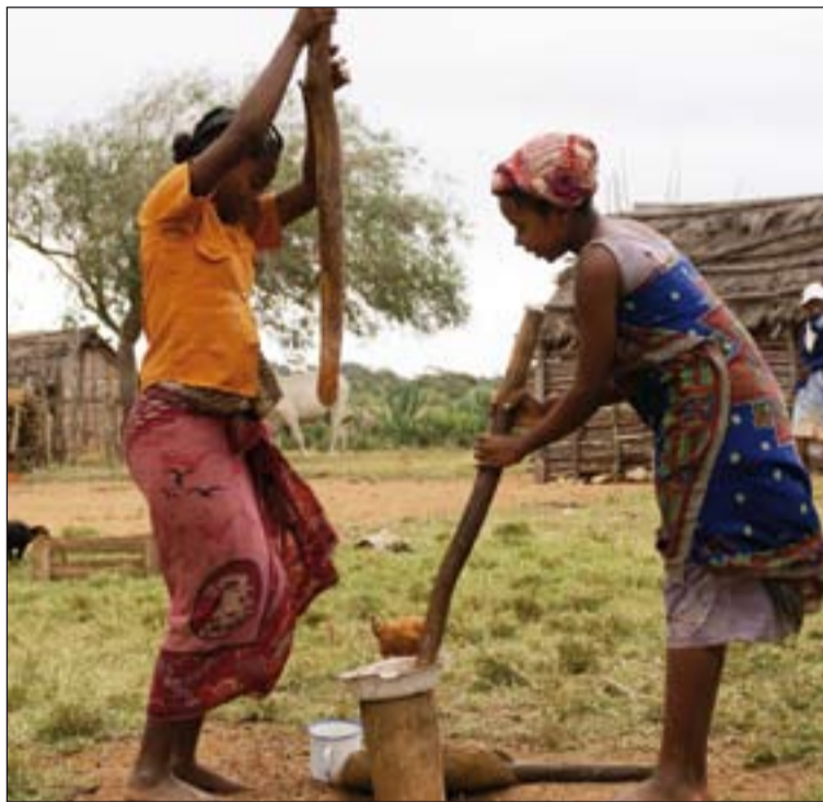
Mujeres de Madagascar moliendo trigo.

El 91,6 % de los fondos de Manos Unidas han sido destinados a los fines de la organización de lucha contra el hambre, la pobreza y sus causas en el mundo, un 6,5 % a la administración y estructura y el 1,9 % a la captación de recursos.