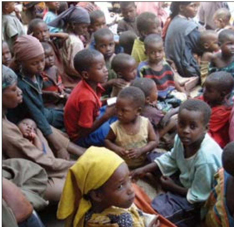
África tiene una tasa de fertilidad que dobla o triplica la de reposición.

También superan la tasa de reposición, entre otros, India y varios países de Asia y de