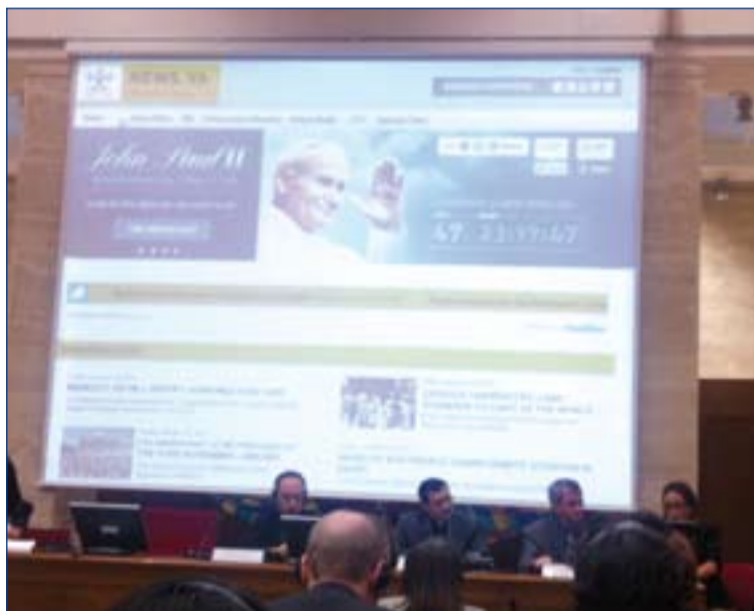
Presentación del nuevo portal del Vaticano

El presidente del dicasterio señaló que a partir de aho-