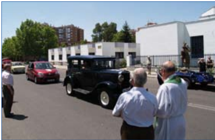
Bendición de vehículos con motivo de la fiesta de san Cristóbal.

Los obispos de la Comisión Episcopal de Migraciones afirman en su mensaje para la Jornada que quieren invitarnos “a ver el vehículo y la carretera como instrumentos providenciales a nuestro alcance para acercarnos a los que amamos y nos aman, para aproximar a los hombres y los pueblos, para encontrarnos con el Dios que en su Hijo Jesucristo se ha hecho com-