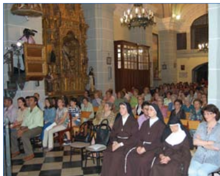
Numerosas personas han participado en los diversos actos organizados.