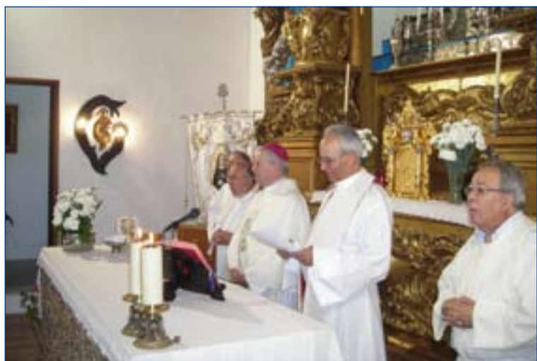
El Arzobispo de Évora presidió la Eucaristía en el Santuario.