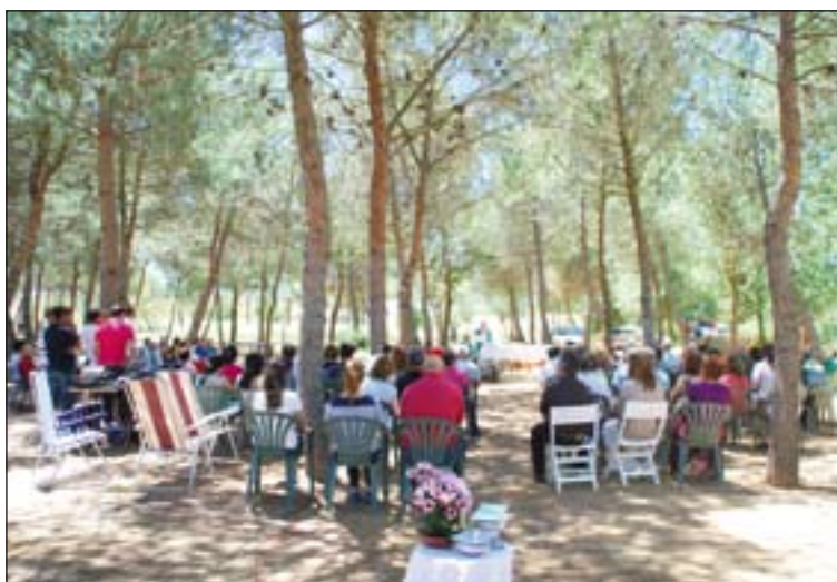
Celebración de la Eucaristía en el Pocito de San Juan Macías.

En primer lugar se expusieron los balances de las actividades del curso 2012-2013. Después se proyectó un excelente montaje audiovisual, que