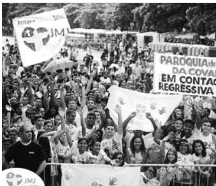
Numerosos jóvenes de Brasil se preparan para la JMJ de Río.