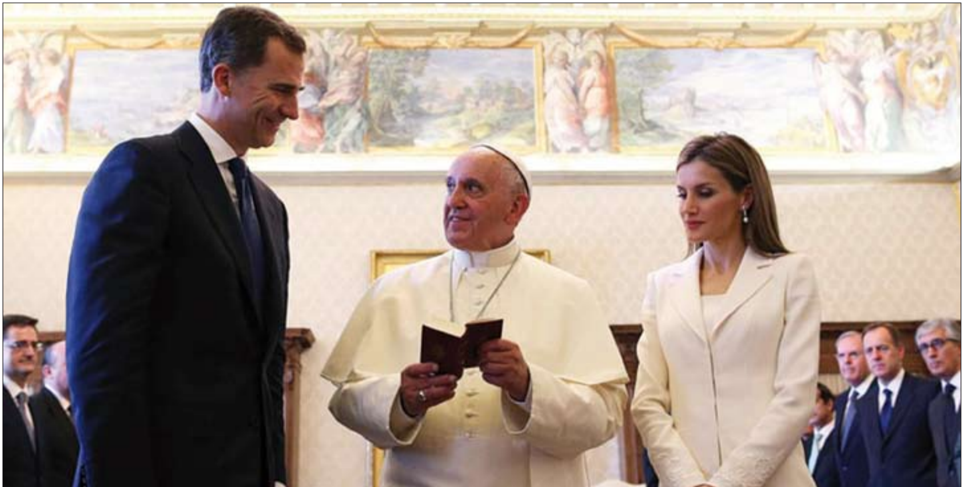
El Papa Francisco intercambia una serie de regalos con los Reyes de España.