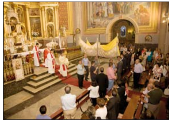
Momento de la procesión eucarística.

Finalizada la Eucaristía tuvo lugar la solemne procesión con el Santísimo hasta la Iglesia de Santa Clara. El incienso abrió la comitiva, le siguió la bandera