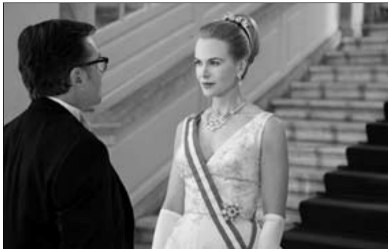
Escena de la película Grace de Mónaco .

2013), de Hirokazu Koreeda. 120 min. El innovador Koreeda ( Still Walking ) pone en escena una historia entrañable, dentro del estilo humanístico de sus maestros Akira Kurosawa y Yasujiro Ozu. Trata del valor de la adopción.