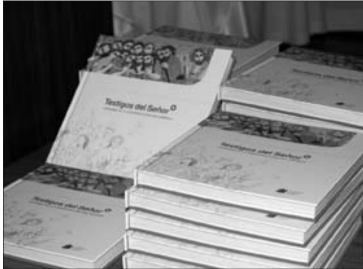
Ejemplares del Catecismo "Testigos del Señor"

La redacción y divulgación de este nuevo Catecismo es una acción contemplada en el vigente Plan Pastoral de la