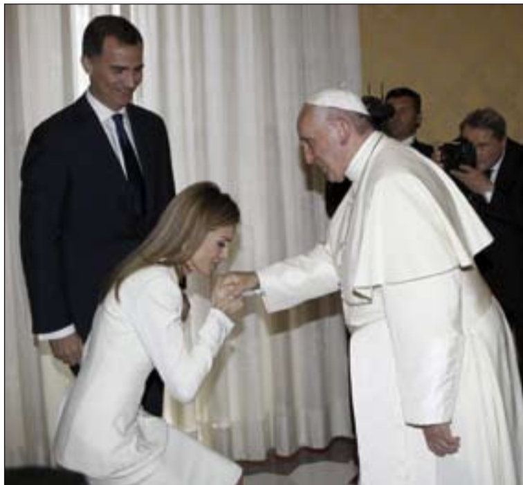
Los Reyes saludan al Papa Francisco.

El Santo Padre los recibió a las 12, en su biblioteca. Fueron unos 45 minutos de con-