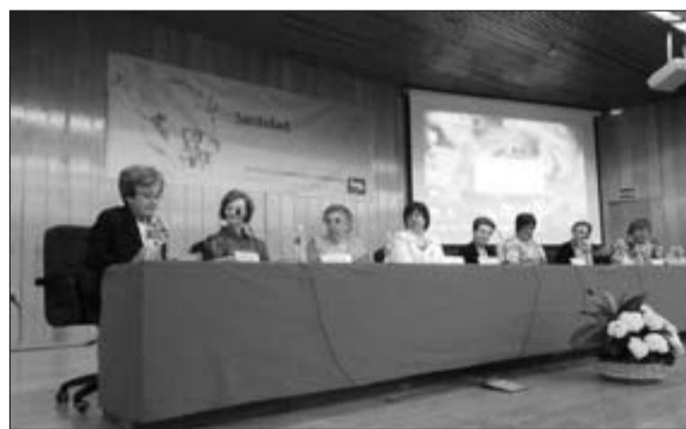
Algunas de las ponentes en las Jornadas de Formación y Convivencia.

La tarde estuvo dedicada a visualizar, escuchar y dar gracias a Dios porque el Espíritu Santo hizo surgir en un racimo de hombres y mujeres, santos de Dios, una forma de vida de consagración-secular basada en un gran amor al sagrario, la Eucaristía y la Virgen y, en-