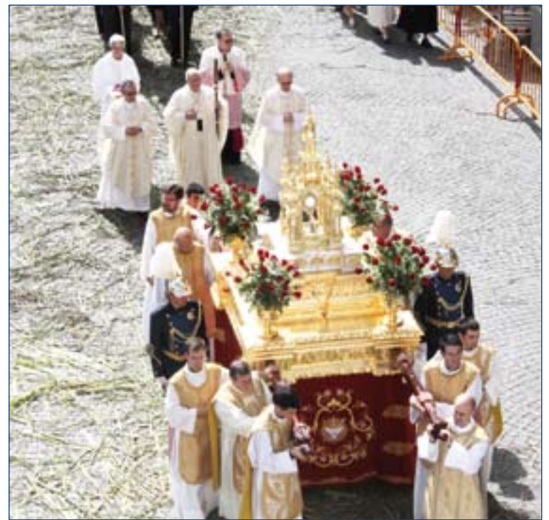
Procesión del Corpus en Badajoz