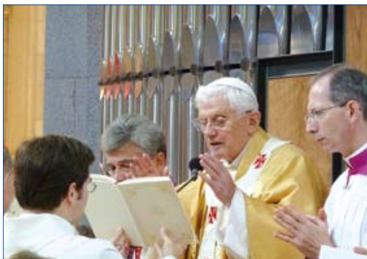
Benedicto XVI en la Basílica de la Sagrada Familia de Barcelona.