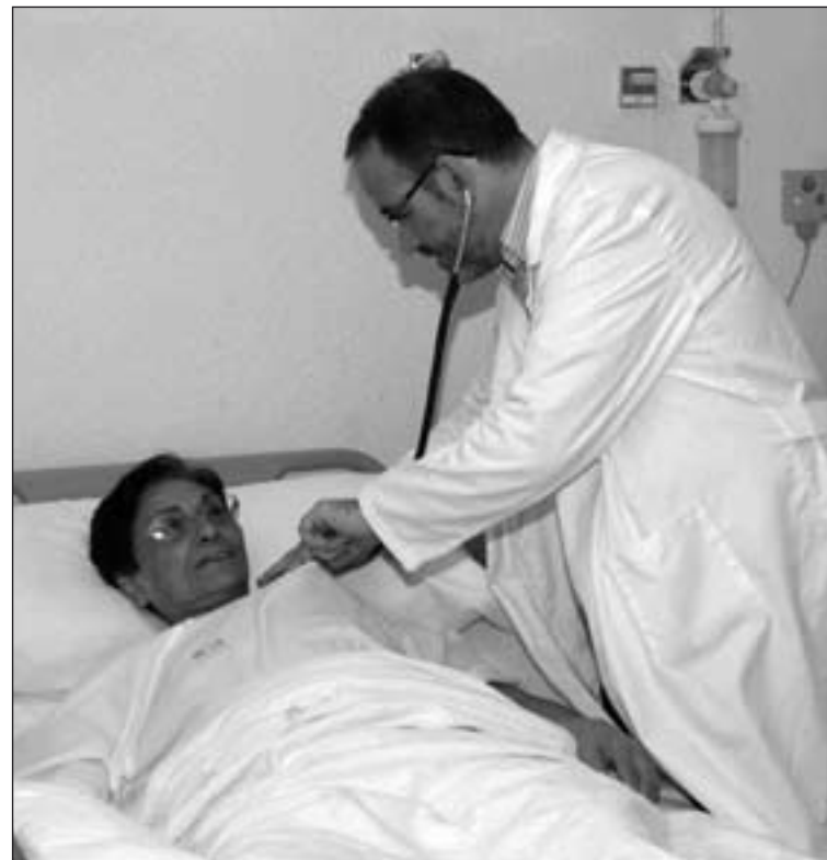
Los obispos advierten del riesgo de caer en conductas eutanásicas.

cabo en el próximo otoño para que puedan incluirse las enseñanzas del Santo Padre durante la Jornada Mundial de la Juventud.