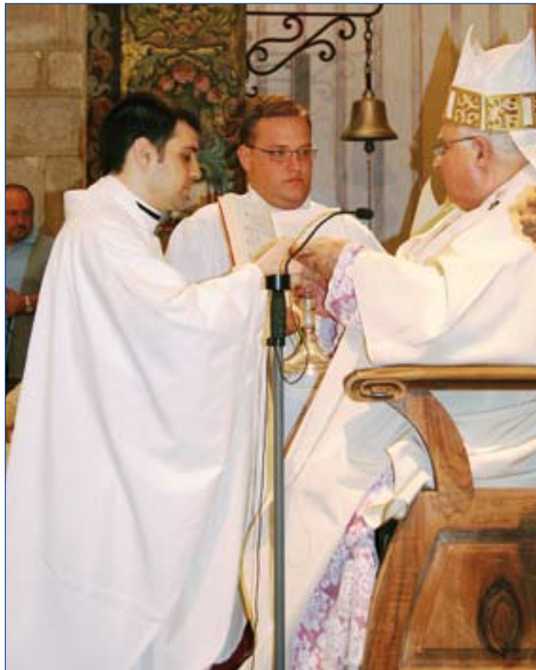
Uno de los nuevos presbíteros recibe el cáliz y la patena de manos del Arzobispo.