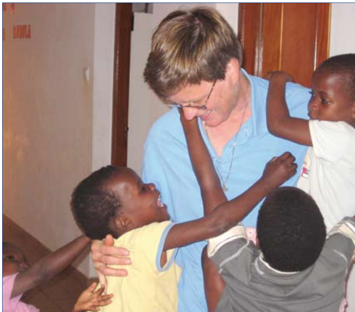
Niños residentes en un casa de acogida para huérfanos del Sida en Mozambique.

La Asamblea Parlamentaria del Consejo de Europa ha aprobado el pasado 28 de enero la Recomendación 1959, titulada Políticas de cuidados preventivos de salud en los estados-miembro del Consejo de Europa, en la que recoge hasta veinticinco directivas para proteger la salud de los europeos, las cuales invita a adoptar a todos los gobiernos del continente. El apartado 9.5 dice lo siguiente: "Promover una educación sexual integral de la salud, incluida la abstinencia, para prevenir la propagación de enfermeda-