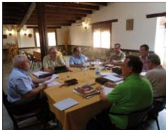
El Arzobispo reunido con sus vicarios en Burguillos del Cerro.

Entre otras actividades se han considerado la confección y publicación de la Agenda pastoral, la revisión de las distintas cartas pastorales para el próximo curso, así como la programación de distintas actividades para el próximo Año de la Fe, la proclamación de san Juan de Ávila como doctor de la Iglesia y los distintos eventos por los aniversarios de la apertura del Concilio Vaticano II, del Catecismo de la Iglesia Católica, el 50º aniversario de Caritas Diocesana y el 20º aniversario de la clausura del Sínodo Diocesano; también han estudiado la mejor manera de proveer los distintos nombramientos para el servi-