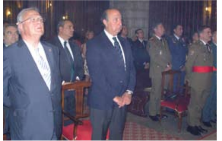
Algunas de las autoridades civiles y militares asistentes a la Eucaristía.

Don Santiago se refirió también a la crisis, de la que dijo que “no resulta difícil entender que la llamada crisis actual que estamos atravesando, y cuyas consecuencias tanto condicionan la atención a las distintas dimensiones de la personas y de la sociedad, no nacen simplemente de problemas técnicos, éticos o políticos de incidencia en el orden económico. La crisis tiene sus raíces en la inteligencia y en el corazón de