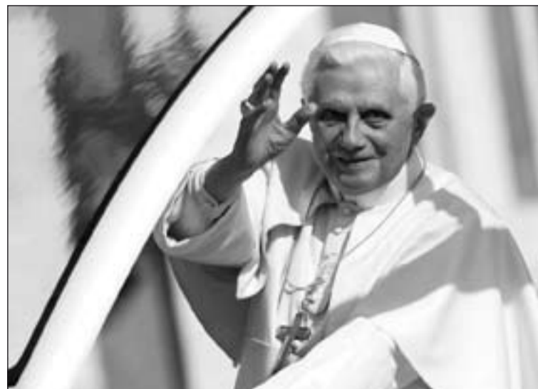
Benedicto XVI, en la plaza de San Pedro, en el Vaticano.

Durante su pontificado, el Papa ha realizado veintitrés viajes apostólicos fuera de Italia, entre ellos tres a España, y cinco Sínodos de los Obispos. Además, ha convocado la XIII Asamblea General Ordinaria del siete al veintiocho de octubre de 2012 sobre el tema: "La nueva evangelización para la transmisión de la fe cristiana".