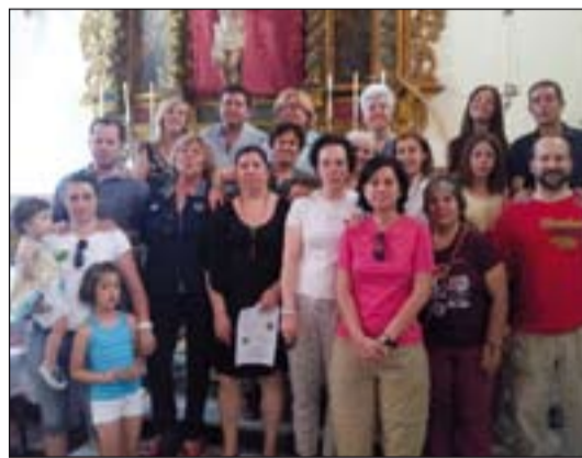
Miembros del grupo Animadores Misioneros

el estudio de las cuatro Obras Misionales Pontificias (Propagación de la fe, Infancia Misionera, San Pedro Apóstol y Pontificia Unión Misional). Tras la oración hubo una relajada convivencia en la “charca” de Proserpina, donde, durante la comida, de manera más informal, se compartieron las inquietudes y previsiones de cada uno para este verano.