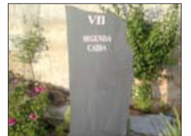
Una de las estaciones.

En la plaza que hay junto al templo parroquial del Espíritu Santo, en Badajoz, se ha colocado un Via Crucis realizado en 14 pizarras, que expresan las estaciones, y la piedra del centro, la XV, es la Resurrección. Es el primer Via Crucis que se encuentra en el exterior en la ciudad de Badajoz.