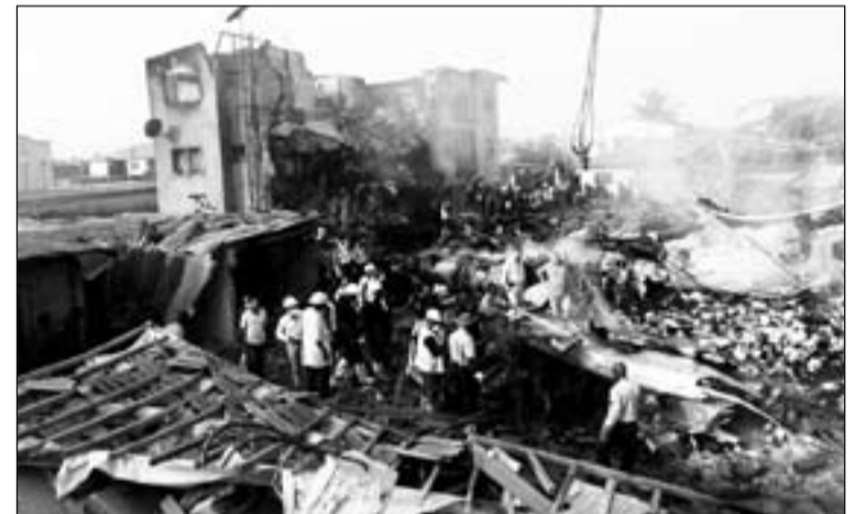
Último ataque contra los cristianos en Nigeria.

El arzobispo John Onaiye-kan habló sobre la creciente impaciencia de la comunidad cristiana ante la violencia, afirmando que "se está haciendo cada vez más difícil