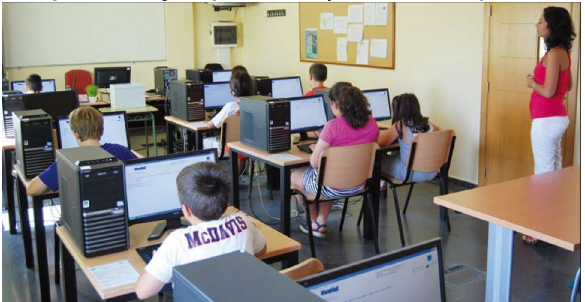
Los profesores aplican las nuevas tecnologías a las clases de Religión.