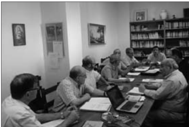
Mesa de trabajo del encuentro de Consiliarios.

También compartieron la mesa y quedaron emplazados para septiembre, fecha en la que comienzan la andadura de un nuevo curso que pretenden que esté cen-