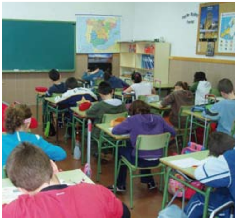
Niños realizan actividades durante una clase de Religión.

Sí, la matrícula se suele hacer entre el 1 y el 15 o entre el 1 y el 20 de julio, dependiendo del centro, reciben un papel en el que se les dice que