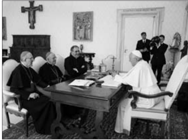
Audiencia del Papa con el Presidente, Vicepresidente y Secretario General de la CEE.

Por otro lado, "con gran cordialidad y cariño, ha animado a los obispos a continuar poniendo a la Iglesia en un estado de misión permanente, transmitiendo la alegría del Evangelio, siempre con vigor renovado y particular afán misionero".