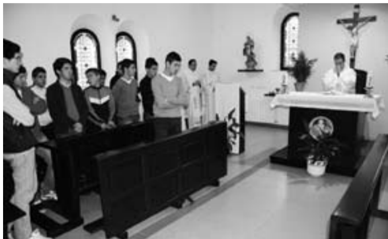
Celebración de la Santa Misa.

Por otro lado, para el 48 por ciento la Iglesia es fundamental en la conservación del patrimonio, su mensaje ayuda a vivir más moralmente (44 por ciento) y su labor social ahorra dinero al Estado (41 por ciento).