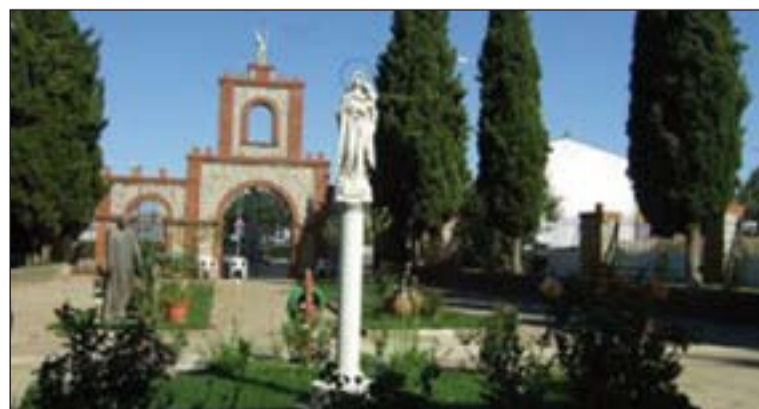
Exteriores de la Casa de la Misericordia de Alcuéscar.

Durante los días que los seminaristas pasaron en la Casa de la Misericordia de Alcuéscar, participaron también en la procesión del Corpus Christi, que tuvo lugar el jueves, con todos los enfermos de la Casa.