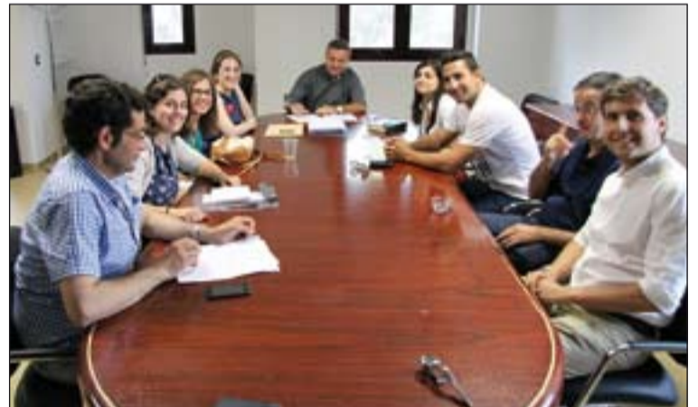
Miembros de la Delegación para la Pastoral Universitaria.

La Delegación Episcopal para la Pastoral Universitaria ha clausurado el curso con una serie de evaluaciones y programaciones de cara al próximo curso. Entre ellas destaca el crecimiento de universitarios que han entrado en contacto con la pastoral y el desarrollo de múltiples actividades en las diversas áreas que comprende esta pastoral: celebrativas, formativas y caritativas. Del curso pasado se destaca que era la primera vez que se presentaba un documento del Papa en la Universidad, concretamente la exhortación apostólica Evan-