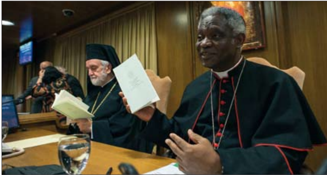
El cardenal Turkson (dcha.), pres. del Consejo Pontificio de Justicia y Paz, y John Zizioulas, Metropolitano de Pérgamo, fueron dos de las personas que presentaron la encíclica “Laudato si” en el Vaticano.

En el capítulo segundo , titulado “El Evangelio de la creación”, el Pontífice se refiere a la luz que ofrece la fe; la sabiduría de los relatos bíblicos; el misterio del universo; el mensaje de cada criatura en la armonía de todo lo creado; una comunión universal; el destino común de los bienes; y la mirada de Jesús.