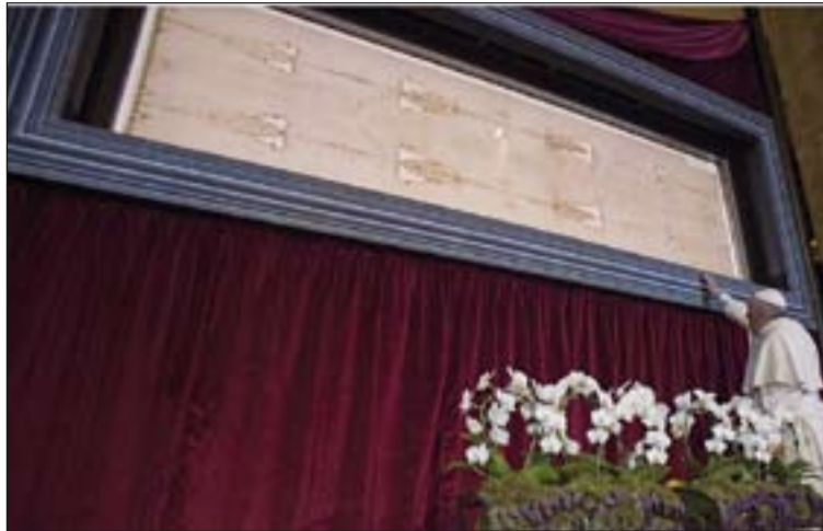
El papa Francisco ante la Sábana Santa de Turín

En su homilía, el Pontífice destacó tres características del amor de Dios: es un amor