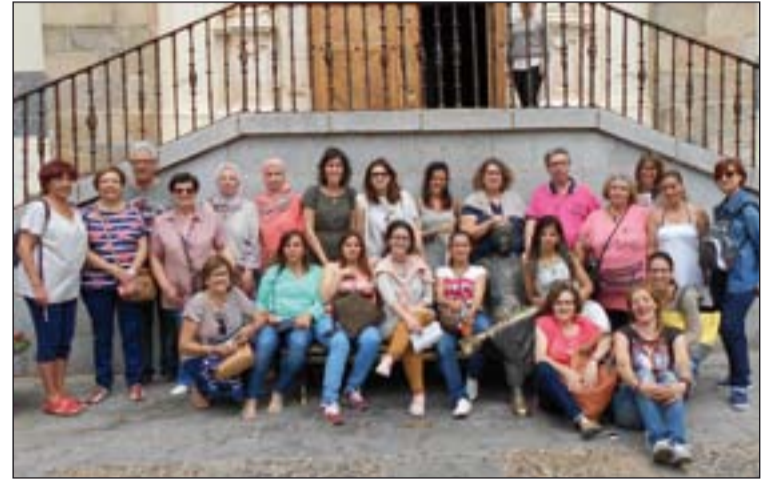
Programa de Mujer que visitó Jerez de los Caballeros.

Un grupo de 25 personas de la Cáritas parroquial de Ntra. Sra. de la Asunción, en Badajoz, han visitado Jerez de los Caballeros, para celebrar el fin de curso del Proyecto de Mujer.