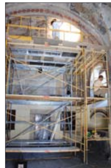
Trabajos de restauración en la sacristía

Después de tanto tiempo, las pinturas se encontraban bastante deterioradas, por lo que se espera que los trabajos de restauración duren 4 meses.