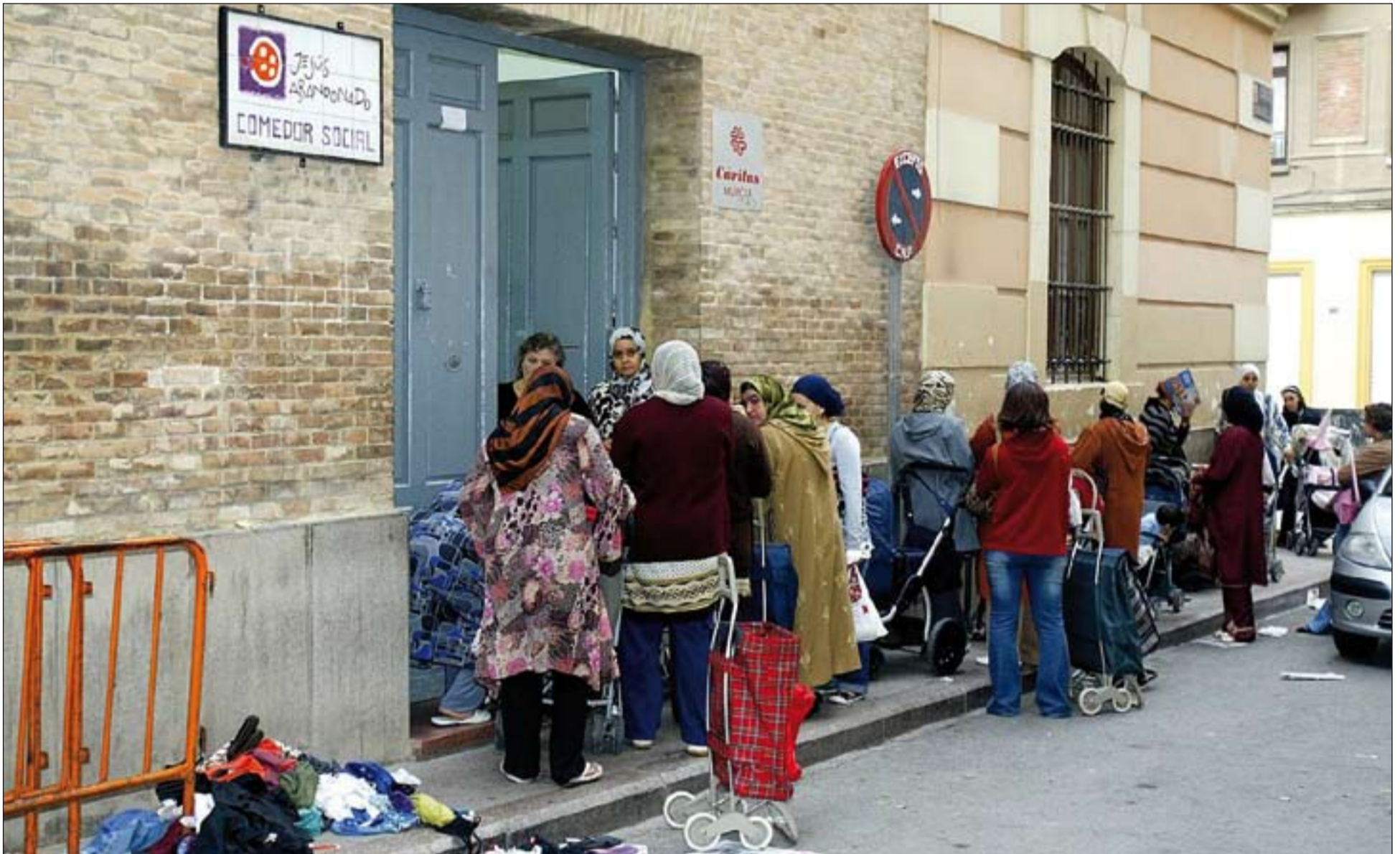
Personas esperando para entrar en el comedor social que regenta Cáritas Murcia.