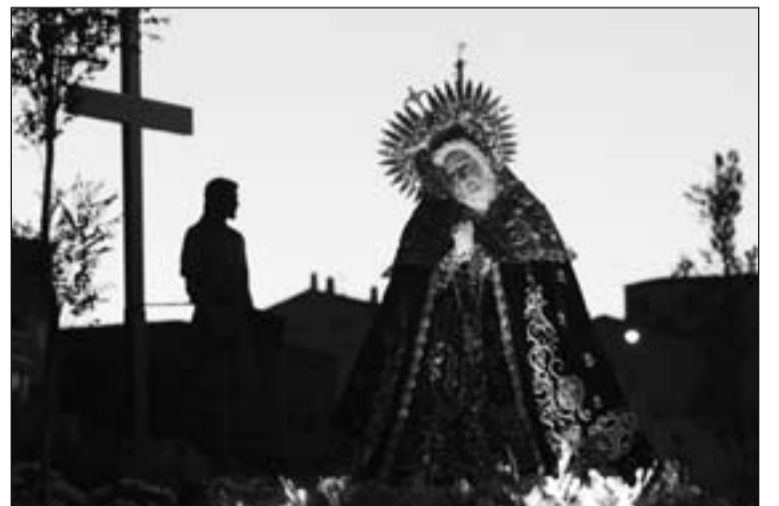
La Virgen de la Soledad. Al fondo, la imagen de Jesús Obrero.