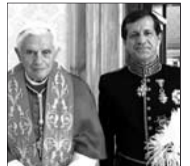
Benedicto XVI con Eduardo Gutiérrez Sáenz de Buruaga.

Es autor de numerosos artículos sobre cuestiones internacionales en los diarios El País, ABC, La Gaceta, y en revistas especializadas. Zenit.org