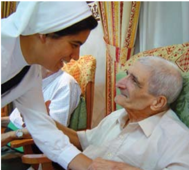
La Iglesia ha aumentado su actividad asistencial en los últimos años.

En el apartado dedicado a la actividad litúrgica, se detallan los datos sobre la práctica sacramental en España. En 2010, hubo 349.820 bautismos, 280.654 primeras comuniones,