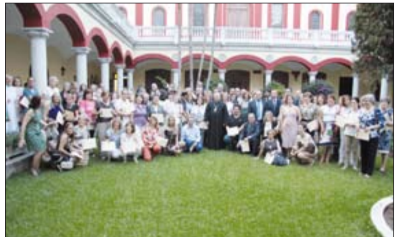
Arriba foto de familia en la entrega de diplomas de Villafranca de los Barros; abajo, en la de Badajoz.

sis ha puesto en marcha para la formación de los laicos, junto a las Escuelas de Agentes de Pastoral y el Instituto Superior de Ciencias Religiosas, que tiene rango universitario.