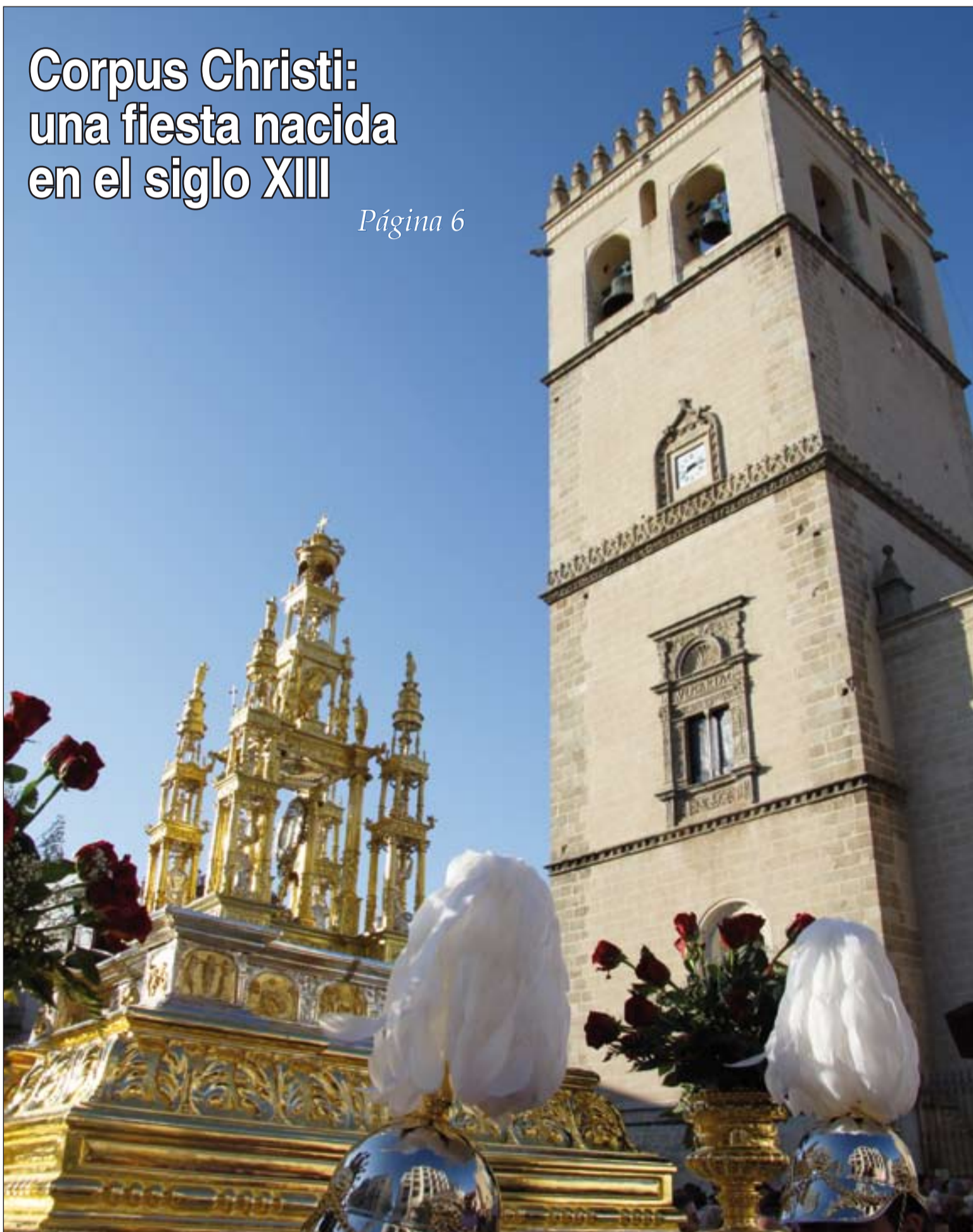
Salida de la procesión del Corpus de la Catedral de Badajoz.