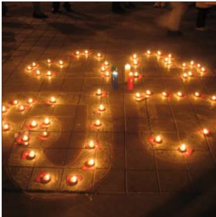
Anagrama de Cáritas realizado en una campaña de sensibilización.

Al mismo tiempo nos empuja a defender los derechos de los más pobres, a crear una nueva mentalidad que nos lleve a pensar en términos de comunidad y a construir al servicio del ser humano, promoviendo el desarrollo integral de los pobres y cooperando para resolver las causas estructurales de la pobreza.