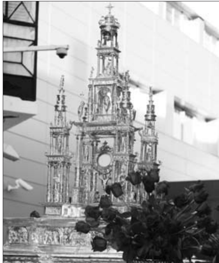
Procesión del Corpus en Badajoz.

Dios utilizó a santa Juliana de Mont Cornillon para propiciar esta fiesta. La santa nace en Retines cerca de Liège, Bélgica, en 1193. Quedó huérfana muy pequeña y fue educada por las monjas Agustinas en Mont Cornillon. Cuando creció, hizo su profesión religiosa y más tarde fue superiora de su comunidad. Por diferentes intrigas tuvo que irse del convento. Mu-