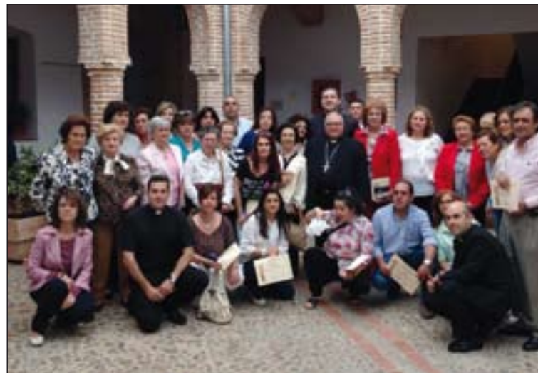
Alumnos de las EFB junto al arzobispo emérito D. Santiago.

ron todo lo bueno que ha supuesto para ellos la formación y agradecieron a la Diócesis que tenga este tipo de estructura formativa que tantas cosas buenas está aportando al laicado. Finalizó el tiempo de las palabras con una reflexión de Don Santiago García Aracil, arzobispo emérito, que subrayó su empeño por la formación del laicado y animó a todos para que continuasen en este empeño. El Director tomó la palabra y agradeció al Arzobispo emérito todo lo que ha hecho en pro de la formación. El acto concluyó con la entrega de los diplomas a todos los alumnos y con un café.