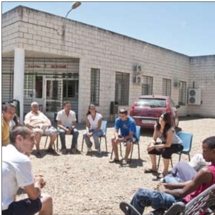
Acogidos en Centro Hermano.