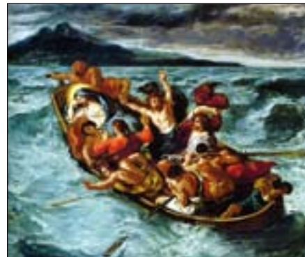
Jesús dormido durante la tempestad (1853). Eugène Delacroix. Museo Metropolitano de Arte. Nueva York.

-«¿Pero quién es este? ¡Hasta el viento y las aguas le obedecen!»