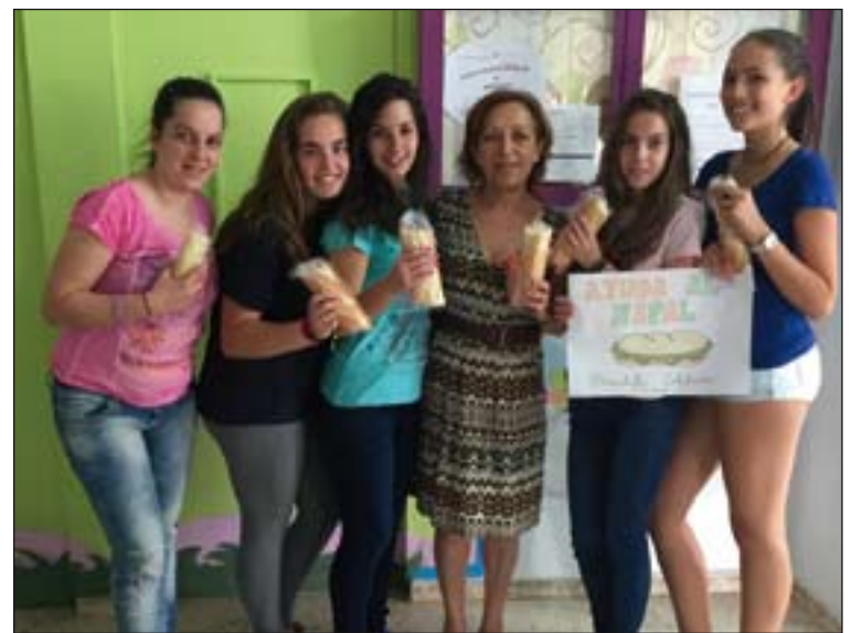
Alumnas y profesora con el bocadillo solidario.

Los alumnos de 6º curso han hecho de voceros para sus compañeros en la etapa