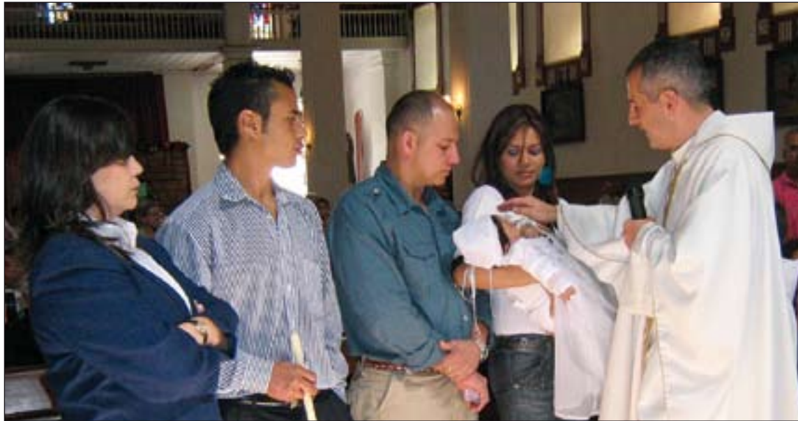
La Iglesia en España celebró 254.222 bautizos.

En la memoria se detalla el dinero efectivamente recibido