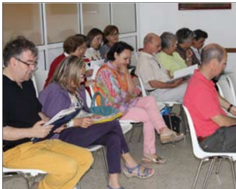
Participantes en este encuentro.

Los participantes pudieron visitar un taller de mujer que se desarrolla en Almendralejo y en el que se realizan productos artesanales que después de ponen a la venta para