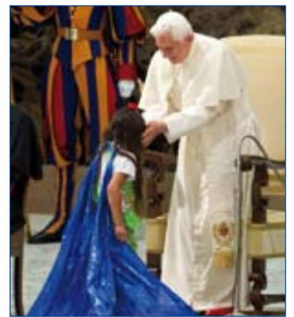
Benedicto XVI pidió el fin del rechazo a la etnia gitana.