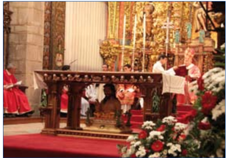
El Arzobispo presidió la celebración.

Rafael Díaz Salazar presentó una ponencia sobre el papel y el valor de lo religioso en una sociedad laica. Este tema había sido reflexionado durante el curso por cada una de las diócesis participantes. Además se realizó una mesa de experiencia de profesionales de distintos ámbitos (educación, sanidad, igualdad, política) y se pusieron en común situaciones profesionales reflexionadas en grupos diversos. Por último, se celebró la Eucaristía.