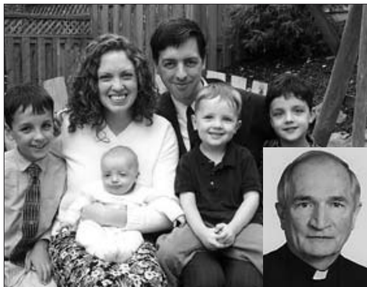
Monseñor Tomasi (en la foto pequeña) pidió una mayor protección para la familia.

El prelado recordó en este sentido el llamamiento que el Papa Benedicto XVI hizo en el año 2009, a la comunidad internacional, para que ofreciera "una respuesta adecuada