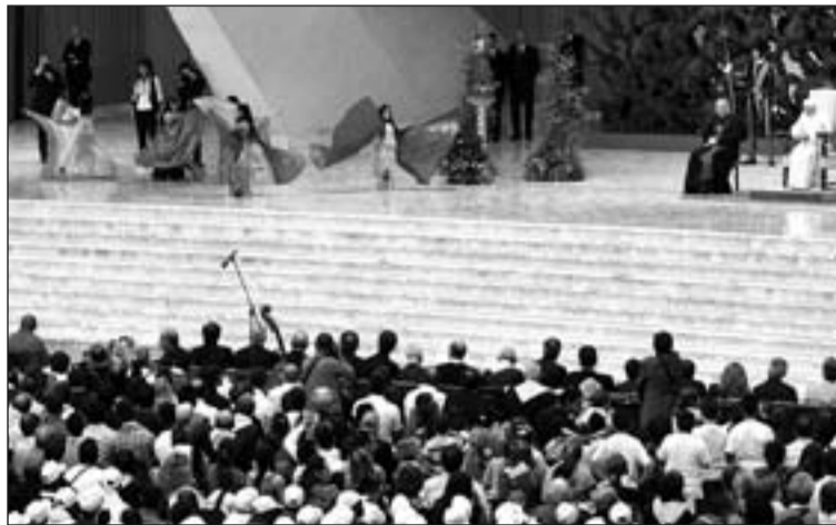
Benedicto XVI recibió a más de dos mil personas de etnia gitana.

"Vuestra historia -continuó- es compleja y, en algunos períodos, dolorosa. (...) Os habéis quedado sin hogar y habéis considerado idealmente todo el continente como vuestra casa.