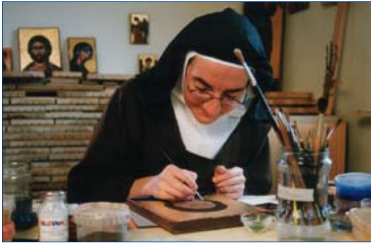
Religiosas de vida contemplativa, dedicadas a la oración y el trabajo.

El objetivo de esta Jornada es sensibilizar sobre el valor de la Vida Contemplativa, cuyos miembros se consagran enteramente a Dios por la oración, el trabajo y el silencio. En su exhortación apostólica postsinodal Verbum Domini , el Papa ha recordado que "la gran tradición monástica ha tenido siempre como elemento constitutivo de su propia espiritualidad la meditación de la Sagrada Escritura".