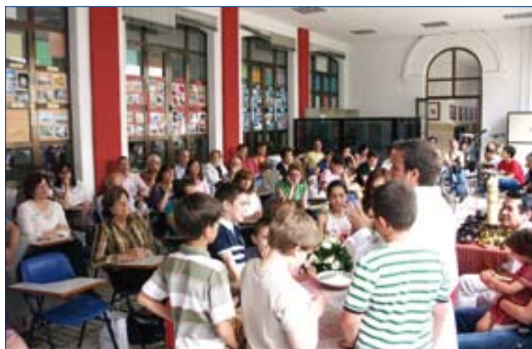
Padres e hijos participaron en este encuentro.

Durante el encuentro, cerca de treinta niños y jóvenes, hasta 16 años, han recibido también catequesis y han vivido un ambiente festivo de encuentro con Dios en familia.