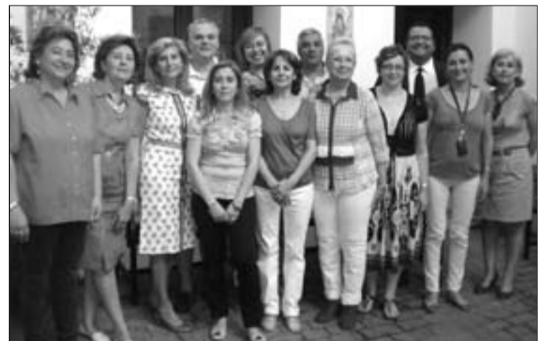
Miembros de la Escuela de Agentes de Pastoral de Mérida.

Otra clausura ha sido la del curso de perfeccionamiento "Claves Teológicas y Pedagógicas de la E.R.E", organizado por los profesores de la universidad que están encargados de las asignaturas de preparación para los futuros profesores de Religión Católica en Infantil y Primaria. Durante 5 meses 75 alumnos, que ya han terminado los estudios de Magisterio, han seguido el curso en el que se ha abordado el hecho religioso y