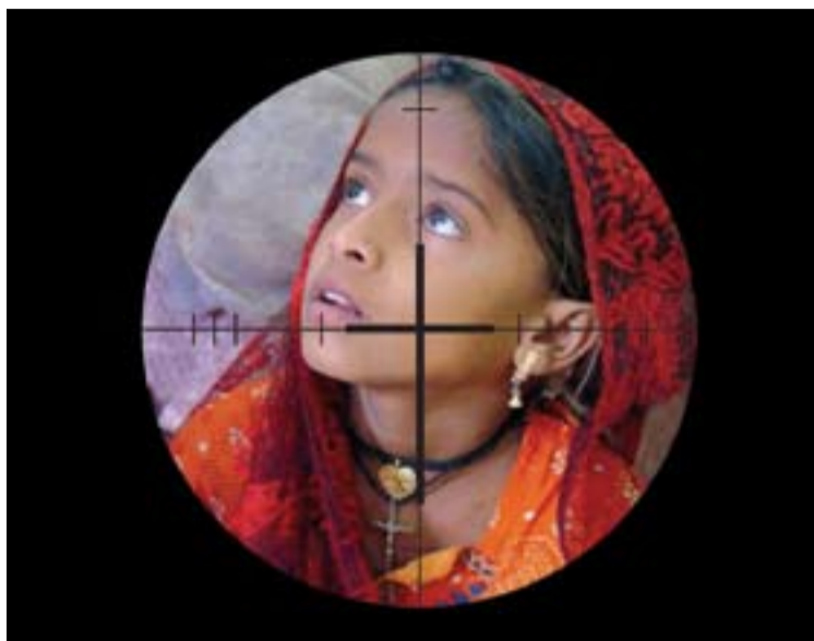
Imagen del cartel de la exposición "Cristianos Perseguidos", de AIN

En Asia hay países que conculcan los derechos humanos en general por razones políticas, entre ellas las libertades