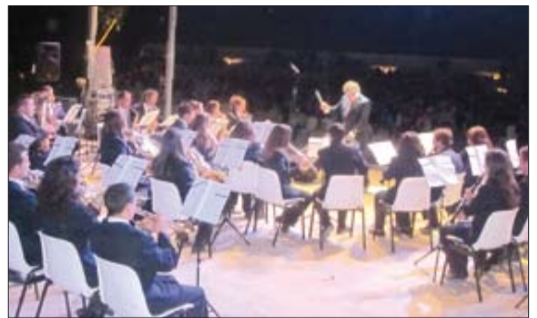
Actuación de la banda de Los Santos en el Festival Racimo Solidario.

En total, se vendieron 1.750 entradas -incluida la fila 0- que, tras descontar los gastos de ilu-