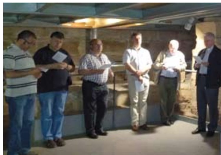
El Arzobispo de Évora, dcha., rezando en el túmulo de santa Eulalia.

A todos se les regaló el libro sobre La Antigua Sede Metropolitana de Mérida , y al Arzobispo el Antifonario de la Concatedral.