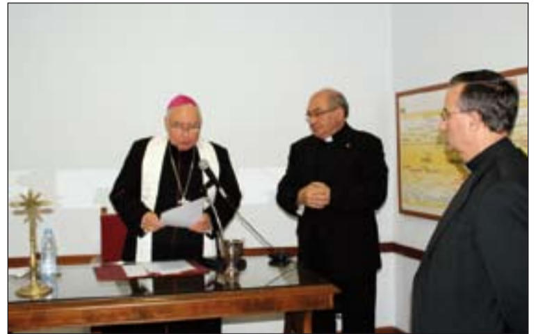
El Arzobispo, con el párroco de Santa María y el Vicario General (dcha.).