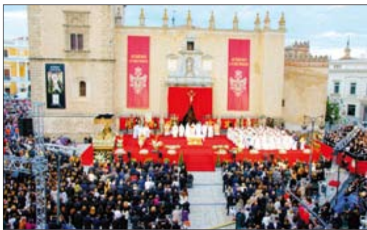
Arriba, los obispos firmando las actas de la Coronación. Abajo, aspecto que presentaba la plaza de España.

Tras la homilía, en torno a las 10 de la noche, llegaba el momento de la coronación acompañada de una lluvia de pétalos lanzados desde la torre de la Catedral, del repique de campanas del templo catedralicio y seguida del canto del Himno de la Coronación, interpretado por cinco coros con 102 miembros a los que se sumaron los costaleros de la Virgen, acompañados por la Banda Municipal de Música.