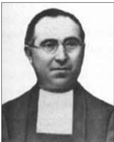
Hermano Aureliano Ortigosa.

La beatificación del hermano Aureliano Ortigosa será en Tarragona el 13 de octubre junto a la de otros 500 mártires, la más numerosa en la historia de la Iglesia. Se trata de mártires de la persecución religiosa de los años 30 del si-