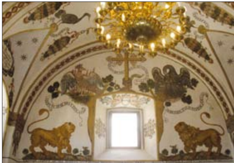
Bóveda de la sacristía tras la restauración.

Las importantes pinturas murales de la sacristía de Cabeza del Buey han sido restauradas en su totalidad. De carácter eucarístico, datan del S. XVIII y se encontraban en muy mal estado. La obra de restauración ha durado unos 10 meses, y además se ha completado el cuadro de la Última Cena, desaparecido antiguamente, que corona toda la obra pictórica.