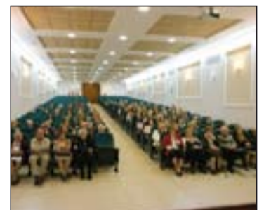
Participantes en el encuentro.