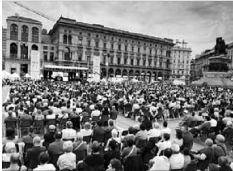
Plaza del Duomo en Milán durante la celebración de la iniciativa.

"Los Diez Mandamientos no son una limitación, sino una indicación para la libertad". Este ha sido el centro del vídeo mensaje del Papa Francisco transmitido a las miles de personas reunidas en la Plaza del Duomo de Milán para participar en la iniciativa "Diez Plazas para Diez Mandamientos".