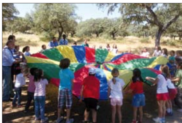
Los niños se divirtieron con los juegos preparados por los scouts católicos.

Los peregrinos también conocieron las dependencias del Monasterio y pudieron recorrer algunas calles de la localidad.