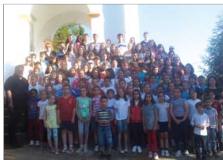
Niños y jóvenes que participaron en las actividades de fin de curso.

Semana de la Parroquia de San José.- La Parroquia San José de Badajoz ha celebrado la Semana de la Parroquia con el objetivo de profundizar en el sentido de comunidad y de impulsar la implicación de todos sus miembros en ella. Entre las diversas actividades destacaron la Asamblea parroquial en la que se reflexionó acerca de los retos que tiene la Parroquia y una jornada de convivencia en el campo en la que los niños fueron acompañados por el Movimiento Scouts Católico.