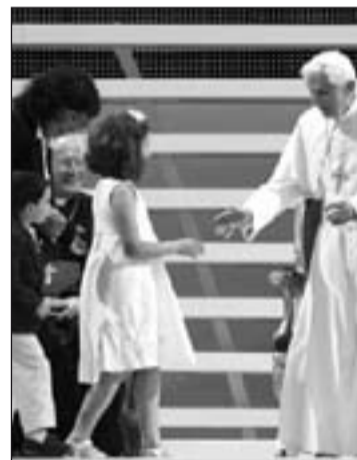
Benedicto XVI en el Encuentro Mundial de las Familias, en Milán.

Benedicto XVI también se dirigió a aquellos fieles que, a