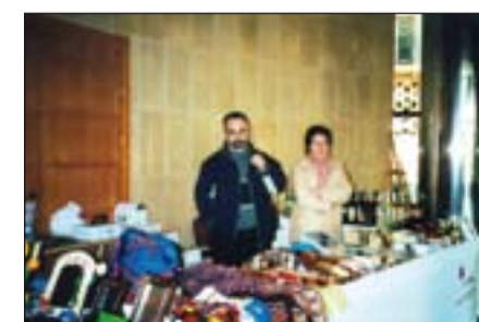
Stand de Comercio Justo.