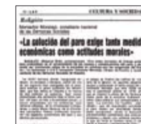
ABC del 20-03-82 en el que se recoge esa información.

Siendo ya Obispo de Badajoz D. Antonio Montero Moreno, se celebra en Badajoz la Semana Social, del 18 a 21 de marzo de 1982, bajo el slogan "El Paro, un reto a la sociedad actual". Participan 300 semanistas de toda España. Los obispos extremeños al presentar esta Semana Social hacen suyo el mensaje de la Junta Nacional: "Esta Semana Social no quiere ser un estudio más, sin incidencia real en el mundo del desempleo, ni una voz más de soluciones y promesas fáciles. Tampoco una plataforma de determi-