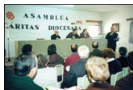
Asamblea diocesana de 1993.

En 2003 la Asamblea Diocesana de ese año aprobó el Plan Estratégico sobre la acción de Cáritas, poniendo el acento en 6 ejes: Últimos y no atendidos; comunidades cristianas; sociedad; nuestro modelo social; organización y coordinación; y gestión. Se incide espe-