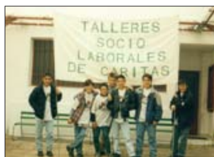
Jóvenes participantes en los talleres.

En los primeros años de 2000 se ponen en marcha programas operativos con recursos de la Comunidad Económica Europea (CEE): Programa de Talleres sociolaborales; Proyecto Aldaba; Programa de reutili-