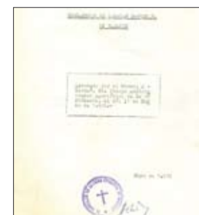
Reglamento de Cáritas de 1970.

causas que plantea la pobreza en la Diócesis. d) Realizar servicios especializados que puedan surgir en el campo de la Acción Social. e) Programar e impulsar actuaciones de desarrollo comunitario.