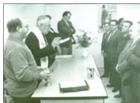
Inauguración del centro de Proyecto Vida, en la calle Bravo Murillo, en Badajoz.

cados a la toxicomanía y a los sin techo: El Proyecto Vida (1993); Centro Hermano (1996), y el Padre Cristóbal (1998).