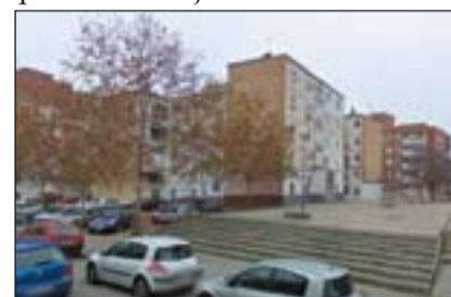
Viviendas del Grupo Santa Teresa.

bajo poder adquisitivo y situaciones precarias. En este proyecto se contemplaba también dejar espacio para la construcción de tres escuelas y una guardería infantil. Actualmente estas viviendas son conocidas como "Grupo de Santa Teresa", detrás del Banco de España en Badajoz ciudad.