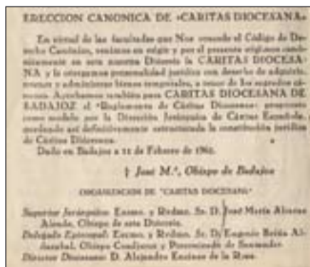
Documento de la erección de Cáritas diocesana.