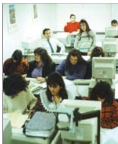
Taller socio-laboral (1990).

A partir del año 1985 Cáritas va expandiéndose y poniendo en funcionamiento los grandes proyectos y programas: Animación y formación; Empleo y economía; Tercera edad; Drogadependencia y delincuencia; Cooperación Internacional; Transseúntes; Juventud e infancia; Animación y comunidad rural; Atención primaria y Mujer.