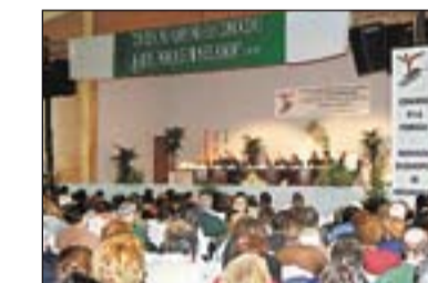
Inauguración del Congreso.

En coordinación con Cáritas Regional se publica el Estudio sobre las condiciones de vida de la población pobre de Extremadura (1998). Se pone de manifiesto que en Extremadura existen 17.000 familias en situación de pobreza severa. En 1999 se celebra el Congreso Regional: La Iglesia en Extremadura ante la pobreza. Un acontecimiento de gran en-