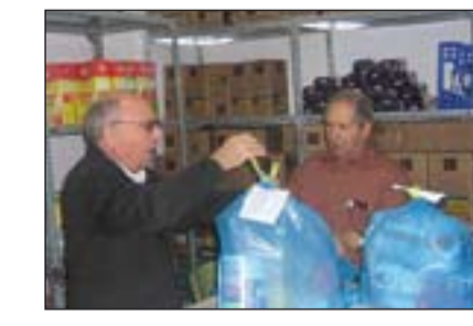
Entrega de alimentos en Cáritas Almendralejo.

Ante la crisis económica (2010-2012) Cáritas tiene que atender a los afectados por la misma. Se duplican las familias que vienen a nuestras Cáritas. Según los datos recogidos en la Memoria de 2011, en dos años ha aumentado un 40% las personas atendidas en los servicios de acogida; el número de voluntarios aumenta en un 30% en los últimos dos años (actualmente cuentan con 1889) y