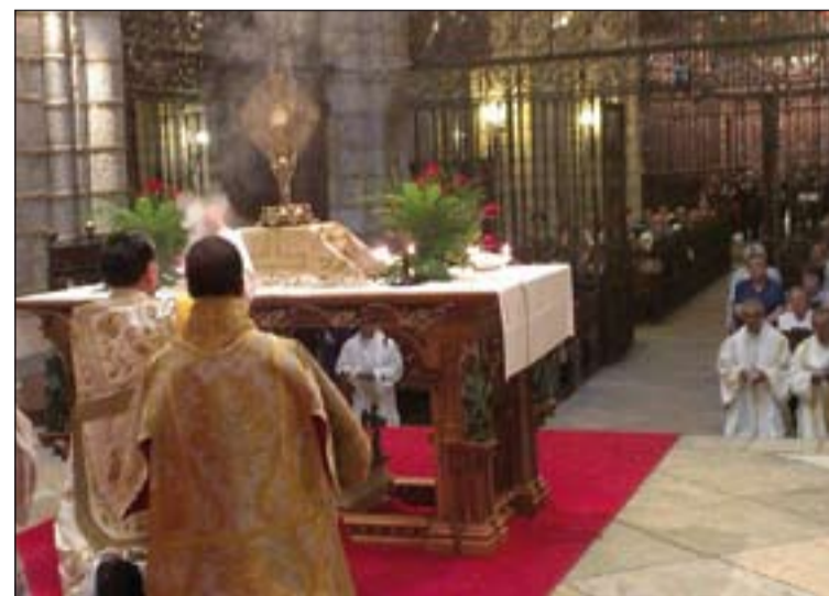
Adoración Eucarística celebrada en la Catedral de Badajoz.

A las 19,00 h. daba comienzo la eucaristía, que estuvo seguida de la procesión de Cristo sacramentado por las calles de la ciudad de Badajoz. Miles de fieles acompañaron al Santísimo en la tradicional procesión que contó, como es tradicional, con la presencia del Alcalde de la ciudad y autoridades civiles y militares, además de una representación de todas las cofradías de la ciudad y mo-