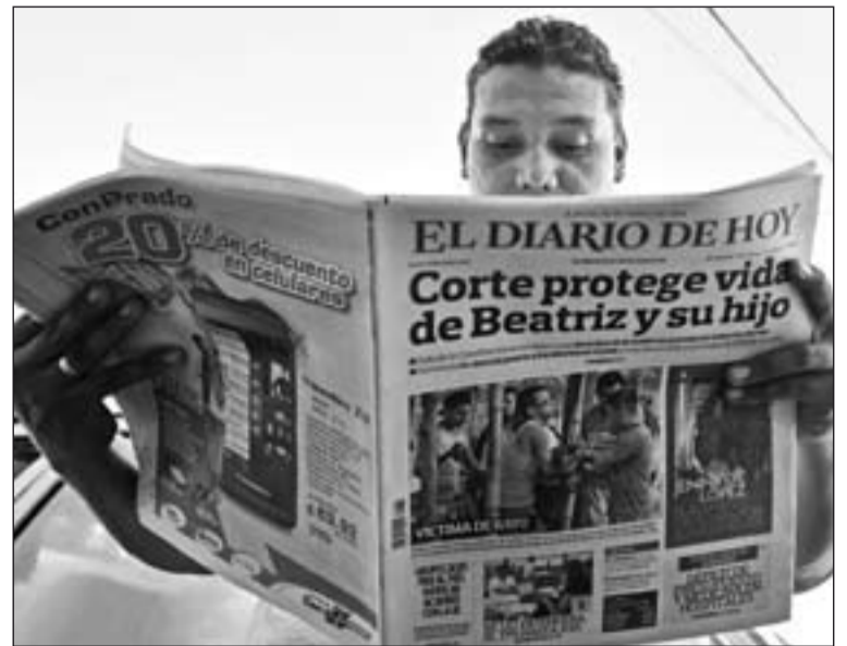
Medios de comunicación de todo el mundo se han echo eco de la historia de “Beatriz”.

Ante la contundente evidencia médica, la Sala de lo Constitucional de la CSJ determinó el 29 de mayo rechazar la ac-