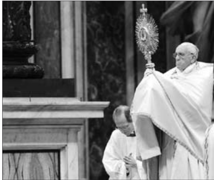
El Papa durante la Adoración Eucarística en la Basílica de San Pedro.

La segunda intención del Papa Francisco fue: "Por aquellos que en los diversos lugares del mundo viven el sufrimiento de nuevas esclavitudes y son víctimas de la guerra, de la trata de personas, del narcotráfico y del trabajo "esclavo"; por los niños y las mujeres que padecen todas las formas de la