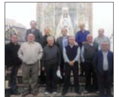
Sacerdotes asistentes a la convivencia.

La jornada concluyó en un ambiente muy cordial, con una comida compartida en el Cortijo de Los Cotos, en Monesterio.