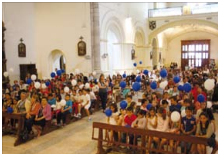
Niños que participaron en el acto de clausura.

acogida por los parroquianos, no solo por lo novedoso de la muestra sino también por la presencia activa de la Hdad. en los actos referentes a la Virgen María desde dentro de la Parroquia, culminando dicho acto con una procesión celebrada por los niños de catequesis el Viernes 31. Al finalizar la procesión los niños hicieron una suelta de globos.