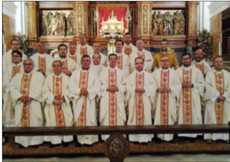
No faltó la oración por las más de 60 parroquias del arciprestazgo y el recuerdo al pastor de nuestra archidiócesis.