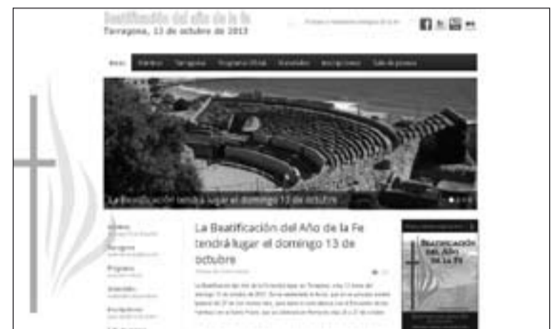
Web de la beatificación de 500 mártires en Tarragona en el mes de octubre.

Con estos noventa y cinco nuevos mártires españoles asesinados por "odio a la fe" el número de mártires españoles elevados a los altares se