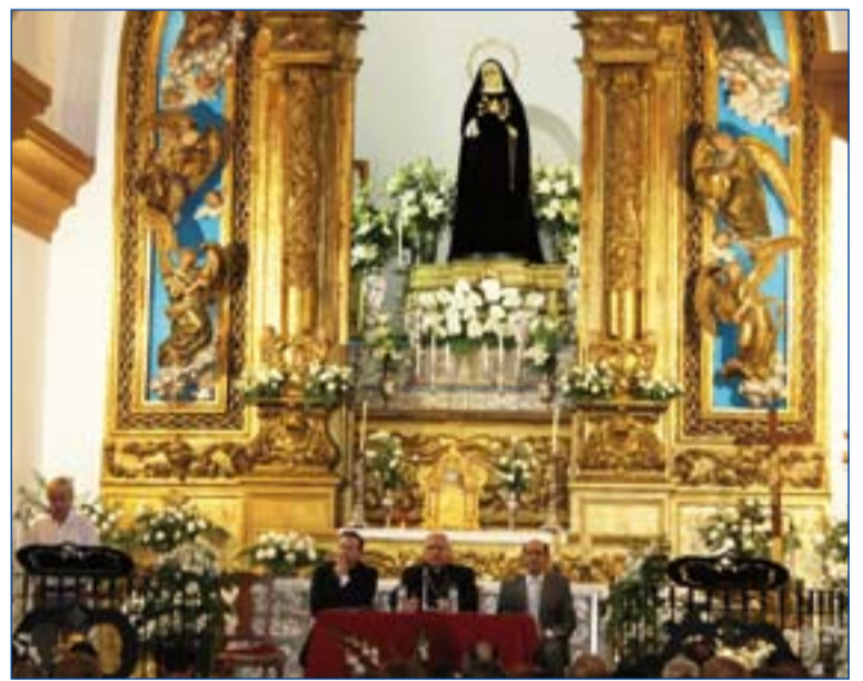
Presentación del Plan Pastoral arciprestal en el santuario de Chandavila, en La Codosera.