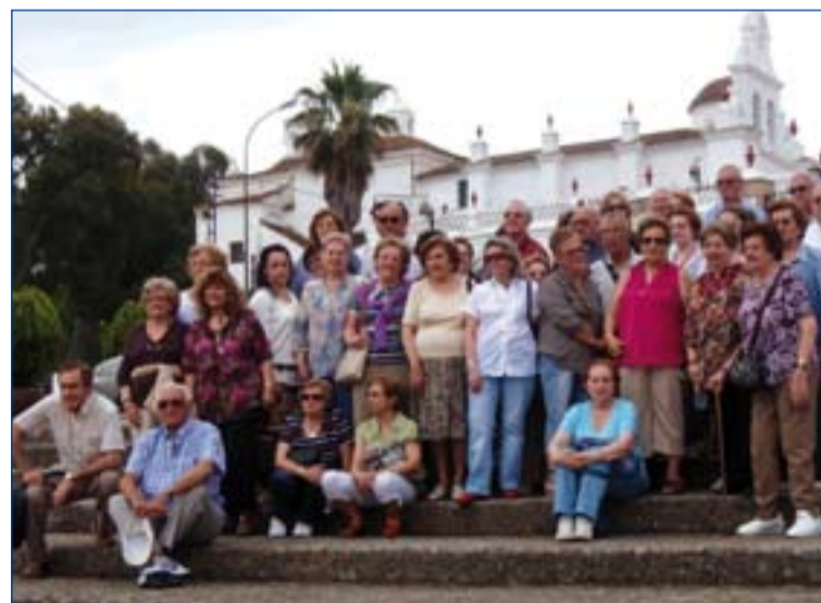
Los peregrinos en el Santuario de la Virgen de Carrión.