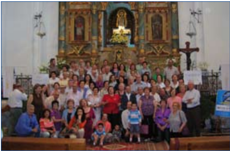
Participantes en la ultreya en Puebla de Sancho Pérez.