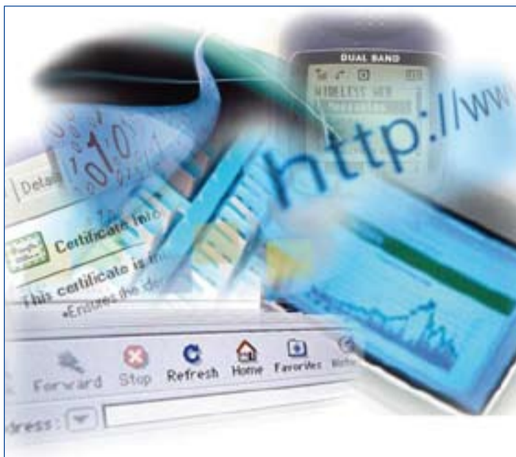
Las nuevas formas de comunicarse modifican las relaciones personales.

En esta jornada no nos podemos olvidar de los tradicio-