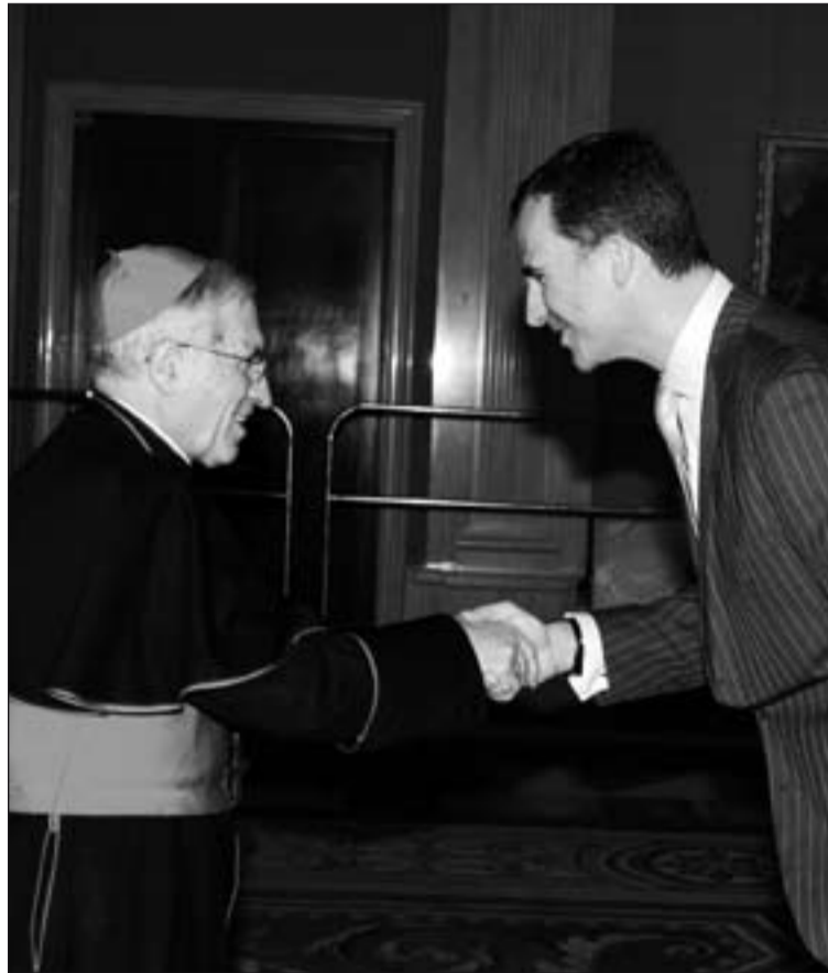
El Príncipe de Asturias recibió al Cardenal Rouco Varela.

Actualmente cerca de 400.000 jóvenes de 182 países se han inscrito ya en la Jornada Mundial de Madrid.