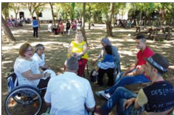
Los inmigrantes analizaron en grupos sus problemáticas y esperanzas.

El día se estructuró partiendo de un trabajo en pequeños grupos, continuaron con una mesa redonda de experiencias, donde compartir lo más esencial de la trayectoria de cada persona en nuestras tierras, pero también los retos que se plantean. En ella participaron inmigrantes asentados en distintas localidades (Badajoz, Mérida, Montijo, Gadiana del Caudillo) y originarios de diversos paí-