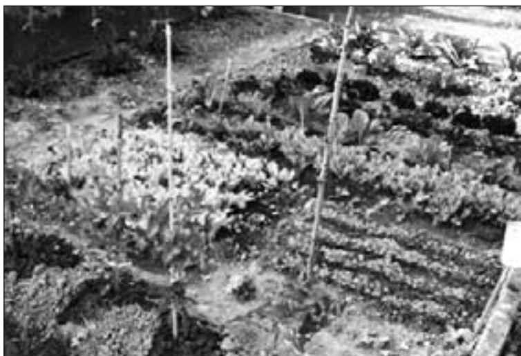
Huertos que se pondrán en marcha en Livorno.

En declaraciones recogidas por medios locales y el diario