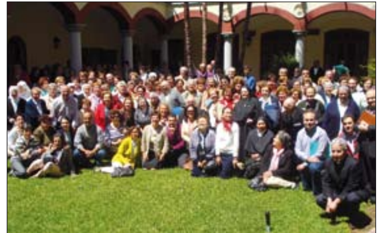
Participantes en los cursillos de formación.

La asistencia fue numerosa: alrededor de 300 personas, la mayoría ministros ya instituidos, y otros, futuros candidatos al ministerio extraordinario. La mayoría eran