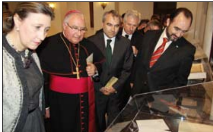
Inauguración de la exposición del 350 aniversario del Seminario.

Una celebración importante fue la conmemoración del 1.750 aniversario de la presencia cristiana en Mérida y el 750 de la creación de la diócesis de Badajoz. Los actos conmemorativos se abrieron en la Catedral el 22 de octubre de 2005. En el programa de actividades destacaban asuntos como conferencias, peregrinaciones a la Catedral o la elaboración de un Misal propio de la diócesis.