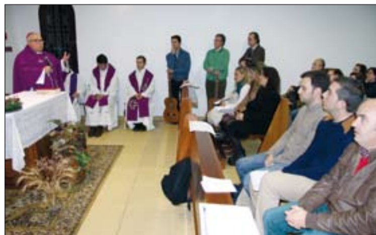
Celebración con los alumnos del Instituto Superior de CRR.

La actividad formativo-cultural ha sido otra de las características del pontificado de don Santiago. Entre las muchas que ha promovido, destacamos el Congreso sobre la Eucaristía en 2006, el Congreso de la Asociación de Archiveros de la Iglesia en España en 2007, las I Jornadas Hispano-Lusas de Pastoral Penitenciaria en 2008, el Congreso sobre la Familia el mismo año o la Jornada que se celebró en 2010 sobre el Sacerdocio.