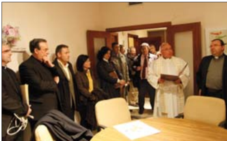
Bendición de las instalaciones del Centro de Orientación Familiar.

Uno de los frutos de la acción caritativo-social la vemos en el comedor social Beato Cristóbal de Santa Catalina, que se inauguraba en Mérida el 19 de diciembre de 2013 y que da de comer a miles de personas con escasos recursos económicos. Es sostenido por las parroquias de Mérida y gestionado por las religiosas Hospitalarias de Jesús Nazareno, que se encargan también del centro Padre Cristóbal, de acogida a personas sin hogar.