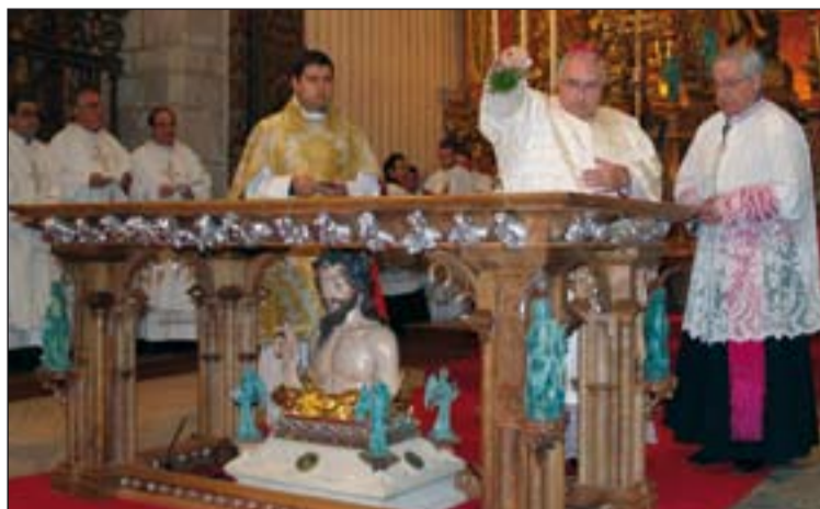
Consagración del nuevo altar de la Catedral de Badajoz.