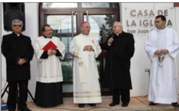
El Nuncio de la Santa Sede en España bendijo la nueva Casa de la Iglesia.

El COF presta una atención integral a la persona y a los problemas familiares en todas sus dimensiones, trabaja en la mejora de la comunicación con las personas del entorno familiar, en la gestión de sus conflictos y en la superación de desencuentros.