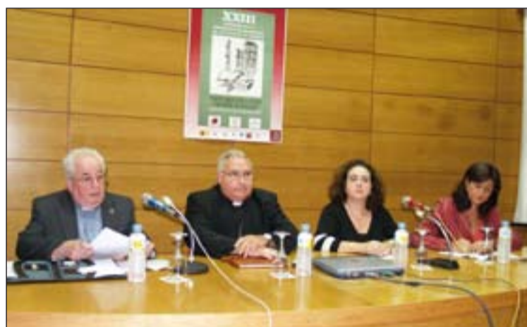
Congreso de la Asociación de Archiveros de la Iglesia en España.

A ello debemos sumar también el arreglo de aulas del colegio diocesano San Atón.