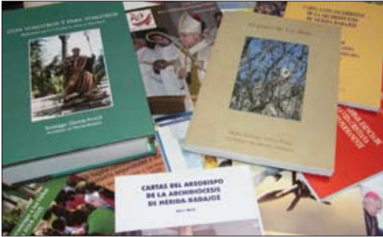
Algunos de los números escritos que ha realizado D. Santiago.