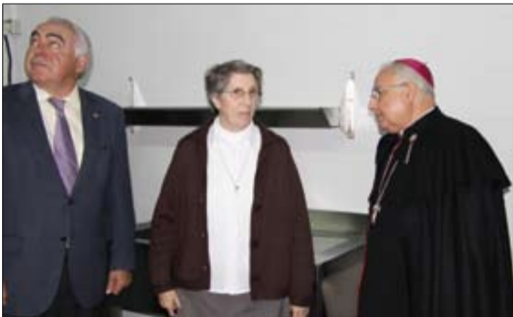
Inauguración del Comedor social "Padre Cristóbal"

En sintonía con lo anterior, el 17 de marzo de 2013 se celebraba la I Jornada Diocesana de la Juventud, en la que participan más de un millar de Jóvenes. Esa primera edición se desarrolló en la localidad de Ribera del Fresno. Las dos sucesivas han sido en Fuente del Maestre y en Almendralejo.