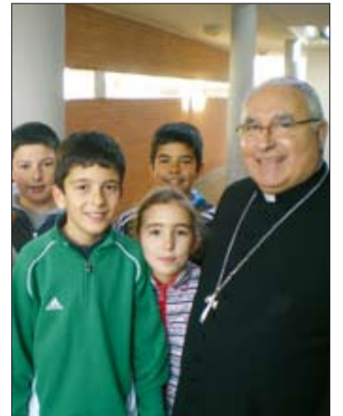
D. Santiago con niños durante su Visita pastoral a Alburquerque.

Y así, burla burlando, el pasado mes de mayo del año 2014 empezó a rumorearse que Don Santiago había pedido a la Santa Sede los servicios de un Obispo que le ayudara al final de su pontificado y para que la transición hacia el siguiente, cuando cumpliera los 75 años se realizara sin dilación ni sobresaltos.