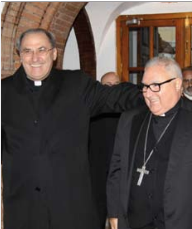
D. Celso y D. Santiago el día de la llegada del, en ese momento, Arzobispo coadjutor.

Recuerdo que fue un encuentro muy agradable, que me ayudó mucho en aquellos momentos a superar temores y aprensiones. Después, la convivencia del día a día, durante estos meses, ha continuado en