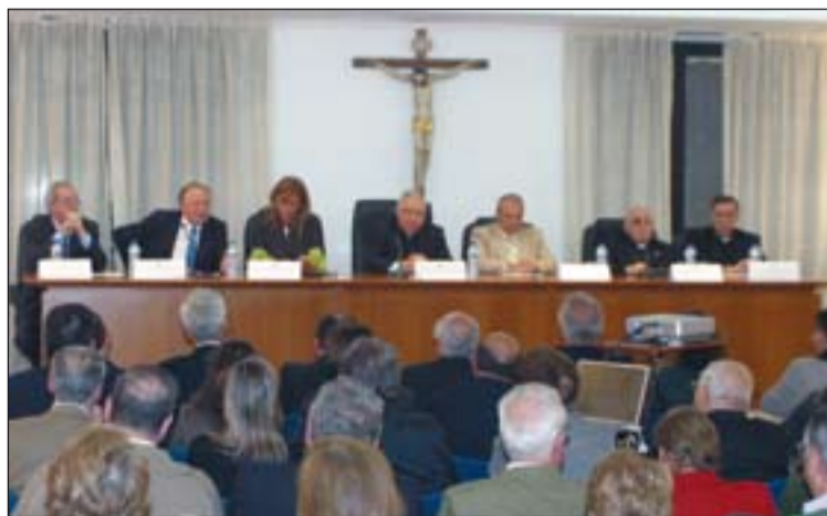
Presentación del libro sobre la Catedral de Badajoz.

Según declaraciones realizadas por él mismo el día en que se hizo público que la Santa Sede admitía su renuncia por edad, lo que más feliz lo ha hecho durante estos años fue la ordenación de esos 22 jóvenes.