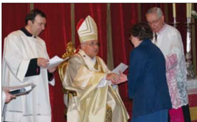
Entrega de diplomas a los Ministros Extraordinarios en 2007.

Una de las obras que perdurarán muchos años es la Casa de la Iglesia "San Juan de Ribera", que ocupa las instalaciones de lo que fuera el Seminario Mayor. En ella se encuentran las Delegaciones Episcopales (antes en el Arzobispado), Cáritas, y el Instituto Superior de Ciencias Religiosas "Santa María de Guadalupe". El edificio consta de tres plantas que acogen además las clases del Seminario mayor, la sede de CONFER y Acción Católica.