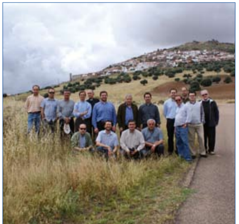
Algunos de los sacerdotes que participaron en el encuentro.

Toda la comunidad cristiana de La Santa Cruz ha valorado muy positivamente esta iniciativa, lo que se ha demostrado claramente con lo que se ha conseguido.