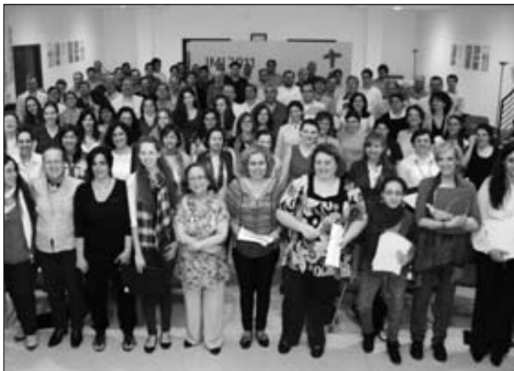
Coro de la JMJ 2011.

El miércoles 1 de junio la Orquesta Sinfónica y Coro de la JMJ Madrid 2011, bajo la dirección de Borja Quintas, se presenta oficialmente en un concierto en el Auditorio Nacional de Madrid. Esta agrupación será la encargada de tocar en los Actos Centrales de la Jornada Mundial de