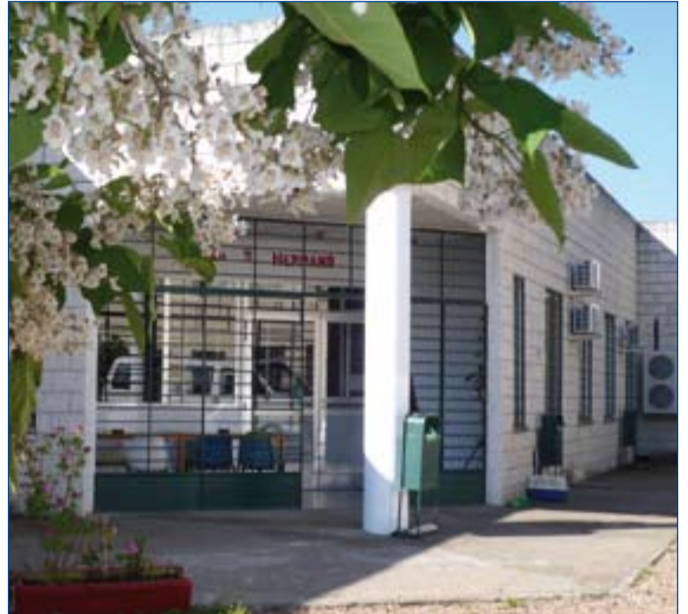
Centro Hermano, en Badajoz.

El Centro ha tenido que ir adaptándose a una realidad que cambia constantemente,