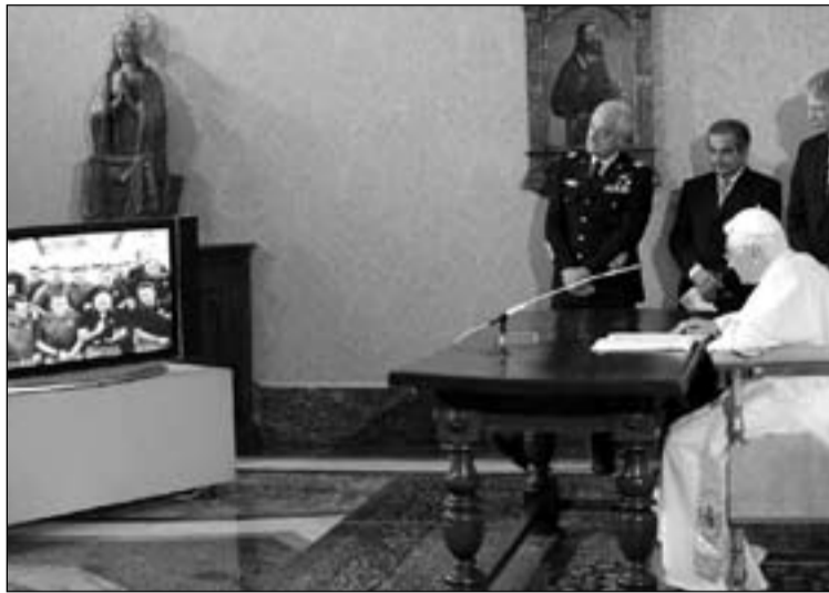
Encuentro de Benedicto XVI con astronautas de la E.E.I.

En su primera pregunta a los astronautas, Benedicto XVI les dijo: "Cuando contempláis la tierra desde arriba, ¿os habéis preguntado cómo viven aquí abajo las naciones y las