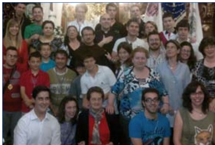
Participantes en este encuentro preparatorio.