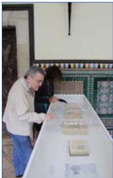
Aspecto de la exposición.

La exposición consta de cuatro secciones. La primera aparece bajo el título "Fascinado por la Palabra"; la segunda se titula "El Teólogo"; la tercera, "El Pastor" y la cuarta, "El Humanista".