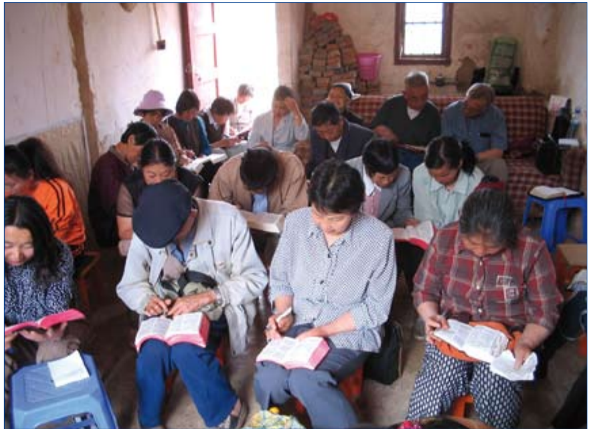
Cristianos chinos leen la Biblia en un país donde el gobierno ejerce un férreo control sobre la Iglesia católica.

Durante el último año, señalaba el informe, la situación de la libertad religiosa se ha deteriorado aún más, sobre todo para las minorías religiosas de wahabitas, cristianos y musulmanes sufíes. Los judíos tam-