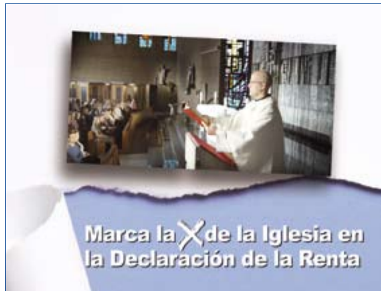
Campaña "Por Tantos" 2011