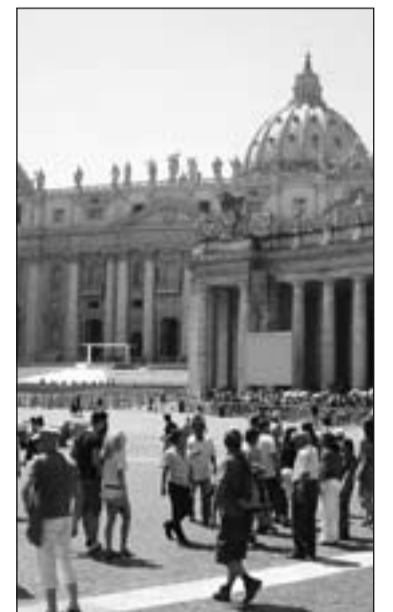
Plaza de San Pedro.