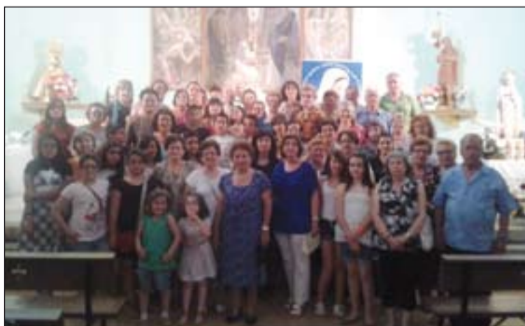
Asistentes a la misa retransmitida por Radio María.

Tras la comida de fraternidad se celebró la Santa Misa y se despidieron de la Virgen, dándole gracias por el día transcurrido.