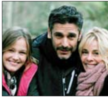
Luna, el misterio de Calenda.

Por todo ello es normal que las productoras y cadenas apuesten por este formato. Lo que resulta más sorprendente es que, en algunas ocasiones o no les dediquen los suficientes recursos (y no tengan unos mínimos de calidad) o, después de haber hecho la inversión correspondiente, no les den suficiente tiempo para ver si son bien acogidas por el público y las retiren de la parrilla de forma precipitada. Esta circuns-