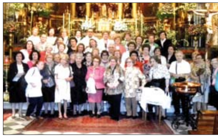
Damas Solidarias que visitaron el monasterio.