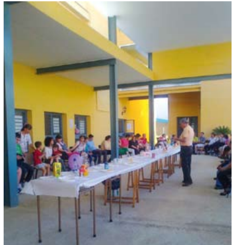
Familias que participaron en la merienda festiva.

La parroquia tiene como objetivo acoger todas las realidades, y acompañarlas en sus necesidades materiales y espirituales. Así por ejemplo un grupo de madres de niños autistas están ejerciendo de catequistas para sus propios hijos y compañeros en orden a que puedan celebrar y reci-