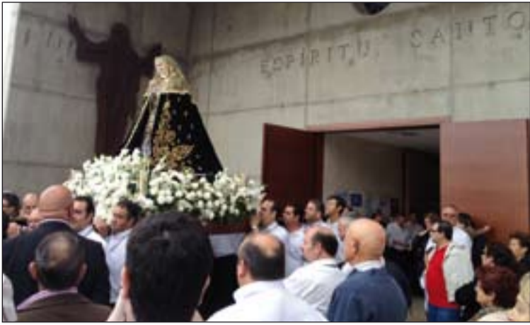
La Virgen de la Soledad, entrando en la parroquia del Espíritu Santo.

Virgen de la Soledad.- Enmarcados dentro de los actos programados para preparar la coronación canónica de la Virgen de la Soledad, el pasado fin de semana la patrona de Badajoz visitó la parroquia de San Roque, en Badajoz, donde centenares de fieles participaron en las diversas celebraciones que tuvieron lugar durante esos días en el templo.