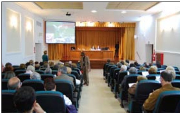
Mesa redonda en la que se compartieron experiencias.

Tras la comida se contó con la participación del coro del