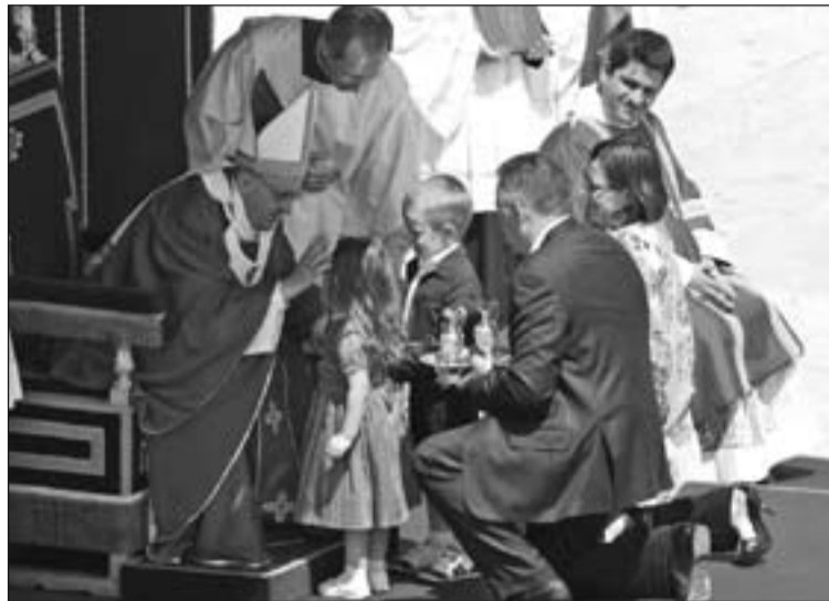
Ofrendas durante la Eucaristía en la Solemnidad de Pentecostés.

El Papa indicó que "la novedad nos da siempre un poco de miedo, porque nos sentimos más seguros si tenemos todo bajo control, si somos nosotros los que construimos, programamos, planificamos nuestra vida, según nuestros esquemas, seguridades, gustos". Esto, advirtió Francisco, "nos sucede también con Dios", que añadió: "con frecuencia lo seguimos, lo aco-