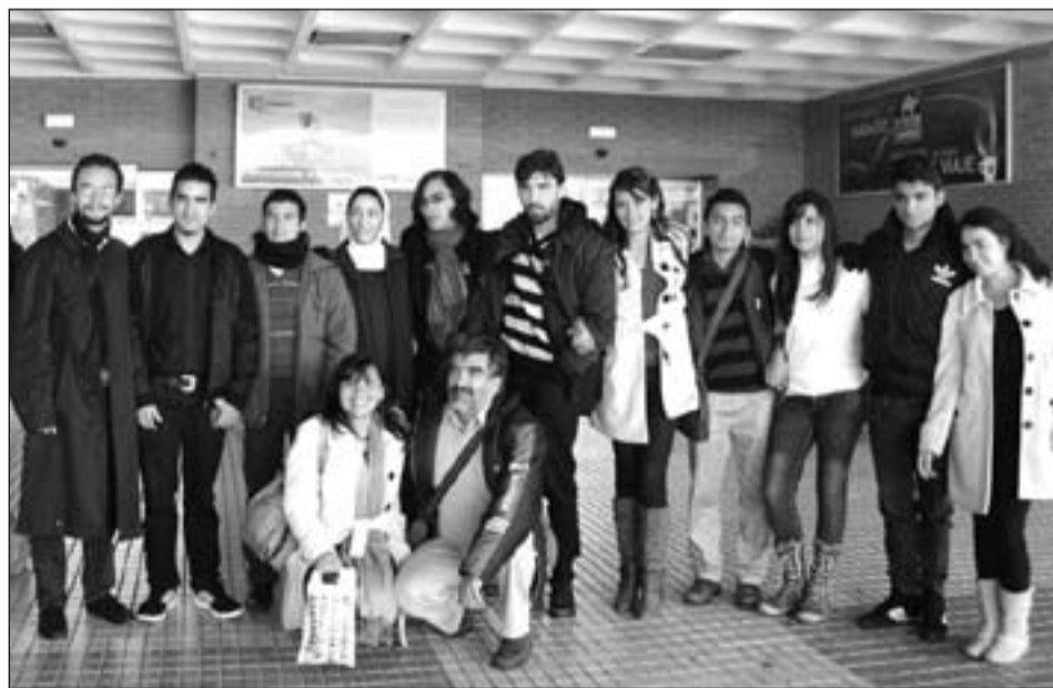
Zamayalinda ha recibido alguna vez la visita de su familia en Badajoz.

> La vida en comunidad siempre te exige renunciaciones, desde un detalle a una cosa grande. En el fondo creo que es lo que a uno lo madura en la fe, lo forma, lo hace conocer a Dios, te hace ver que está pidiendo Dios en el momento presente. Es fundamental, nos lleva a conocernos a nosotros mismos y a Dios.