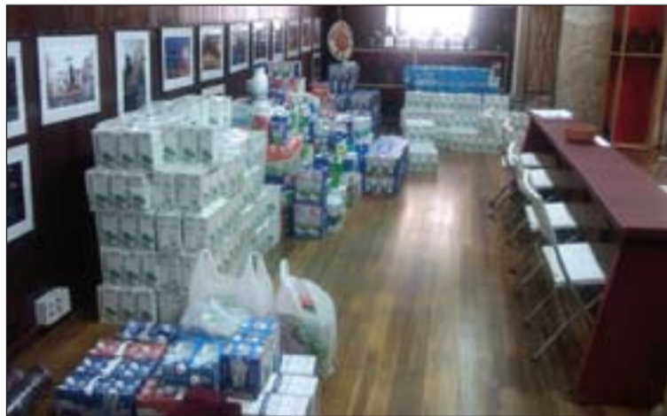
Leche recogida en la campaña de las cofradías de Mérida.

Es objetivo de la Junta de Cofradías es continuar realizan-