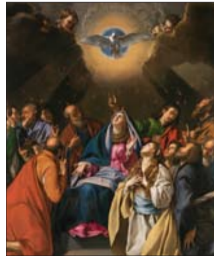
Pentecostés. Juan Bautista Maíno (1615-1620). Museo del Prado.

-«Recibid el Espíritu Santo; a quienes les perdonéis los pecados, les quedan perdonados; a quienes se los retengáis, les quedan retenidas».