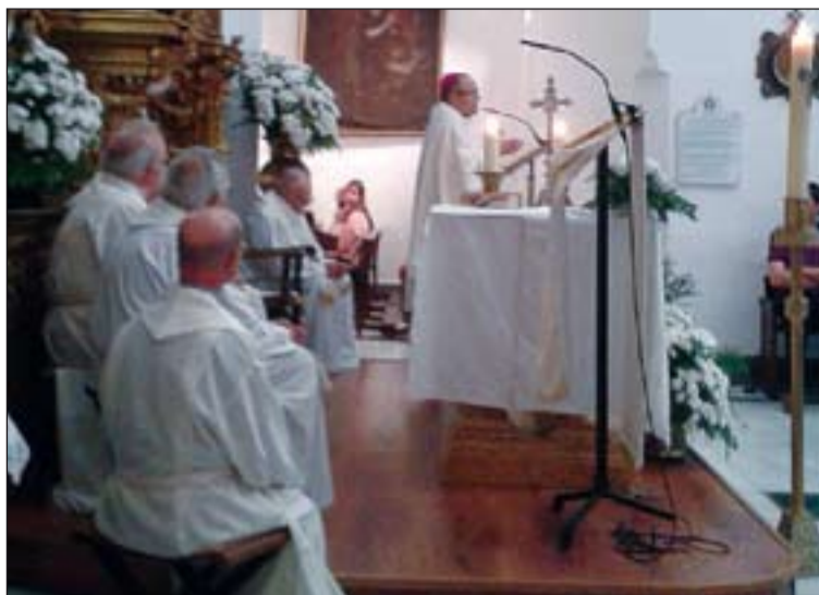
Mons. Francisco Cerro Chaves presidió la Eucaristía.

señor Francisco Cerro, obispo de Coria-Cáceres, acompañado de siete sacerdotes diocesanos que concelebraron, y de todos los participantes en el encuentro, celebró la Eucaristía en presencia de la Virgen de la Montaña. La homilía versó sobre las tres notas características que han de configurar al agente de pastoral de la salud. Cada agente ha de ser un adulto en la fe, por su formación y su experiencia en la relación con Jesucristo.