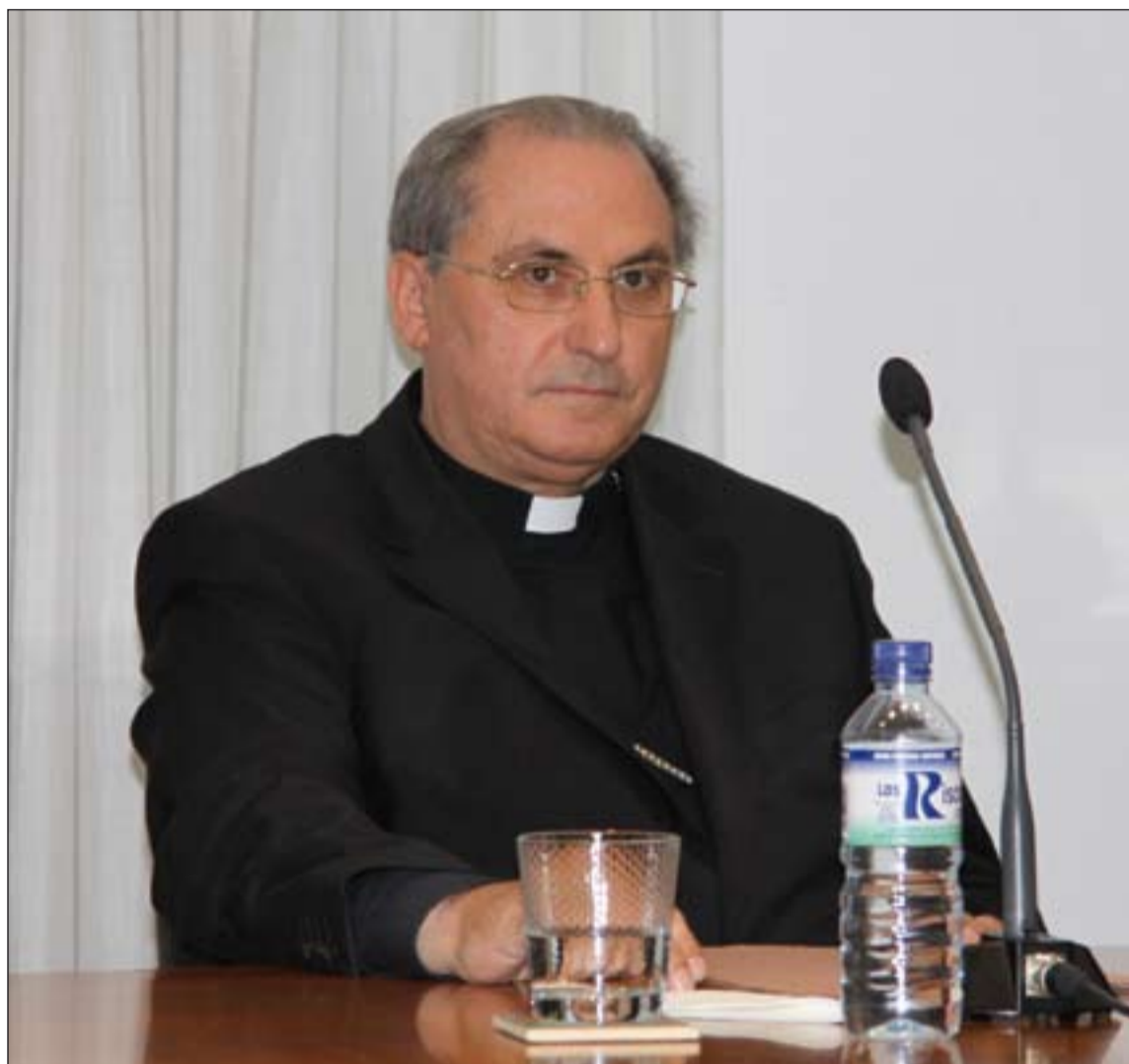
Monseñor Celso Morga Iruzubieta, nuevo Arzobispo de Mérida-Badajoz.

El nuevo Arzobispo de Mérida-Badajoz dijo que “es el Espíritu Santo quien está pidiendo a toda la Iglesia esta nueva evangelización, con estas características de caridad