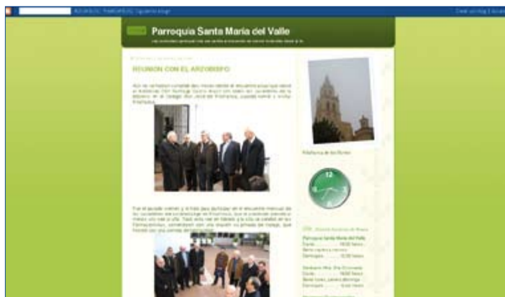
Algunas parroquias de nuestra Diócesis ya usan el blogs como medio de información.

El alma de la iniciativa es el propio Papa Benedicto XVI que desde los inicios de su papado ha mostrado interés