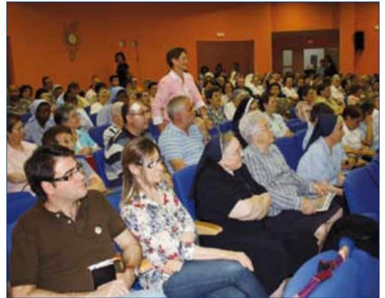
Religiosos y religiosas que participaron en este encuentro.

Desde CONFER Extremadura agradecen al Cardenal Car-