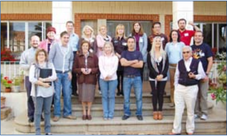
Cursillo de Cristiandad n° 242, dirigido a nuevos cursillistas.