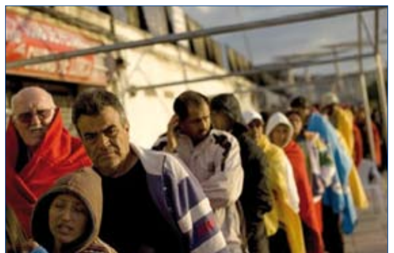
Miles de personas se vieron obligadas a abandonar su hogar.