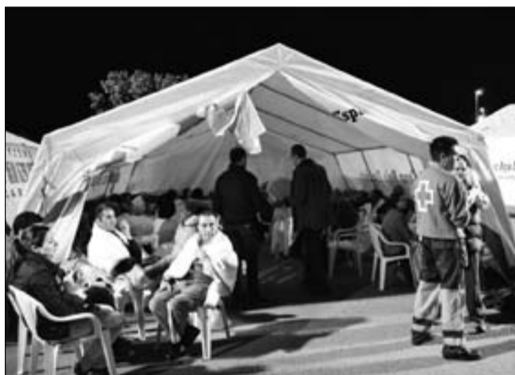
Arriba, templo destruido por el terremoto. Abajo, los damnificados.

la solidaridad ciudadana con los afectados.