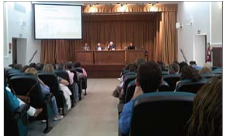
Encuentro de profesores de Religión.

También se aprovechó este encuentro para presentar a los profesores el material y las unidades didácticas preparados con motivo del 50 aniversario de Cáritas diocesana de Mérida-Badajoz, para que se trabaje en las aulas, dando a conocer esta institución de la Iglesia a todos los niños y adolescentes de la Diócesis.