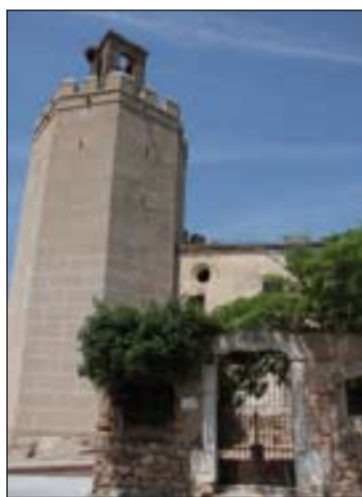
El marco de una de las puertas que da acceso a los Jardines de la Galera, en Badajoz, pertenecía a la puerta del antiguo seminario.

Desde ese momento, el Seminario imparte la docencia