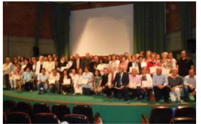
Los alumnos tras la entrega de diplomas, junto al Arzobispo.

cada sede ofreció su testimonio. Los coordinadores comentaron cómo había transcurrido el periodo de formación en la sede a lo largo de los 3 cursos y también se refirieron a la parte práctica, algo que ofreció una amplia visión sobre el trabajo pastoral de la Iglesia y en concreto de la Iglesia Diocesana.