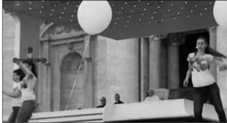
Momento del encuentro con los escolares italianos.

Añadió que la escuela tienen que ser "apertura hacia la realidad en la riqueza de sus aspectos y dimensiones". Y que es necesario siempre "aprender a aprender". Además dijo "la escuela no es un estaciona-