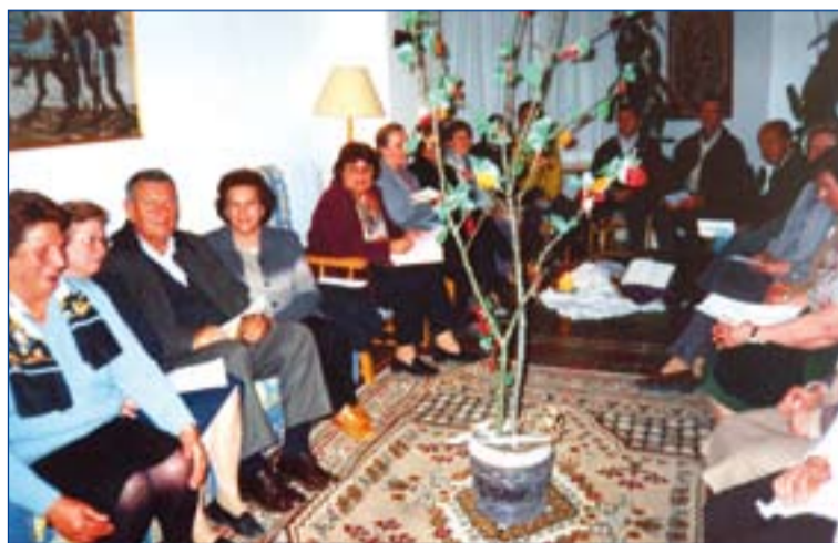
Reunión de laicos del Buen Pastor.

Estas religiosas se han caracterizado a lo largo de este tiempo por su capacidad de acogida a todo tipo de personas necesitadas. A su casa de la calle de San Juan, cerca ya de la Plaza Alta donde conti-