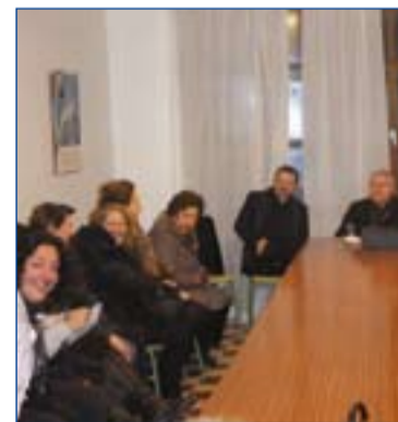
Arzobispo con laicos en la Visita.