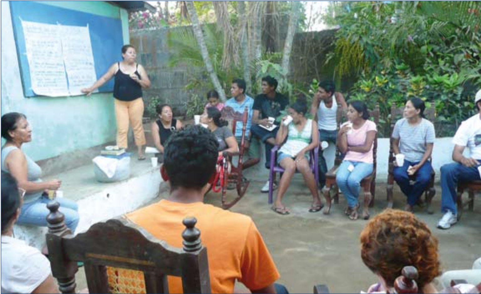
Proyecto desarrollado en Nicaragua para formar académicamente a 40 jóvenes. Se ha ayudado con 11.250 euros.

■ El Fondo Diocesano de Solidaridad surgió del Sínodo Diocesano como muestra de la solidaridad de la Iglesia de Mérida-Badajoz.