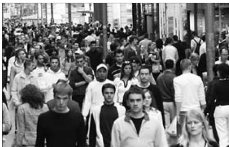
La primera vocación es la laical.

Este domingo se celebra la 48 Jornada Mundial de Oración por las Vocaciones en la que, en línea con el mensaje papal, se ha puesto el acento en el compromiso que deben asumir las iglesias locales para fomentar las diferentes vocaciones en la Iglesia. Unas vocaciones que no se reducen al sacerdocio o la vida religiosa, sino que parten desde la misma vocación a "ser cristiano" que tiene su "primera parada" en la vocación laical.