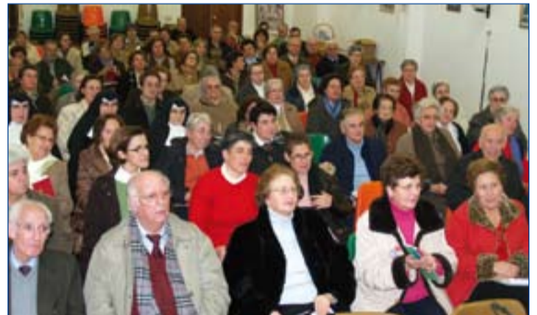
Participantes en el cursillo de preparación celebrado en el año 2008.

Los cursillos, en los que deben participar obligatoriamente tanto los que en su día fueron instituidos como aquellos que quieren serlo a partir de ahora, se celebrarán en dos lugares y días diferentes para