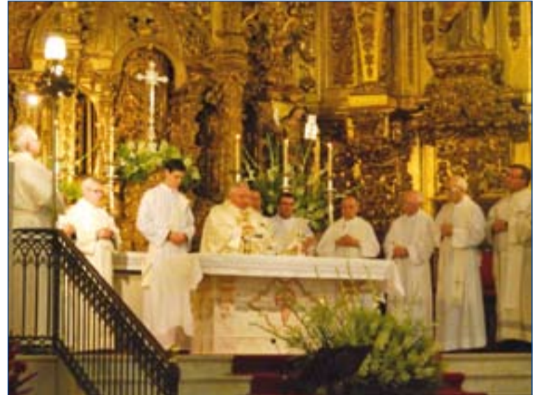
Eucaristía presidida por el Arzobispo y concelebrada por varios presbíteros.

A continuación, se impusieron las insignias a los nuevos adoradores de la Sección y a los veteranos. Tras la oración por las vocaciones, comenzaron los turnos de vela ante el Santísimo, que se prolongaron hasta las 3 de la madrugada. A esa hora el templo se volvió a llenar para rezar el Santo Rosario y Laudes y, a continuación, se inició la procesión