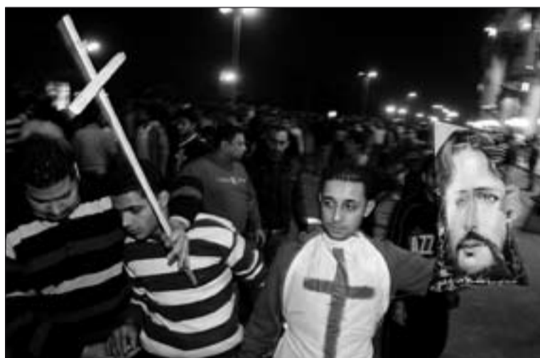
Manifestación de cristianos coptos pidiendo justicia.

La pregunta por el cómo actuar de la Iglesia local en lo que se refiere a su compromiso vocacional, la responde el Papa dando la prioridad a Jesús, a quien Benedicto XVI presenta con un perfil vocacional concreto y ejemplarizante a través de unos verbos, fáciles de entender y recordar: llamó a algunos, les mostró su misión mesiánica, los educó con la palabra y con la vida, les confió el memorial de su muerte y resurrección y los envió a todo al mundo con un mandato claro. Asumidos estos puntos fundamentales, el Papa urge para que toda Iglesia local se haga cada vez más sensible a la pastoral vocacional, incluso como exigencia constitutiva, educando en los diversos niveles: familiar, parroquial y asociativo. Y esto sin olvidar las dificultades que conlleva, especialmente en el contexto actual, en el que se sufre una parálisis de la voluntad y de la fidelidad.