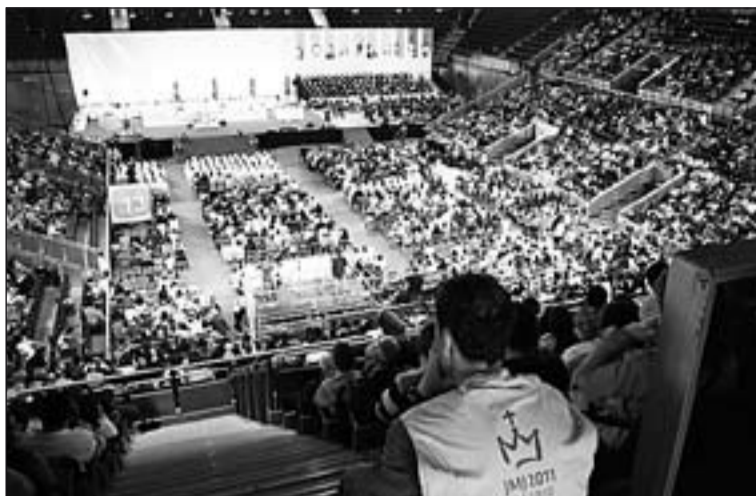
El "Madrid Arena" acogió el encuentro.

A las 12 horas comenzó la misa presidida por el cardenal arzobispo de Madrid Antonio María Rouco. En su mensaje