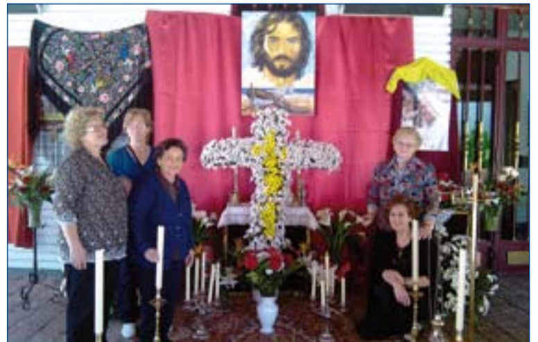
Cruz colocada en la parroquia de San Fernando y Santa Isabel, Badajoz.