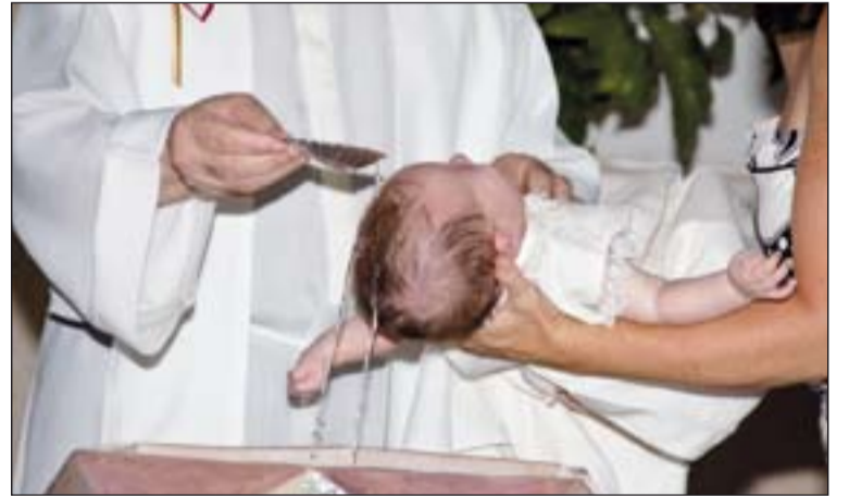
El Bautismo es uno de los sacramentos de la Iniciación Cristiana.

El Directorio para la Iniciación cristiana consta de dos partes, la primera aborda lo referente a la Iniciación cristiana de los niños, en la que, antes de señalarse lo referente a cada uno de los sacramentos, se describen las etapas, a quién compete la responsabilidad, la formación de quienes la deben ejecutar, los materiales que han de servir de instrumentos y la propia celebración. Se pasa, posteriormente, al sacramento del Bautismo, la Confirmación y la Eucaristía en que se describe teológica y pastoralmente el sentido de cada sacramento y se indican las orientaciones necesarias para que se pueda realizar con una preparación adecuada todo ello. En la segunda parte se hace referencia a todo lo propio