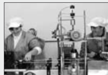
Trabajadoras en Cortijo Covaroca.

Aunque la principal actividad comercial que lleva a cabo el Programa de Comercio Justo de la Diócesis es con cooperativas de países del Sur, desde hace un par de años además se trabaja con cooperativas de nuestro país, vendiendo sus productos.