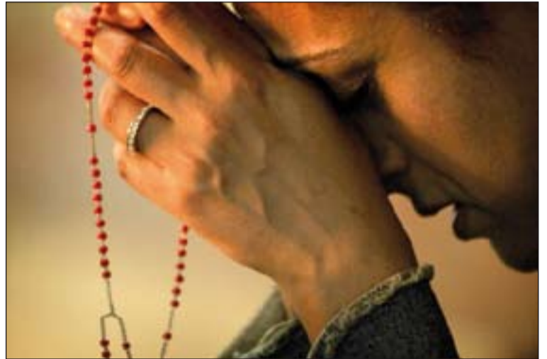
El rezo del Rosario es una de las propuestas de la Iglesia para este mes.

Además tenemos muchas oraciones. Hay una oración que está rezada por una comunidad en medio de las persecuciones. Es aquella de "Bajo tu