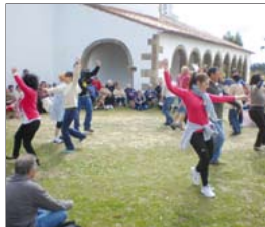
Los militantes de nuestra diócesis bailaron la jota del Palancar.