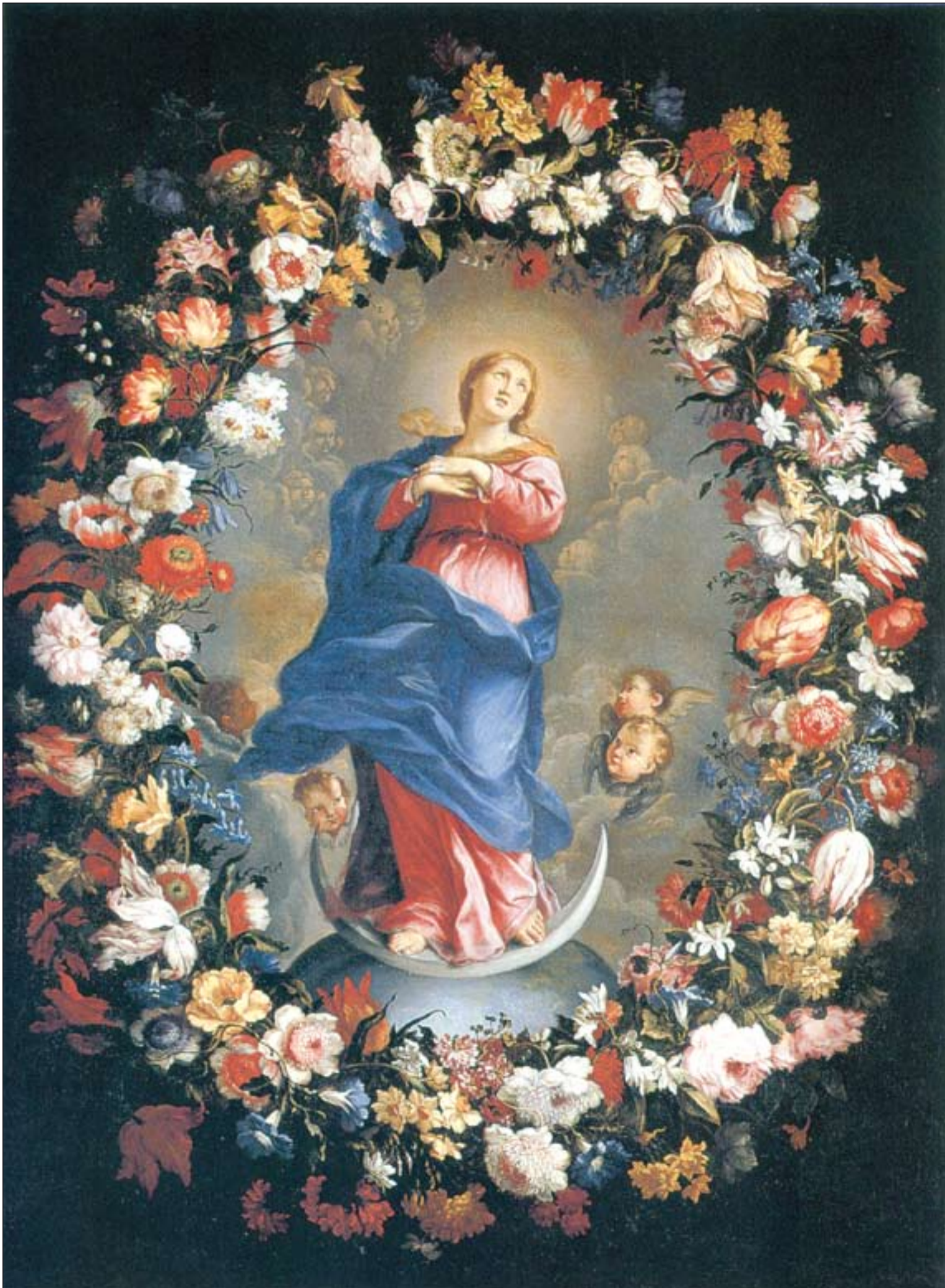
Inmaculada orlada de flores. Atribuido a Juan de Arellano (1614-1676). Museo catedralicio de Badajoz.