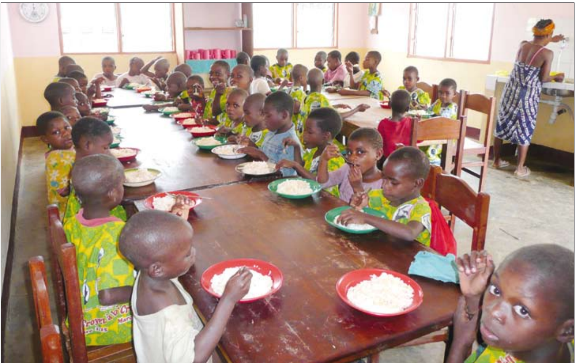
Comedor del hogar para niñas pigmeas de la misión de Ngovayan, en Camerún. El FDS le ha ayudado con 9.929 euros para comprar un generador eléctrico que surta de agua y luz.