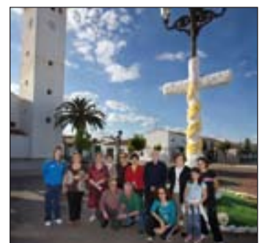
Izda., Almendralejo; dcha., Santo Domingo; abajo, Pueblonuevo.

y Tambores "La Pasión" en la que participó todo el barrio.