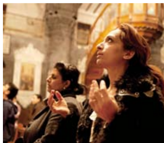
Mujer cristiana rezando en la catedral greco-católica melquita de Damasco.

Una serie de actuaciones con canciones y un voluntariado de artistas improvisados amenizaron una estupenda sobremesa.