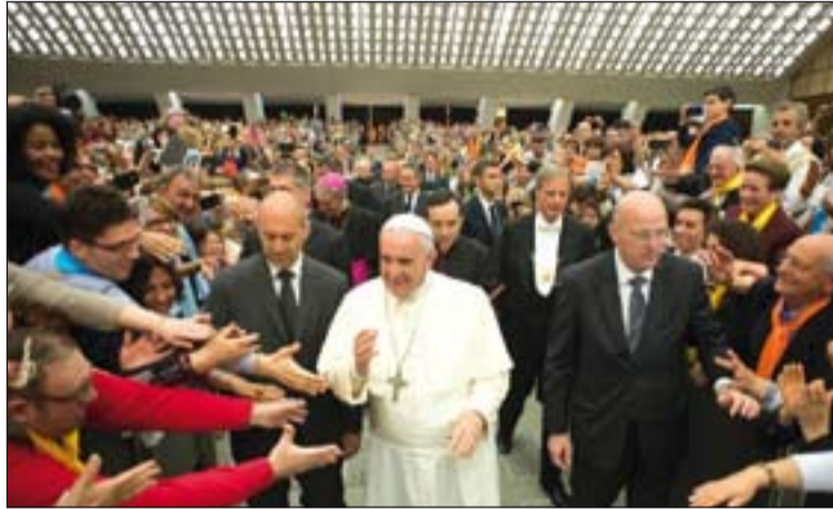
El Papa saluda a los asistentes a su llegada al Aula Pablo VI.

cursillistas que "el Señor quiere encontrarnos, habitar con nosotros, ser nuestro amigo y hermano, nuestro maestro que nos revela el camino a seguir para llegar a la felicidad. Él no pide nada a cambio, pide sólo recibirlo, porque el amor de Dios es gratuidad, puro don. El encuentro con Cristo y con la misericordia del Padre que Él nos dona, es posible sobre todo en los sacramentos".