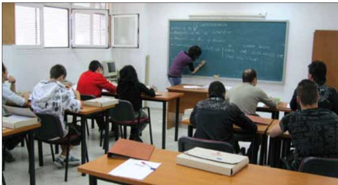
Formación impartida en el Centro de Empleo de Badajoz de Cáritas Diocesana.

Estos datos confirman que es posible seguir creando empleo digno para las personas en situación de grave dificultad social, y de que la apuesta de Cáritas por construir oportunidades para todos ellos puede alcanzarse en un escenario que sigue mostrando los efectos de un periodo de crisis que nos ha