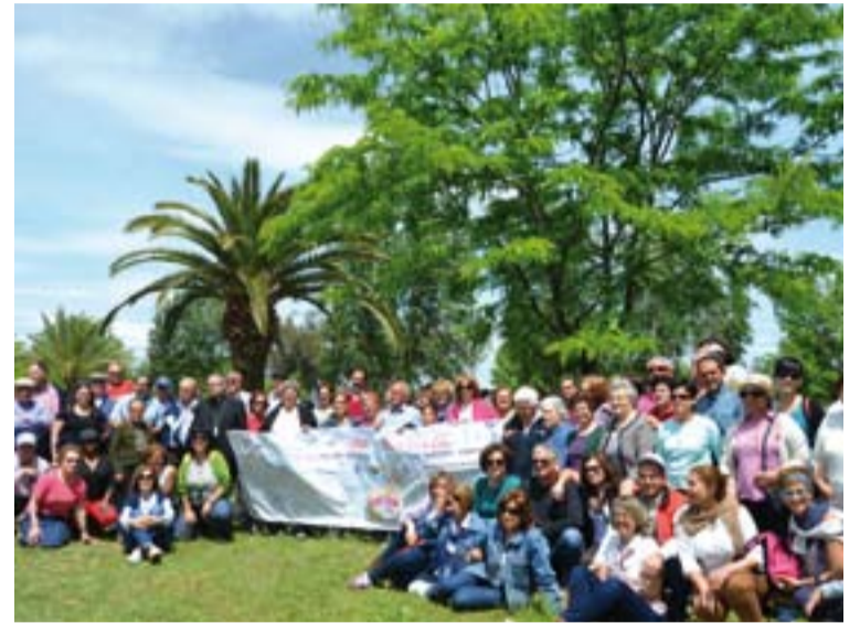
Participantes en el encuentro, junto a Mons. Francisco Cerro Chaves.

A modo de "referentes" que, con estilo sencillo, lejos del protagonismo vanidoso, en procesos de día a día van haciendo posible que los pueblos sean