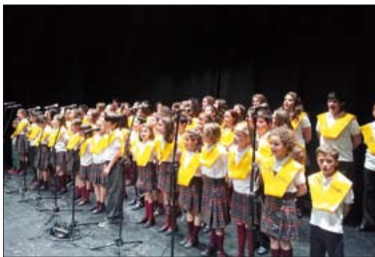
Actuación del Coro del Colegio "Sagrado Corazón" de Olivenza.