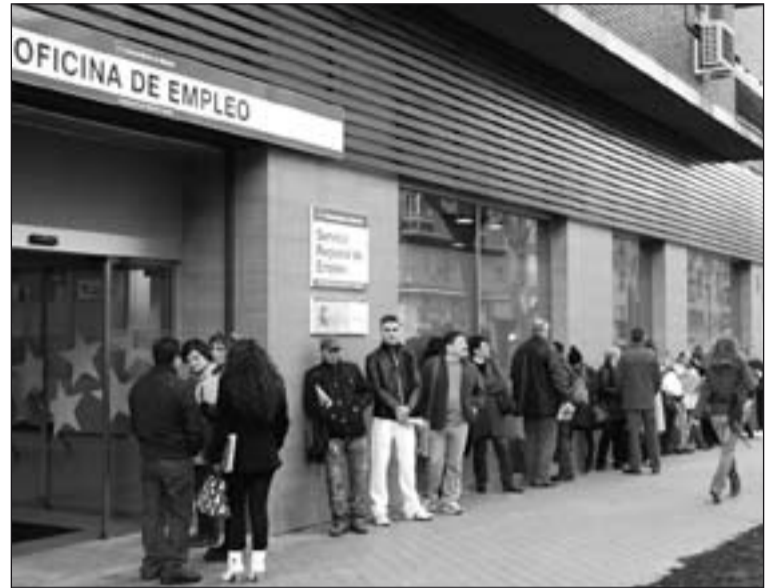
Cola de personas ante una Oficina de Empleo en Madrid.