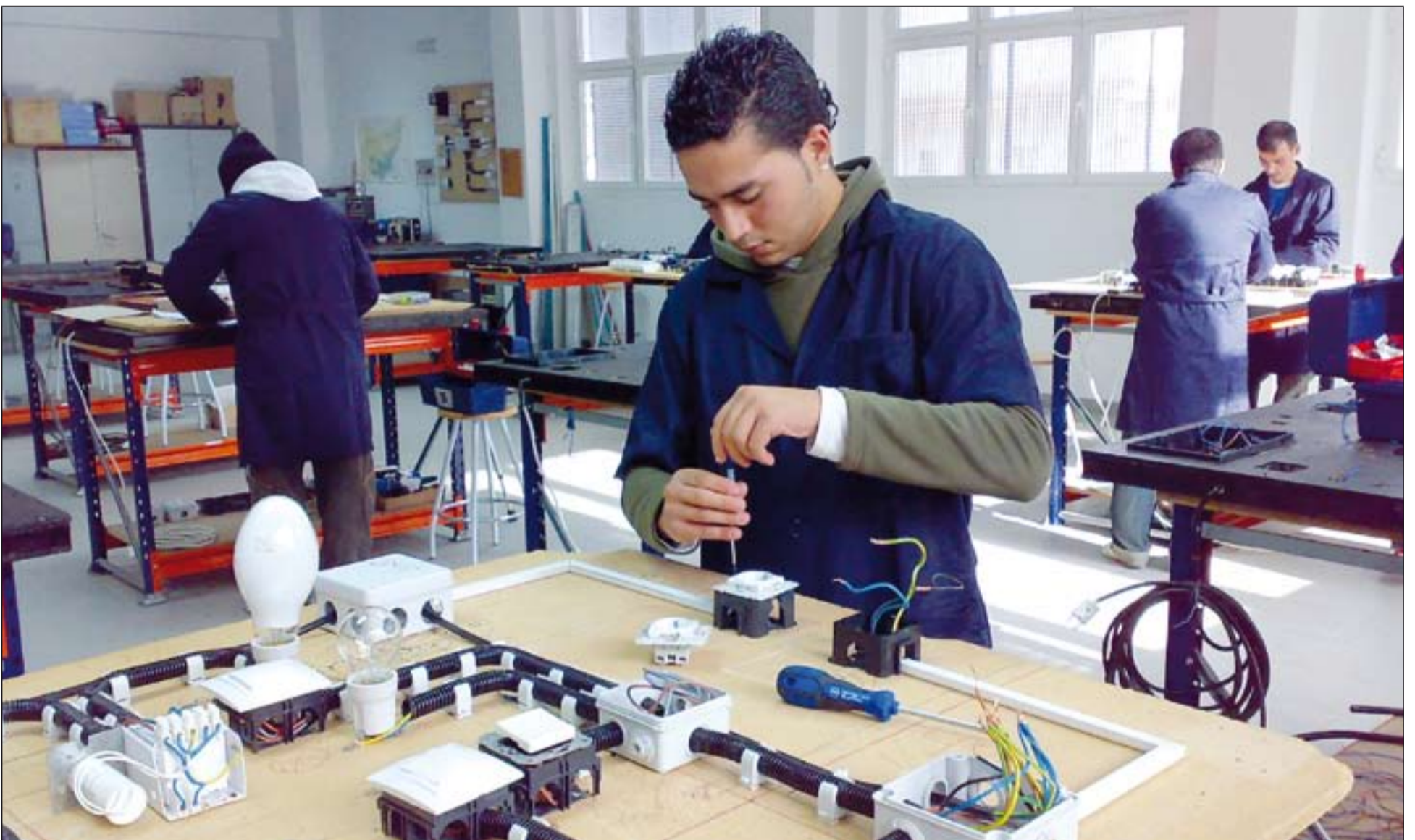
Taller de Electricidad que se desarrolla en el Centro de Empleo de Cáritas Diocesana en Badajoz