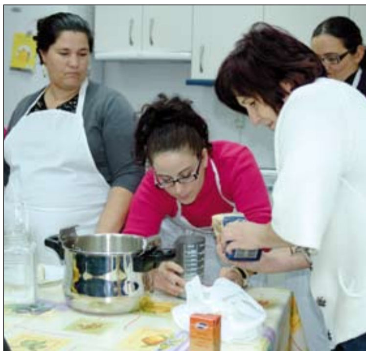
Taller de empleada de hogar en el Centro de Empleo en Badajoz.

El apoyo al autoempleo es también un objetivo prioritario, del que se han beneficiado 96 personas a través de 37 iniciativas el pasado año.