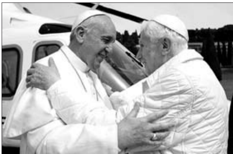
Benedicto XVI y Francisco en el encuentro en Castelgandolfo.

La actividad del Papa Francisco no se detiene. Se habla de su primera Encíclica y se prepara su viaje a la JMJ de este verano en Brasil. Mientras, Benedicto XVI prepara su traslado al Monasterio Mater Ecclesiae del Vaticano.