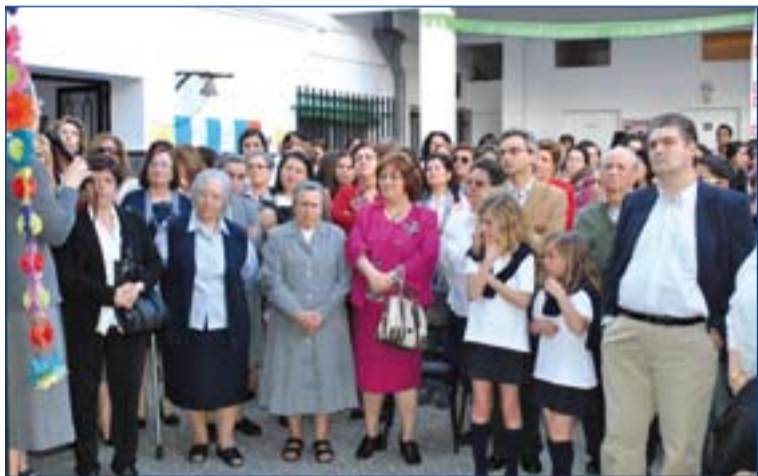
Homenaje a las Hermanas Apostólicas de Cristo Crucificado.

Antes de compartir una cena en homenaje a estas religiosas, los participantes en este acto celebraron la Eucaristía.