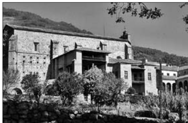
Real Monasterio de Yuste.