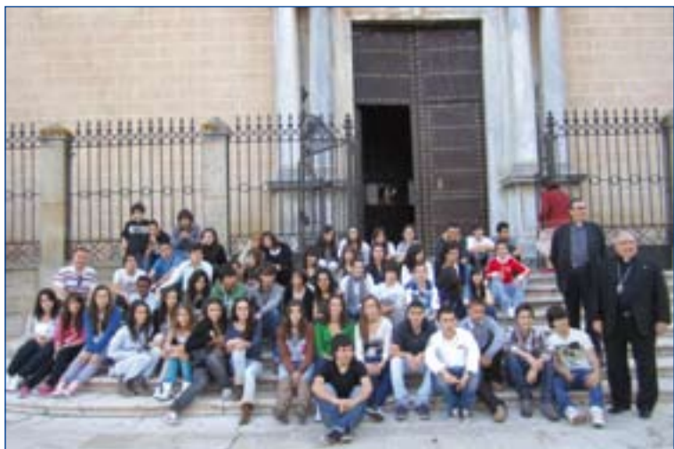
Alumnos con el Arzobispo y el Vicario General antes de partir.

En Santiago de Compostela, visitaron la Basílica y asistieron a la Misa del Peregrino.