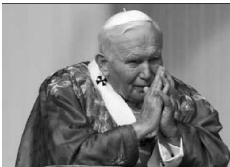
Juan Pablo II.

Al día siguiente habrá una misa de acción de gracias en la Plaza de San Pedro, que comenzará a las 10.30 horas presidida por el Cardenal Tarcisio Bertone, Secretario de Estado.