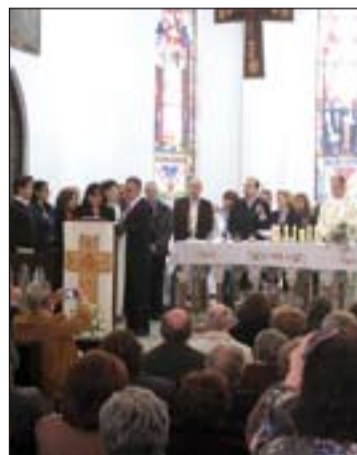
Celebración de la Eucaristía.