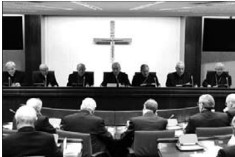
Asamblea Plenaria de la CEE.

En su intervención, al referirse al Plan Pastoral, Monseñor Rouco Varela habló de la situación general de la sociedad española, de la que dijo que "si no se sigue el camino que hace posible la caridad no será posible una buena solución de la crisis. Sin la caridad, es decir, sin la generosidad sincera, movida en último término por el amor de Dios y del prójimo, será imposible introducir los cambios necesarios en el estilo de vida y en las costumbres so-