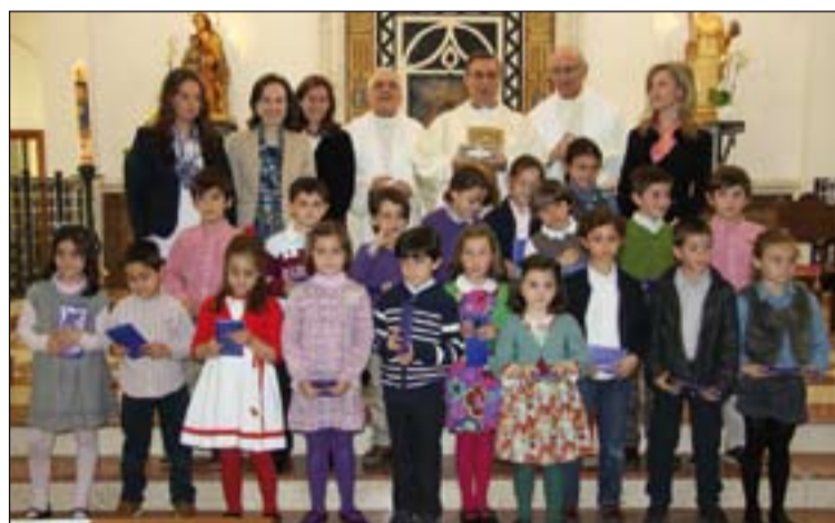
Foto de familia tras la entrega de la baldosa.