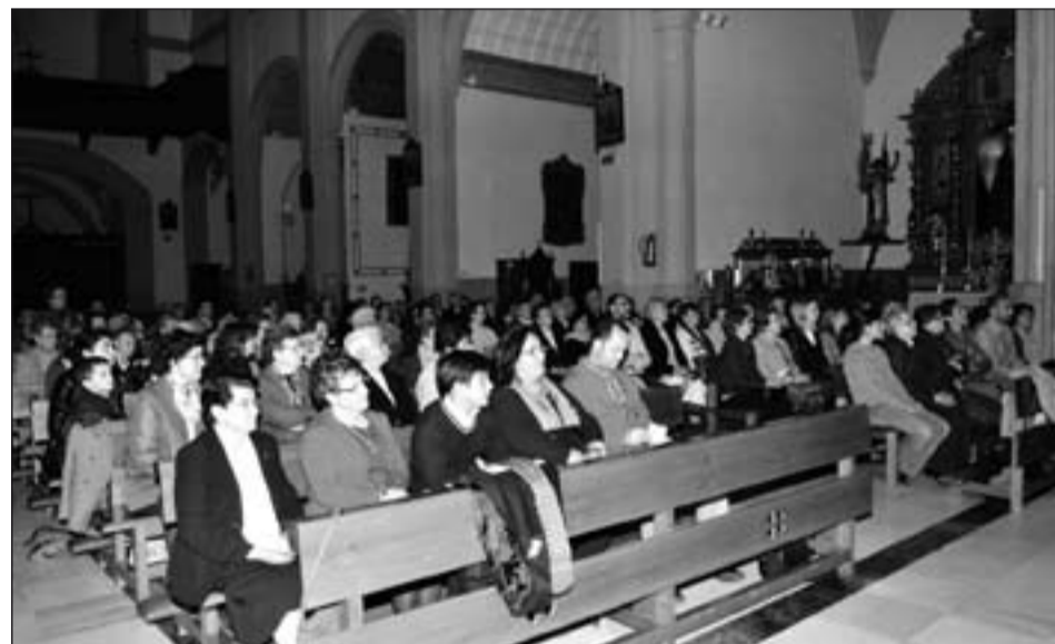
Asistentes a la Eucaristía con la que comenzó este año jubilar.

En el año 1991 llegaron a nuestra diócesis, donde se dedican a cumplir con su carisma de oración y ministerio de la Palabra mediante ejercicios espirituales y convivencias, fundamentalmente.