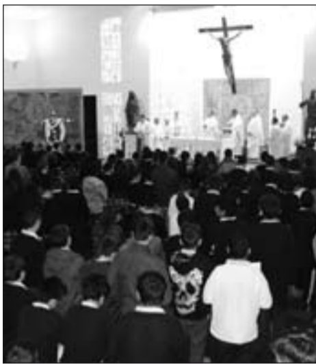
Eucaristía conmemorativa del 50 aniversario.