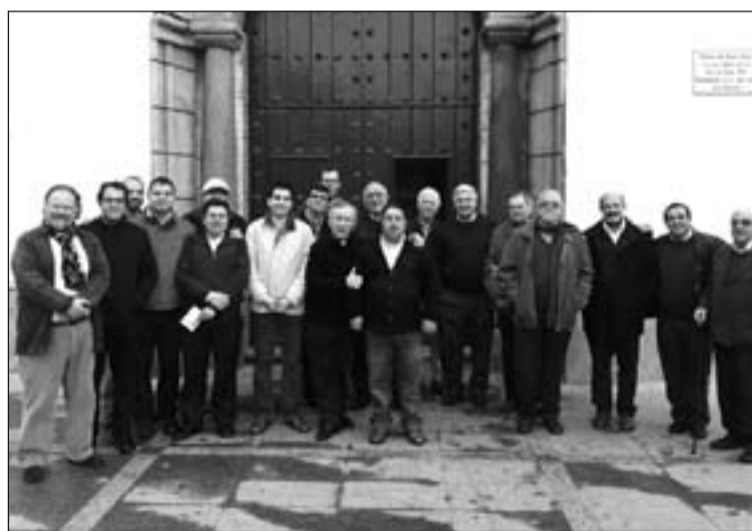
Sacerdotes que participaron en la convivencia.

Después, guiados por el párroco del lugar visitaron dis-