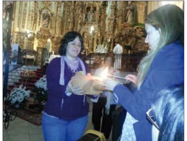
Un momento de la Vigilia de Oración que se celebró en el Encuentro.

La comunidad parroquial de Fuente del Maestre y su párroco se volcaron con el encuentro.