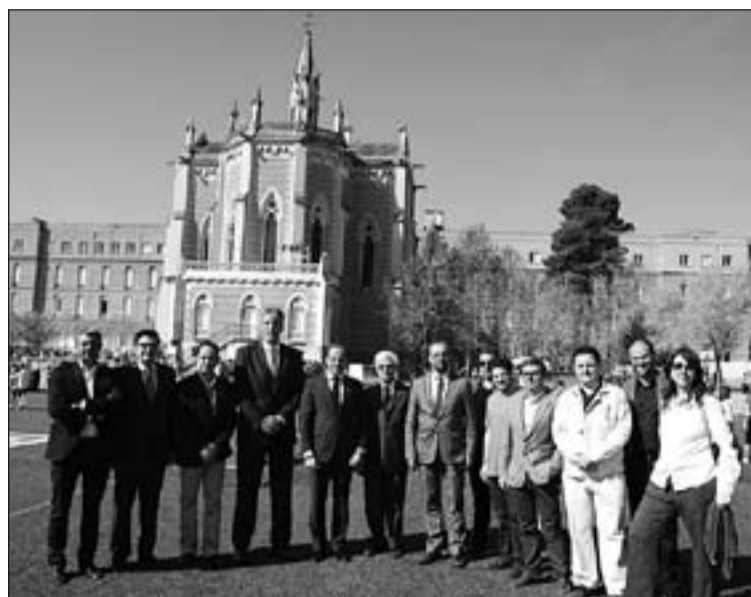
Autoridades asistentes a Educavita.