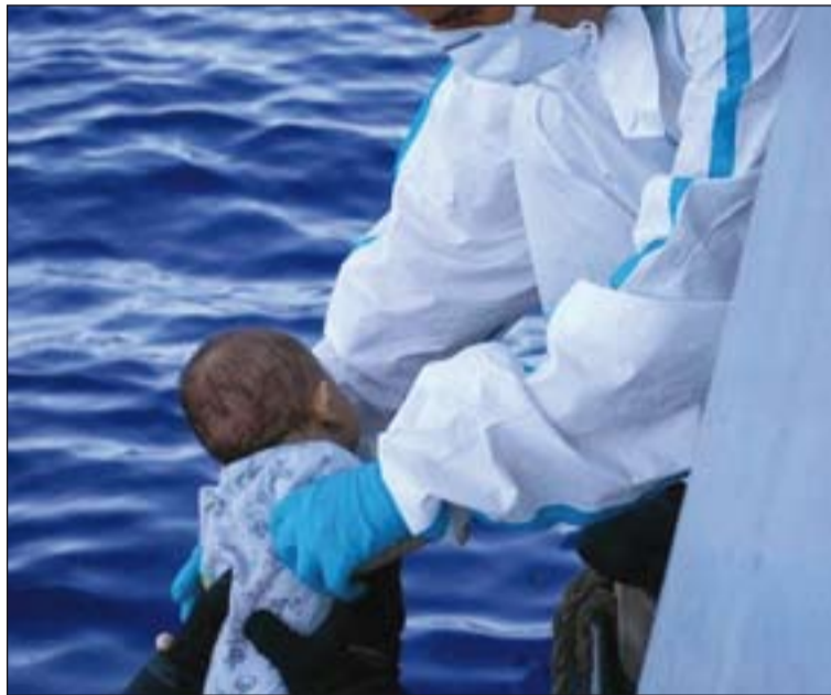
Los Servicios de Guardacostas rescatan de una patera a un bebé.

El Obispo de Roma pronunció estas palabras tras el rezo del Regina Coeli, ante miles de fieles congregados en la Plaza de San Pedro del Vaticano. A ellos les invitó a "rezar en si-