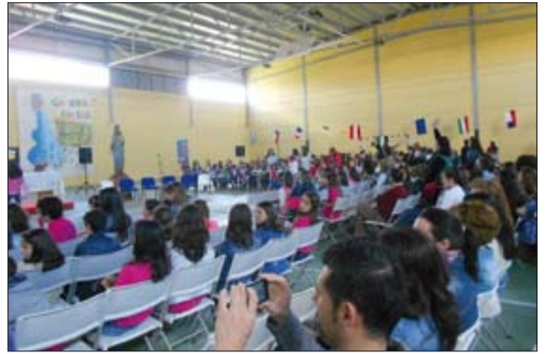
Participantes antes del inicio de la Eucaristía.