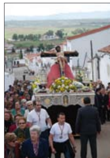
El domingo la imagen recorrió los barrios de Azuaga.

fue precedido por una conferencia impartida por Ignacio Dols Juste, miembro del Centro Español de Sindonología, que llevaba por título "La Sabana Santa, una imagen imposible". Alrededor de 400 azuagueños y de localidades de alrededor llenaron el Teatro-Cine Capitol.