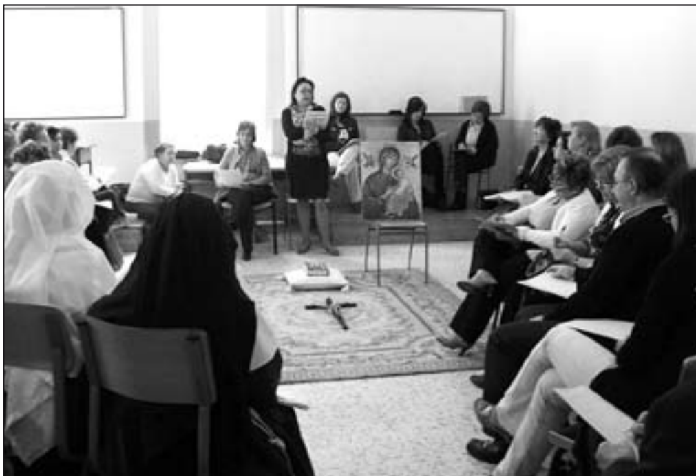
Encuentro diocesano de catequistas. (Archivo)

Mientras se espera un objetivo válido, se mantiene la tensión hacia el sentido total de la vida.