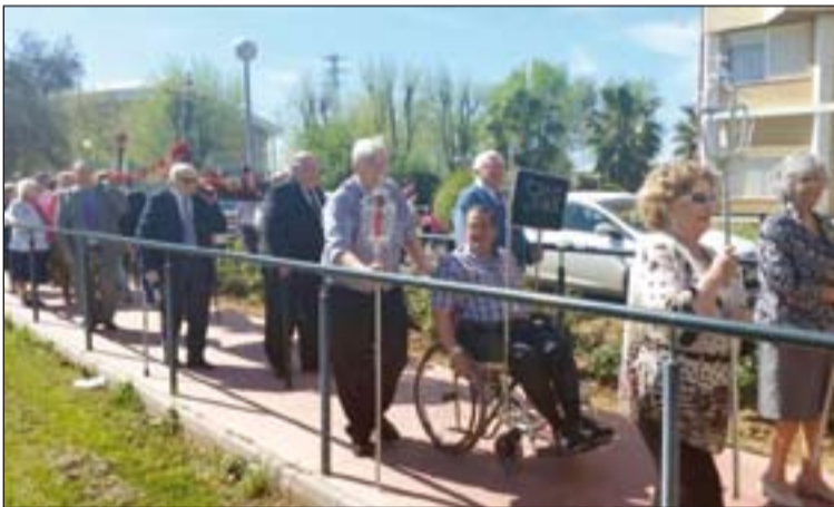
Los mayores procesionaron la imagen por los alrededores de la residencia.

jano, conociendo detalles de la vida de estas familias con respecto a la Iglesia y en su propia tarea en la formación de otros matrimonios y de su propio grupo. Además, explicaron la labor que se viene desarrollando desde la Delegación y se ofrecieron a colaborar en las distintas tareas con respecto a la familia en las que se trabajan en estos pueblos.