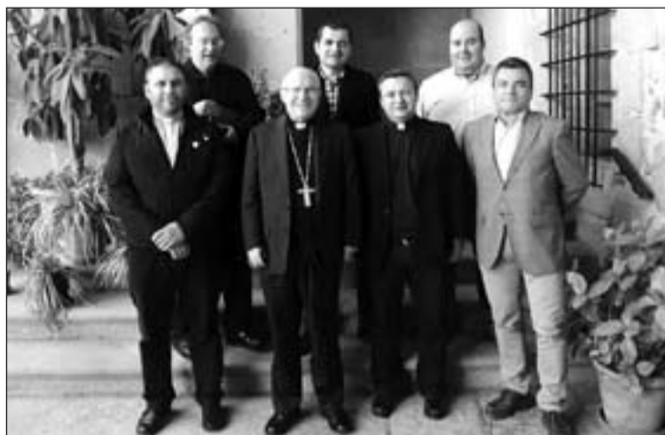
Asistentes a la reunión con el Obispo de Plasencia.

En el encuentro se acordó, entre otras cosas, potenciar la formación de los profesores de Religión, ofreciéndoles como prioridad el Instituto Superior de Ciencias Religiosas; también se insistió en que se debe animar a los sacerdotes para que