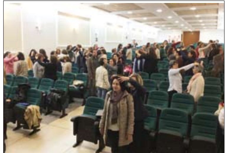
Profesores de Religión durante una de las dinámicas propuestas.

Para la Delegación episcopal para la Educación Católica la