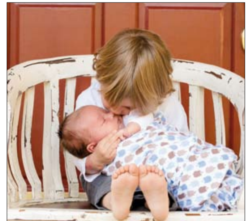
“Lo que interesa sobre todo es generar en el hijo, con mucho amor, procesos de maduración de su libertad, de capacitación, de crecimiento integral”.

El capítulo 8º constituye una invitación a la misericordia y al discernimiento pastoral frente a situaciones que no responden