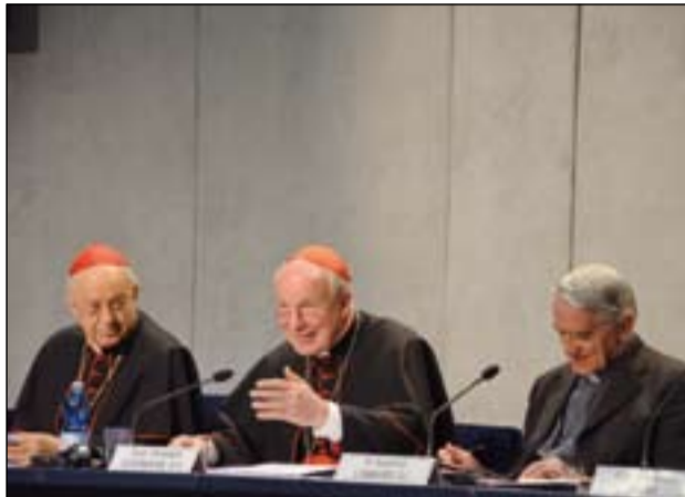
Presentación de la Exhortación Apostólica en el Vaticano.

El Santo Padre articula la reflexión a la luz de la Palabra de Dios en el primer capítulo. En el segundo,