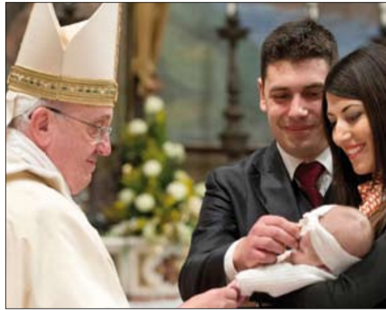
“Estamos llamado a formar las conciencias no a pretender sustituirlas”.

La Exhortación apostólica postsinodal “sobre el amor en la familia” , con fecha no casual del 19 de marzo, Solemnidad de San José, recoge los resultados de dos Sínodos sobre la familia convocados por Papa Francisco en el 2014 y en el 2015, cuyas Relaciones conclusivas son largamente citadas, junto a los documentos y enseñanzas de sus Predecesores y a las numerosas catequesis sobre la familia del mismo Papa Francisco. Todavía, como ya ha sucedido en otros documentos magisteriales, el Papa hace uso también de las contribuciones de diversas conferencias episcopales del mundo (Kenia, Australia, Argentina...) y de citas de personalidades significativas como Martin Luther King o Eric Fromm. Es particular una citación de la película “La fiesta de Babette” , que el Papa recuerda para explicar el concepto de gratuidad.