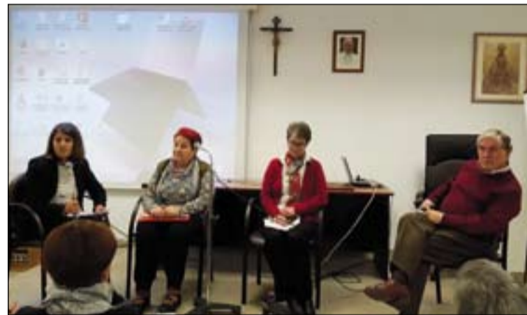
Participantes en la mesa de experiencias.

te de este modo en el hogar y la familia en la que nace la vocación", sostiene el Santo Padre, que añade: "Nadie es llamado exclusivamente para una región, ni para un grupo o movimiento eclesial, sino al servicio de la Iglesia y del mundo... Quien ha consagrado su vida al Señor está dispuesto a servir a la Iglesia donde esta le necesite".