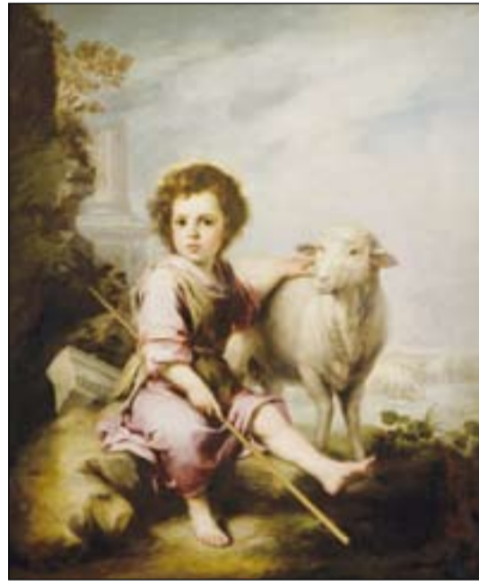
El Buen Pastor, de Esteban Murillo (S. XVII). Museo del Prado (Madrid)