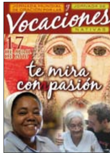
Cartel anunciador de las jornadas.

El Papa Francisco explica en su mensaje para este día que la vocación nace en la Iglesia, crece en la Iglesia y está sostenida por la Iglesia. "La comunidad se convier-