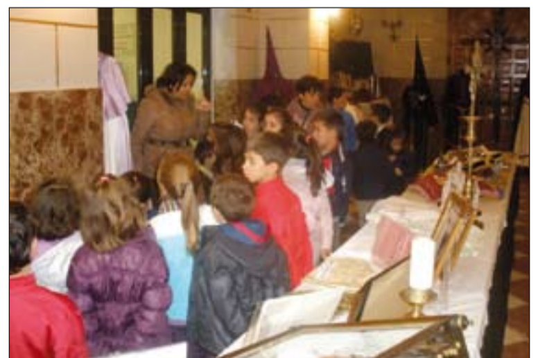
Alumnos del Colegio Santa Teresa en la exposición en Cabeza el Buey.

de Cabeza del Buey junto a la Junta de Cofradías han organizado una exposición de objetos de Semana Santa. Esta exposición también conte-