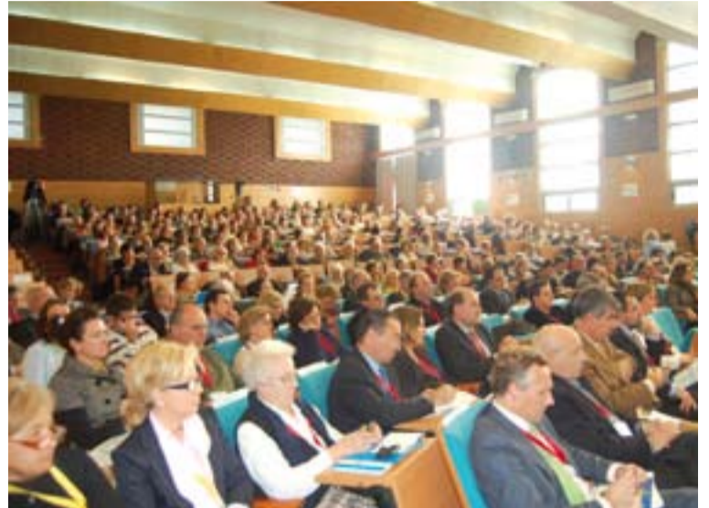
Participantes en un Congreso de Católicos y Vida Pública.