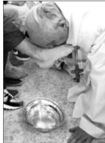
Francisco, en el Lavatorio de Pies.

Durante la celebración eucarística de la Vigilia Pascual, el Papa Francisco habló en su homilía en torno a tres ideas: la novedad, el Viviente y hacer memoria. A menudo, dijo el Papa, "la novedad nos da miedo", "tenemos miedo de las sorpresas de Dios", y por eso nos invitó a no cerrarnos a la novedad que Dios quiere traer a nuestras vidas, porque