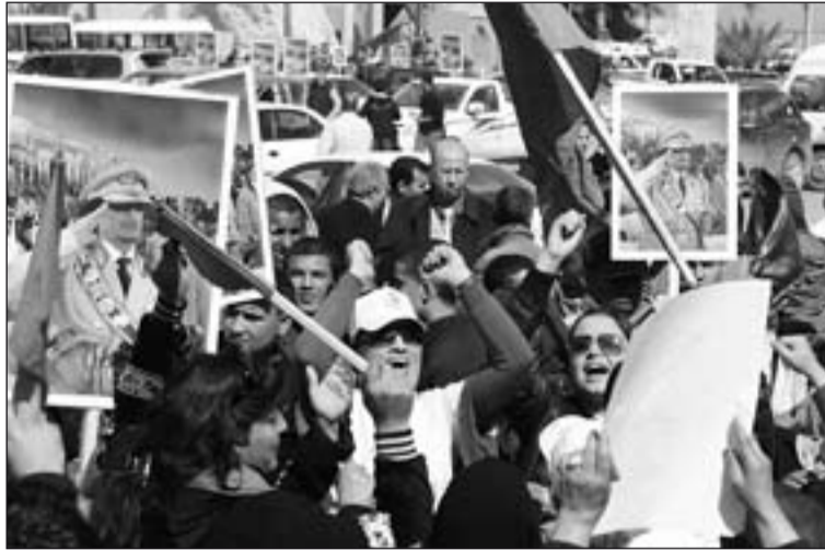
Manifestación de apoyo a Gadafi.

Fue al finalizar el rezo del Ángelus dominical cuando el Papa, como ya hiciera el domingo pasado, señaló que "ante las noticias cada vez más dramáticas" se muestra preocupado por "la seguridad de la población civil" y su "aprehensión por el desarrollo de la situación, actualmente marcada por el uso de las armas". Benedicto XVI, además, solicitó que se recurriera a la acción