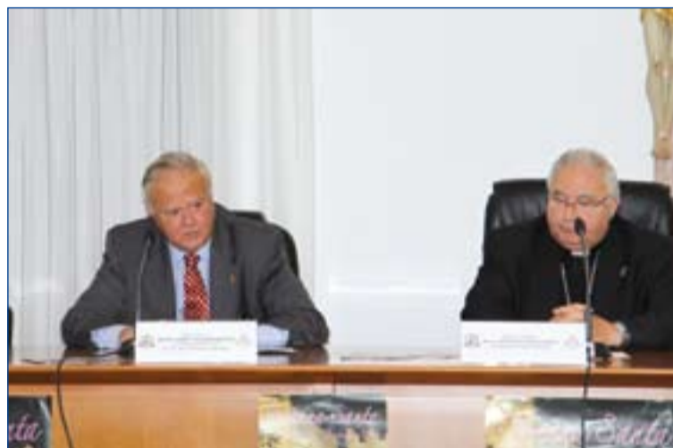
El Alcalde de Badajoz y el Arzobispo de Mérida-Badajoz en el acto