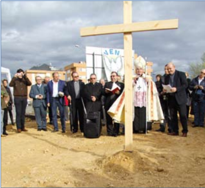
Un momento del acto de colocación de la primera piedra de la parroquia del Espíritu Santo.

■ Las 13 parroquias creadas en los últimos 35 años se encuentran en las ciudades de Badajoz y Mérida.