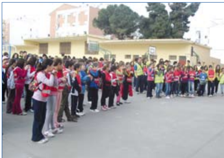
Niños participantes en la VIII Gymkhana "Dando color..."

El pasado sábado, 26 de marzo, se celebró la VIII Gymkhana "Dando color a la vida... Aquí en Badajoz", en la que participaron cientos de niños con edades comprendidas entre 10 y 13 años junto a sus monitores. Este año, bajo el lema "TE SUMAS O TE RESTAS", los chavales volvieron a inundar de alegría las calles de la capital pacense, disfrutando y profundizando en los valores del Evangelio a través de distintos juegos y actividades realizadas por el casco antiguo de la ciudad.