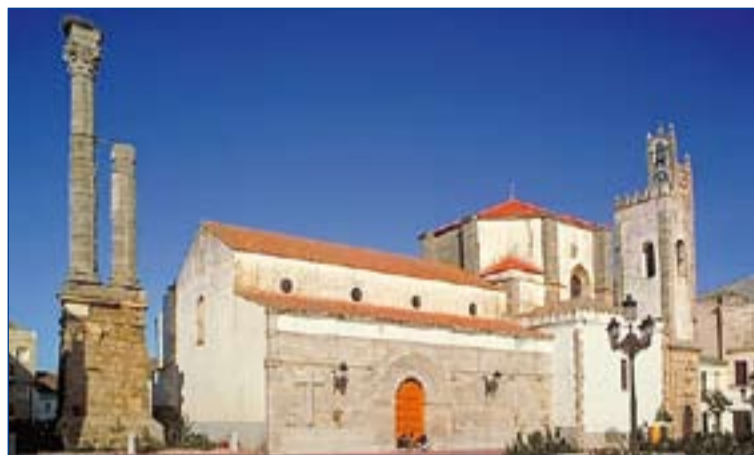
Parroquia de Nuestra Señora de los Milagros.

al cuerpo principal y la nave menor, que es uno de los ejemplos de remodelación en el siglo XVII anteriormente citados, aparece configurada por cuatro capillas con bóveda de aristas, una mayor de traza gótica con cubierta de nervadura aneja a la cabecera.