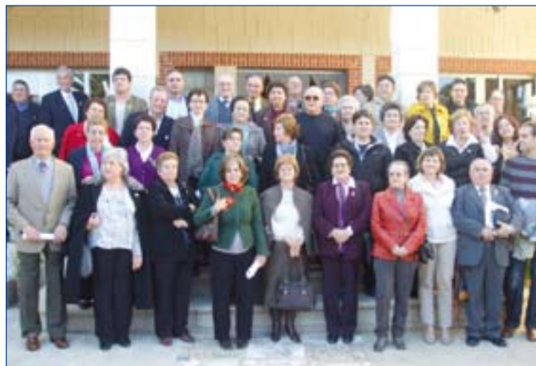
Participantes en el retiro.