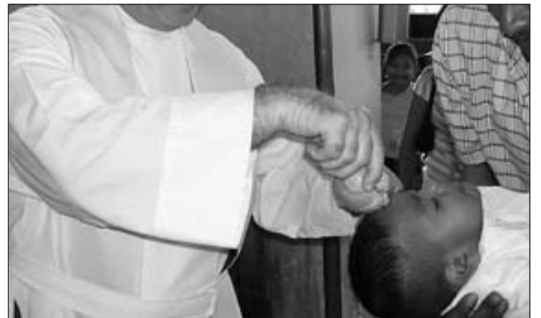
El Alto Tribunal español reconoce que los libros de bautismo no son archivos sujetos a la LOPD.