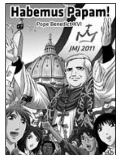
Portada del comic.