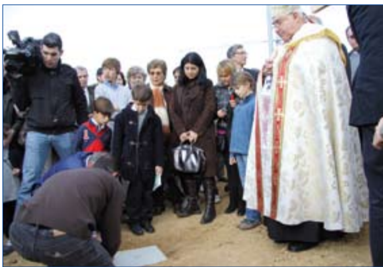
Dos de los momentos de la colocación de la primera piedra en la parroquia del "Espíritu Santo".

"Nuestra Señora de los Milagros", ambas en el polígono Nueva Ciudad; la parroquia de "San Antonio de Padua", en la zona Sur, a cargo de los Padres Franciscanos y la de "San Juan Bautista y María