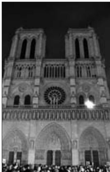
Notre Dame durante el encuentro

El Papa también participó a través de un videomensaje en este diálogo. Se dirigió especialmente a los jóvenes reunidos ante la catedral de Notre Dame. Benedicto XVI afirmó que "la cuestión de Dios no es un peligro para la sociedad, no pone en peligro la vida humana. La cuestión de Dios no debe estar ausente de los grandes interrogantes de nuestro tiempo".