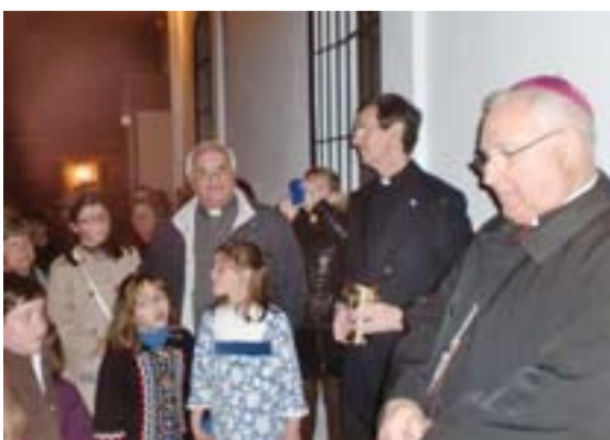
El Arzobispo, en primer término, en la bendición de la Casa de la Iglesia.

La obra se ha realizado con la venta de una antigua casa parroquial bastante deteriorada, un préstamo pedido por la parroquia y muchas aportaciones de los fieles con actividades de recaudación, con esfuerzo y generosidad. Todos se sienten muy agradecidos y siguen colaborando ya que de este edificio se van a beneficiar a mucha gente que soliciten los servicios de la parroquia.