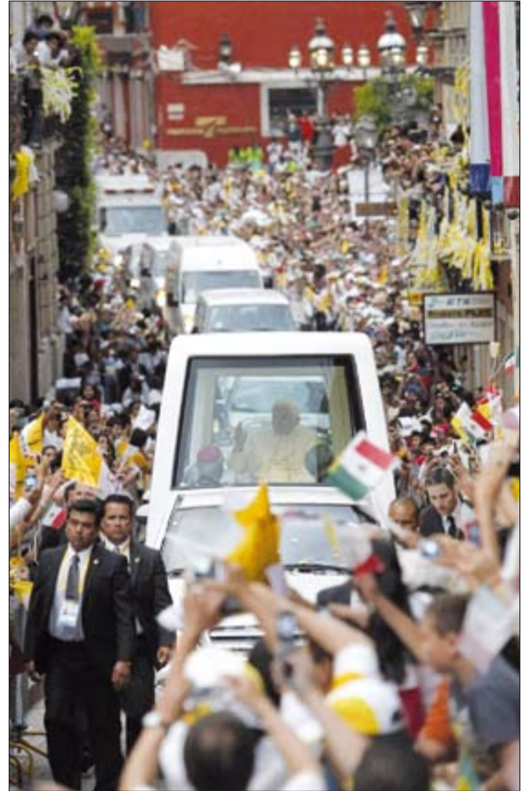
El viaje apostólico del Papa ha durado seis días.