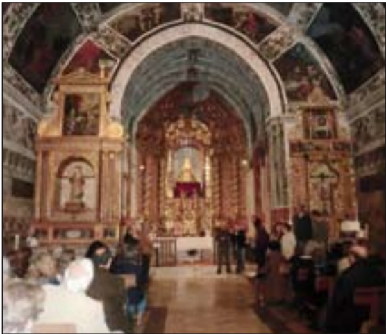
Peregrinos en la ermita de Ntra. Sra. del Ara, en Fuente del Arco.

Peregrinación a lugares marianos; El sábado 17 de marzo la Delegación episcopal para Peregrinaciones llevó a cabo un viaje a varios lugares marianos de la Diócesis: Fuente del Arco, donde visitaron la ermita de Ntra. Sra. del Ara; en Llerena se acercaron a la iglesia de Ntra. Sra. de la Granada; y en Bienvenida visitaron el santuario de Ntra. Sra. de los Milagros. 72 peregrinos recorrieron estos lugares de culto con el principal objetivo de orar ante sus titulares. Desde esta Delegación agradecen la colaboración de los Ayuntamientos visitados, así como de los sacerdotes y miembros de las hermandades.