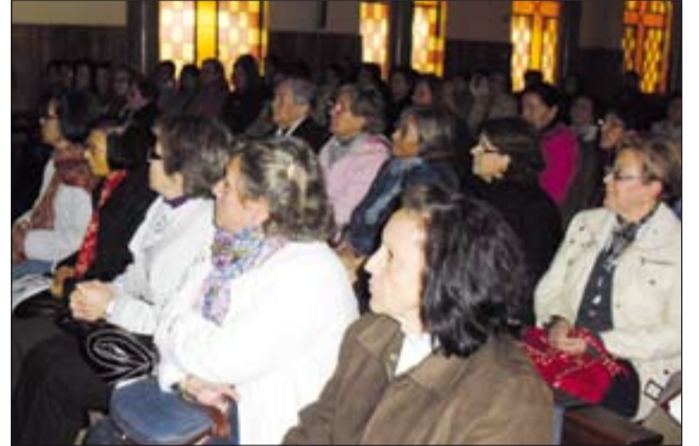
Encuentro de formación de catequistas celebrado en este curso.

El encuentro contó también con talleres prácticos, el primero de los cuáles corrió a cargo de la Delegación de Catequesis de la diócesis de Cuenca y versó sobre los gestos, signos y símbolos de