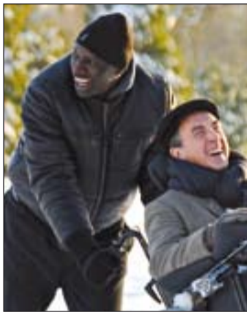
Secuencia de la película.

de San Sebastián con una enorme ovación y un larguísimo aplauso de público y crítica, y está teniendo un enorme éxito de taquilla en Francia, Alemania y Tokio, donde ha recibido el premio a la "Mejor Película" y "Mejor Interpretación". Ha conseguido 9 candidaturas a los Premios Cesar, y en Estados Unidos ya han comprado los derechos de distribución. No me sorprende su éxito, porque esta joya del cine francés realmente engancha con el espectador y nos anima a ser mejores personas. Por cierto, el título es el mismo, pero nada tiene que ver con Los Intocables de Eliot Ness.