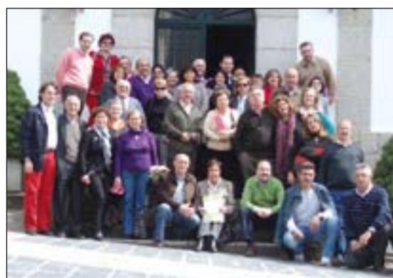
Matrimonios que han participado en los ejercicios espirituales.

el encanto y la esperanza de la vida; y desde ellos cómo el Evangelio pone al descubierto los caminos para la verdadera dicha y alegría, en los mismos lugares en los que el pecado y la debilidad ponen los miedos. Los matrimonios se plantearon acciones concretas en orden a servir a un mundo más justo y fraterno en la crisis actual. La oración y la celebración de los sacramentos del Perdón y de la Eucaristía jalonaron las tres jornadas de renovación y conversión.