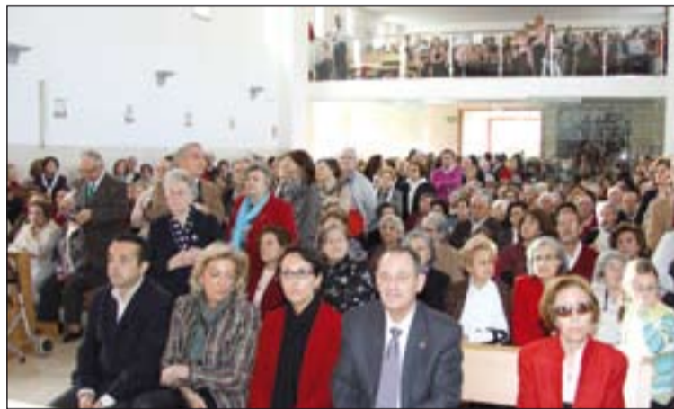
Arriba, el Arzobispo presidió la Eucaristía, concelebrada por doce sacerdotes. Abajo, centenares de fieles llenaron el nuevo templo.

ria de este templo que, gracias a Dios, hoy echa a andar".