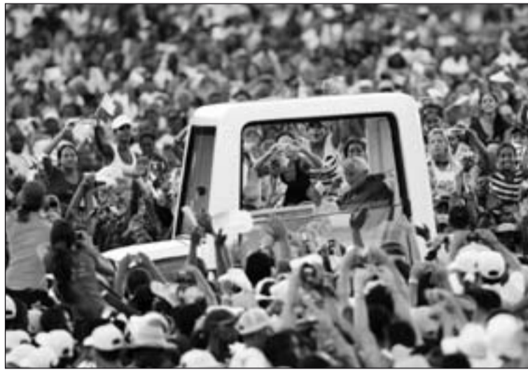
Benedicto XVI aclamado por los fieles cubanos.

Tras México, la siguiente parada para el Santo Padre era Cuba, a donde llegaba a las 14