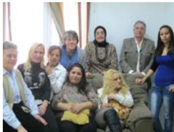
Mujeres que han participado en el Taller, junto a las voluntarias que lo han impartido.

El 10 de abril comenzará un nuevo curso de Servicio Doméstico.