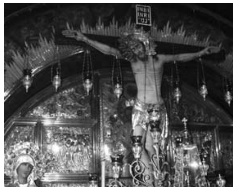
Basílica del Santo Sepulcro en Jerusalén.

La Colecta pontificia del Viernes Santo hace posible y sostiene en gran medida la obra de la Iglesia y de la Custodia franciscana de Tierra Santa. De todos depende que los santuarios cristianos puedan ser conservados y visitados, que sean dignos lugares de celebración de la fe y que el testimonio de caridad se siga expresando en tantas obras sociales y apostólicas de los hermanos allí presentes.