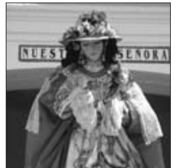
Virgen de Bótoa