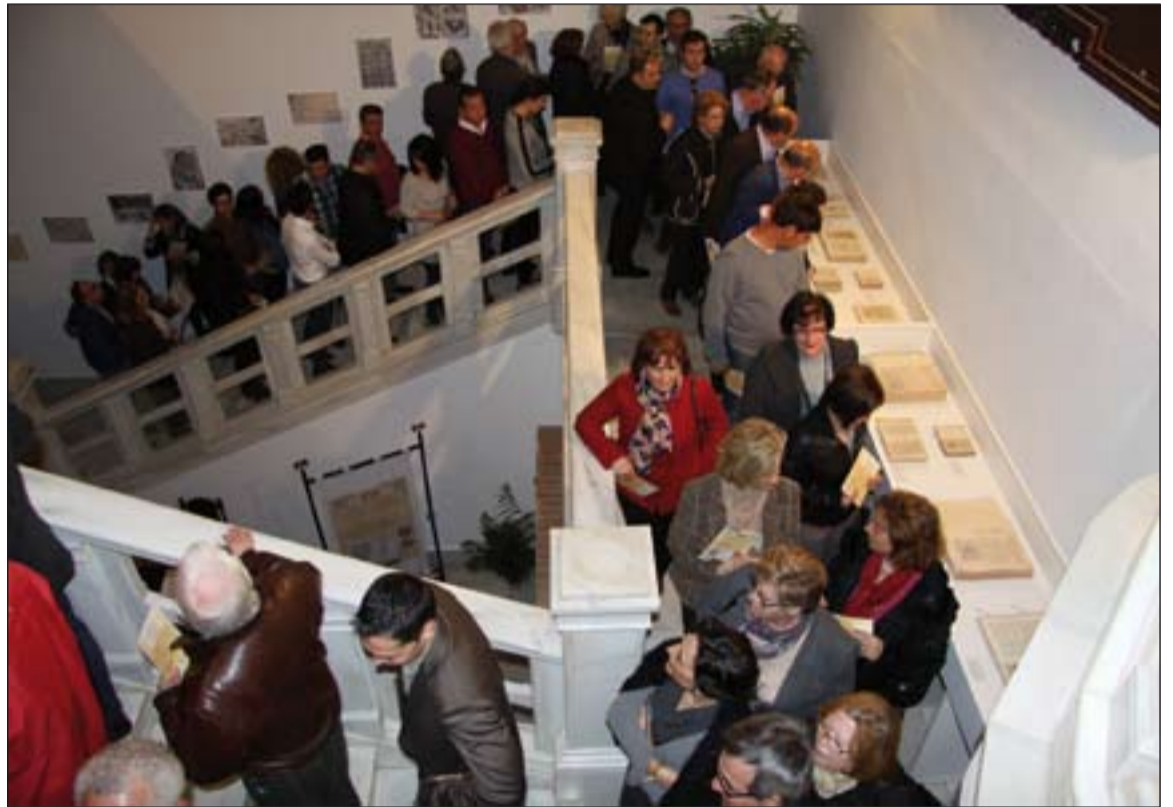
Visitantes de la exposición el día de la inauguración