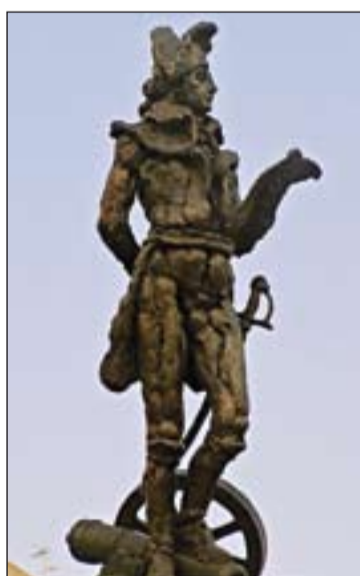
Estatua de Godoy en la Plaza de San Atón de Badajoz.

Don Manuel era uno de los numerosos alumnos externos que llenaban las aulas del Colegio-Seminario. Al terminar la formación Secundaria, Godoy inicia los estudios superiores. Él mismo recuerda esos estudios y habla agradecido