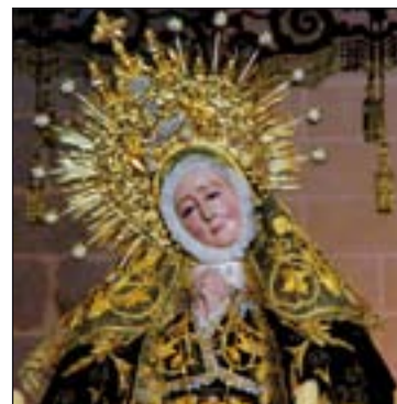
Virgen de la Soledad.

Otras actividades extraordinarias son una Misa especial para los "Hijos Preferidos de la Virgen", el 28 de octubre, otra por las familias, el 25 del mismo mes y una peregrinación de la Hermandad todavía por determinar.