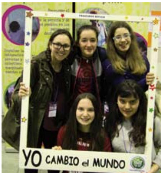
Jóvenes participantes en el stand de Proclade Bética.

Tras la misa los jóvenes se dirigieron andando al Palacio del Vino, haciendo una parada en el parque de la Piedad, donde les ofrecieron un desayuno. Mientras tanto se llevó a cabo una recepción oficial en el Ayuntamiento en la que el Alcalde, José García Lobato, entregó a García Aracil una reproducción del disco de Teodosio, que fuera encontrado en Almendralejo. El Arzobispo por su parte entregó al Alcalde una placa conmemorativa como agradecimiento a la acogida y junto al Arzobis-