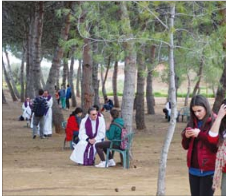
Sacerdotes impartiendo el sacramento de la Penitencia a los jóvenes.