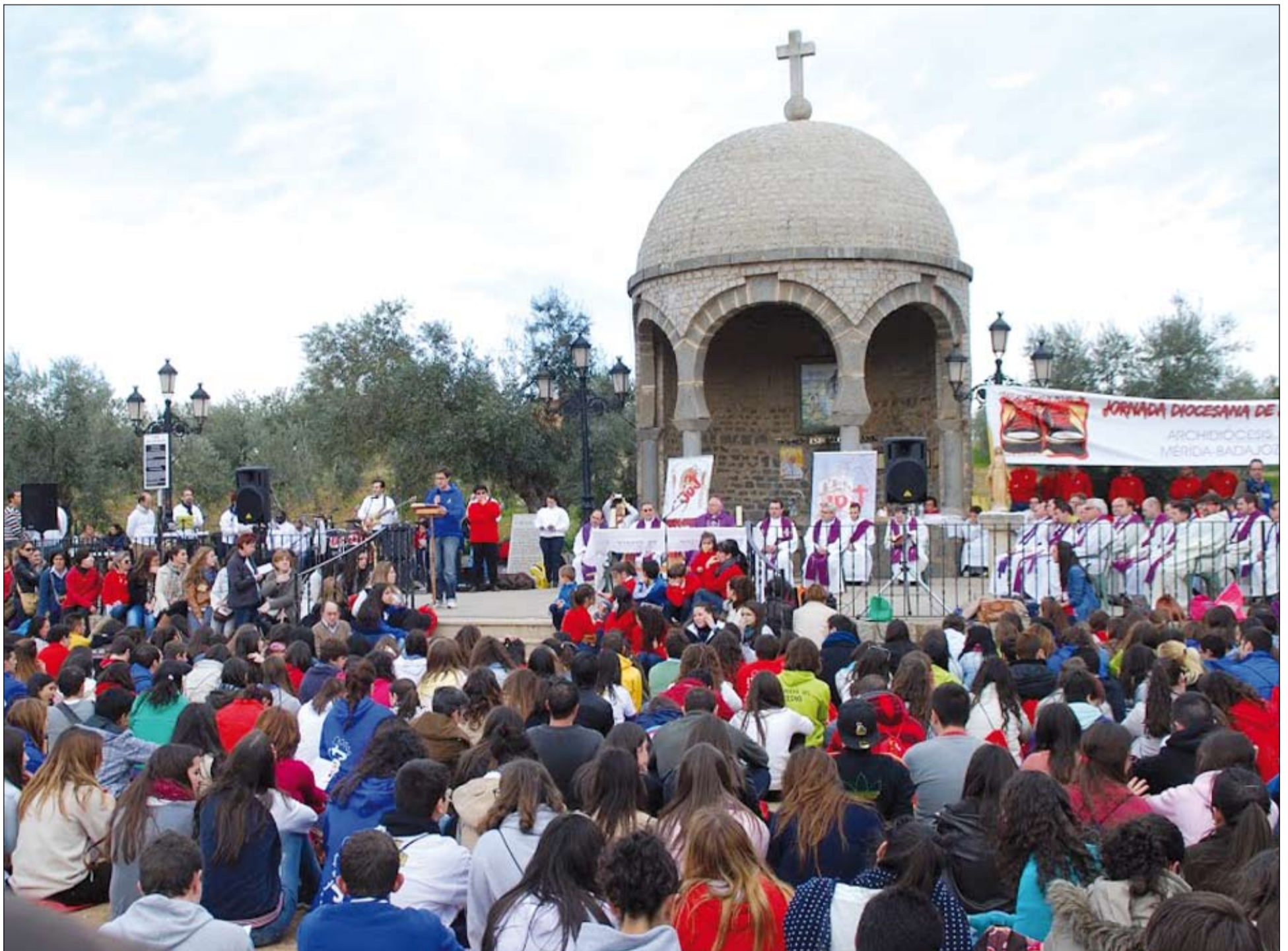
Celebración de la Eucaristía, presidida por el Arzobispo de Mérida-Badajoz, en el "Pocito".