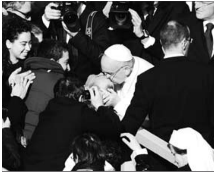
El Papa Francisco se bajó del jeep para besar a un enfermo.

La ceremonia de ‘inicio del ministerio del Obispo de Roma’, comenzó a los pies de la tumba del apóstol San Pedro, debajo del altar central de la Basílica. Allí, el Papa Francisco bajó acompañado por los patriarcas y jefes de las iglesias orientales católicas, cuatro de los cuales, cardenales, quienes tomaron los símbolos que el Pontífice recibió durante la misa: el anillo del