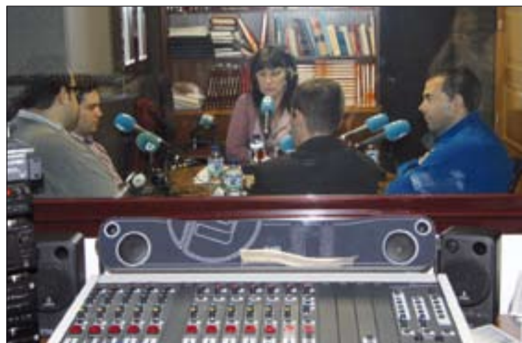
El programa se realizó en los estudios de la Del. Episc. para los Medios de Comunicación Social, en la Casa de la Iglesia, junto al Seminario.

El mismo día la Cadena SER en Badajoz emitió un amplio reportaje en su magazine "Hoy por Hoy" sobre el Seminario grabado en el centro el día anterior con el Rector y varios seminaristas.