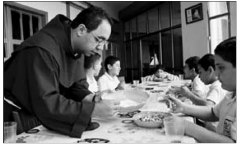
Franciscano atendiendo un comedor para niños en Belén.

Pero además, la Custodia de Tierra Santa promueve la acción cultural, científica y ecuménica, así como sostiene la actividad social con viviendas para familias, residencias