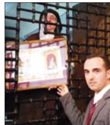
El Hermano Mayor entrega el cuadro conmemorativo a la Priora de la comunidad.

El triduo, realizado en la capilla del convento, fue predicado por padres carmelitas y giró entorno a la vida de Santa Teresa y sus escritos. Tras los actos celebrados en el convento se trasladaron a la parroquia las imágenes de los titulares de la Hermandad, donde esperan la llegada del Jueves Santo, día en que realizan su estación de penitencia.