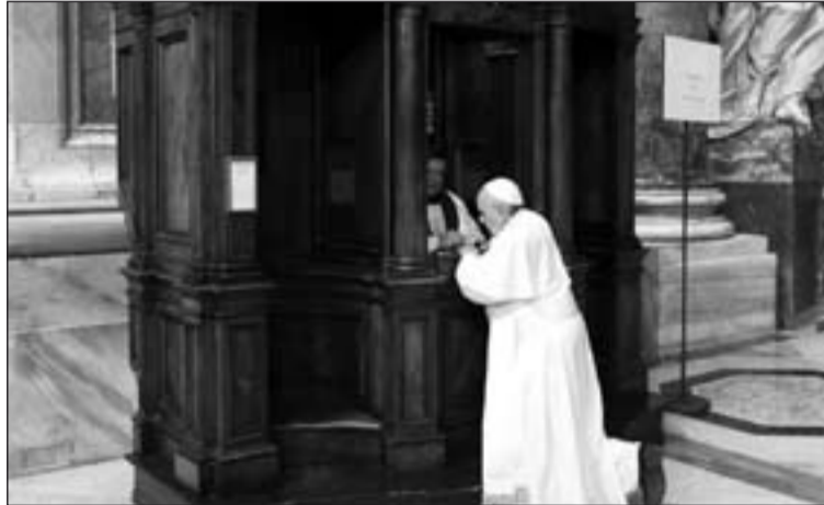
El Papa Francisco recibe el Sacramento del Perdón.

La Iglesia católica inició la tradición de celebrar el Año Santo con el papa Bonifacio VIII en el año 1300. Este Pontífice previó la realización de un jubileo cada siglo. Desde el año 1475 -para permitir a cada generación vivir al menos un Año Santo- el jubileo ordinario comenzó a espaciarse al