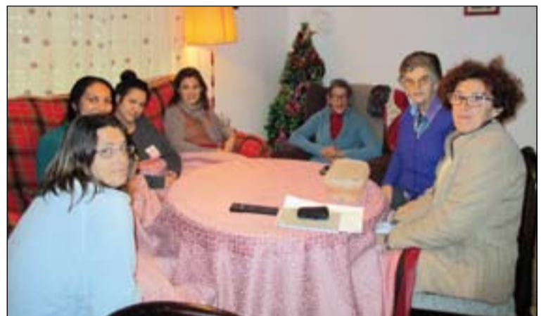
De arriba a abajo, aulas ya construidas en Zimbabwe; cooperativistas beneficiarios del proyecto en El Salvador y vivienda de convivencia de Cáritas.