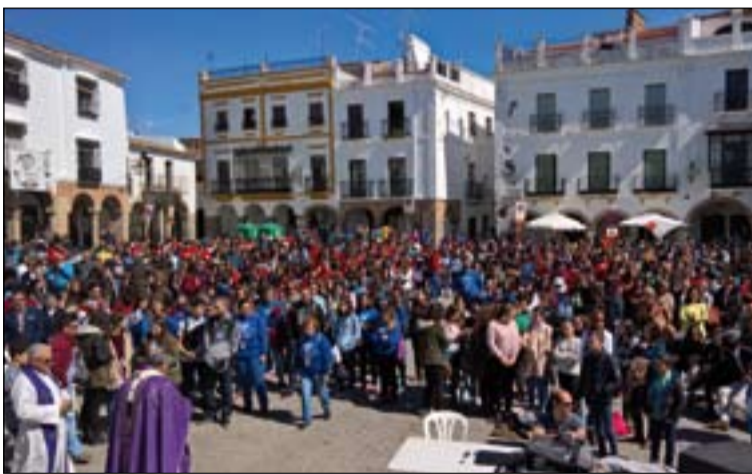
La Eucaristía se celebró en la plaza Grande de Zafra.