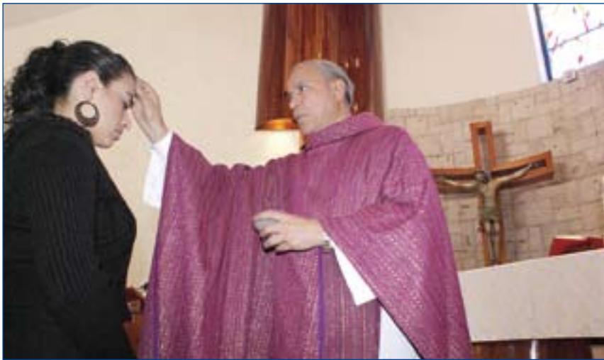
Con el rito de la imposición de la ceniza se inicia el tiempo de cuaresma.

exclusivamente romana: se encuentra también en Oriente, y en diversas regiones de Occidente.