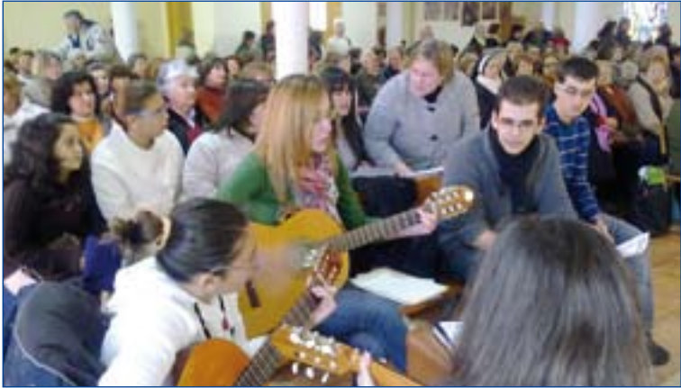
Un momento de la celebración del encuentro.

La ermita de la Virgen del Puerto, en Plasencia, ha acogido la celebración del "Día del misionero Extremeño", una jornada organizada por las tres diócesis extremeñas donde se rinde tributo a los casi trescientos hombres y mujeres que han salido de Extremadura para anunciar el Evangelio en todos los rincones del mundo.