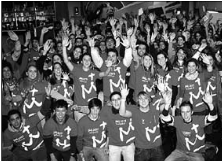
Voluntarios de la JMJ Madrid 2011.

Para los obispos, participar en dicha Jornada es "expresión de la adhesión a Cristo y pertenencia a la Iglesia. La Jornada Mundial de la Juventud será una auténtica fiesta de la fe, que mostrará cómo son los cristianos que necesita el mundo de hoy: artífices de paz, promotores de justicia, animadores de un mundo más humano, un mundo según Dios, que se comprometen en diferentes ámbitos de la vida social, con competencia y profesionalidad, contribuyendo eficazmente al bien de todos [...] Vuestra responsabilidad como jóvenes del país que acoge es muy grande. Vosotros seréis en cierto sentido el rostro de la Iglesia joven que recibirá a los peregrinos del mundo entero".