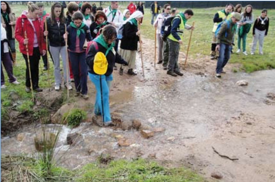
La Cuaresma es un peregrinaje interior en el que, con la ayuda de Dios, se van superando las propias imperfecciones y dificultades para así llegar preparados para vivir la Pascua.

■ El tiempo de Cuaresma se extiende desde el miércoles de Ceniza, que hemos celebrado esta semana, hasta la Misa de la cena del Señor, exclusiva, el Jueves Santo.