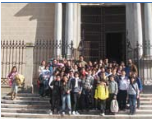
Participantes en la visita a las puertas de la Catedral.