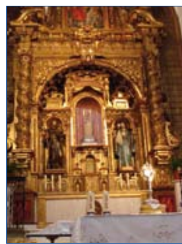
Monasterio de Santa Clara.

El interior de la clausura del Monasterio de Santa Clara es una espaciosa y artística residencia para la extensa comunidad de las monjas de Santa Clara, quienes se dedican a trabajos continuamente para mantener sus vidas, cuando ya la protección de los Duques de Feria había cesado, siendo un lugar interesante en sus claustros y corredores, en los que se guardan pinturas al fresco de gran valor. El coro de las religiosas, situado en la parte pos-