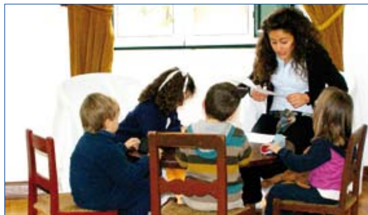
Mientras los mayores reflexionaban, los más pequeños jugaban.

Organizados por el equipo diocesano de Pastoral Familiar se han celebrado, el pasado fin de semana, unos ejercicios espirituales en familia, realizados en la casa de oración San João de Elvas. En este evento, el primero de estas características que organiza el mencionado Equipo, han participado diecisiete familias que, distribuidos por grupos de edades, han intentado acercarse más a Dios sin abandonar el ambiente de familia. Para facilitar la reflexión