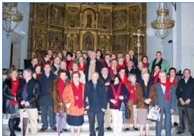
El grupo de matrimonios que ha recibido el homenaje.

Un año más, la comunidad parroquial de Santa María del Valle de Villafranca de los Barros celebró junto a numerosos matrimonios sus Bodas de Plata y de Oro.