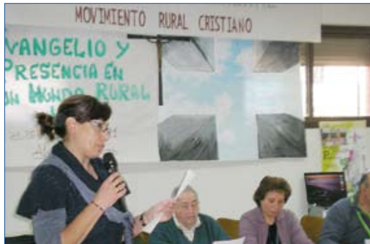
Un momento de la Asamblea.

Por todo ello afirman sentirse llamados a mirar al futuro, optar por la educación en valores, mirar la realidad con ojos críticos, favorecer las redes de comunicación solidarias, aumentar su presencia social a todos los niveles y colaborar con los sacerdotes en la promoción y participación de los laicos.