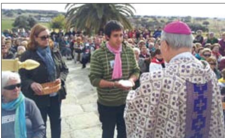
Día del Misionero Extremeño Pág. 4