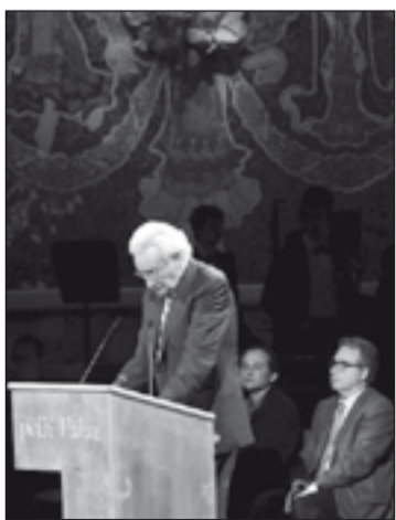
Luis del Olmo lee el Evangelio.