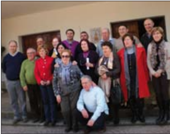
Matrimonios del Sector B, durante el retiro.