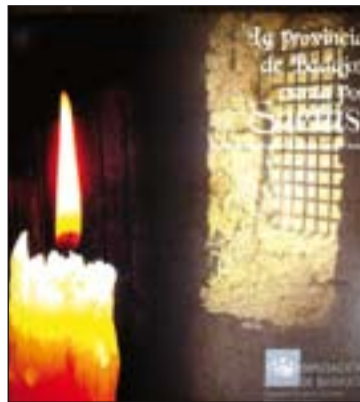
Portada del disco.

dio se encuentran precedidos de una breve introducción realizada por el reconocido flamencólogo y director de la Tertulia Flamenca "Porrinas de Badajoz" , en la Cadena COPE, Francisco "Paco" Zambrano , autor además de la letra de todas las saetas o de sus adaptaciones, según el caso. La grabación la llevó a cabo el técnico Armando Mazuecos , de los estudios Promúsica y al estar editado por la Diputación Provincial, en colaboración con la Federación Provincial de Peñas Flamencas, se debería encontrar sin demasiados problemas en la tienda que el organismo mantiene en la calle Francisco Pizarro de la capital pacense.