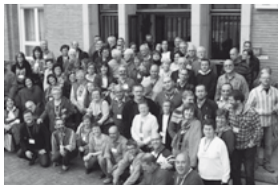
Participantes en el encuentro.

El MRC se siente llamado a vivir su militancia en un mundo rural y en una Iglesia en constante renovación. Manifiestan que "quieren permanecer en la vida de nuestros pueblos, apostando por una formación integral, creando espacios de reflexión y análisis, y con una actitud crítica y de denuncia de todo aquello que nos impide crecer como personas".