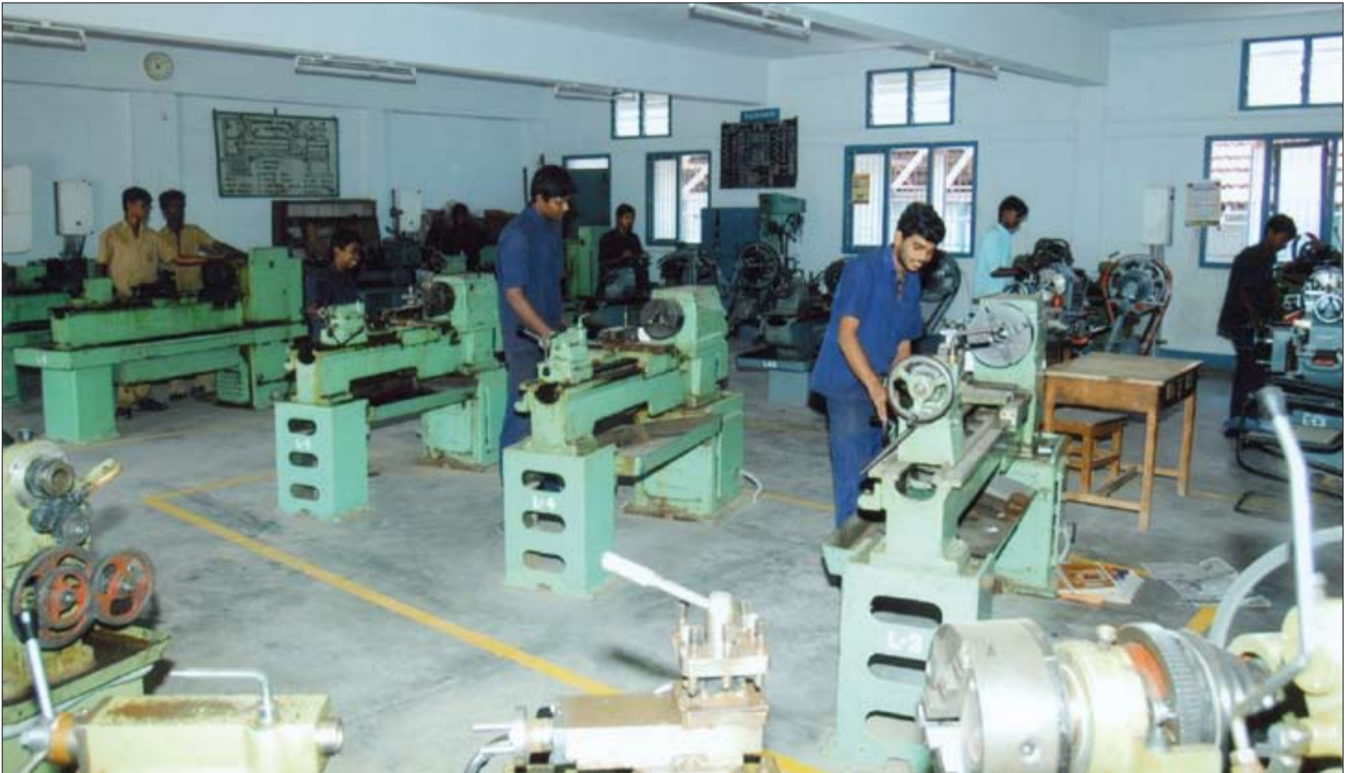
Escuela-orfanato en la India financiada por el Fondo Diocesano de Solidaridad en 2010.