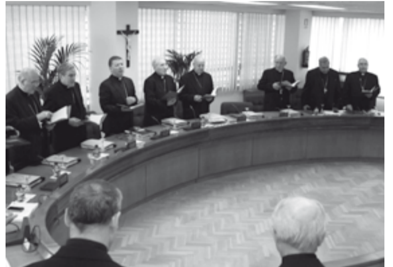
Obispos españoles en la Comisión Permanente.

ria decidirá sobre el Congreso y sus posibles contenidos y fechas de realización.