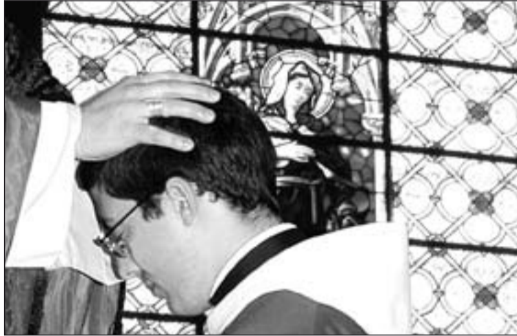
Un joven es ordenado sacerdote.

El "Día del Seminario" se viene celebrando desde el año 1935. Desde entonces cada año llega con un nuevo lema pero con el mismo objetivo: suscitar vocaciones sacerdotales mediante la sensibilización, dirigida a toda la sociedad, y en particular a las comunidades cristianas.