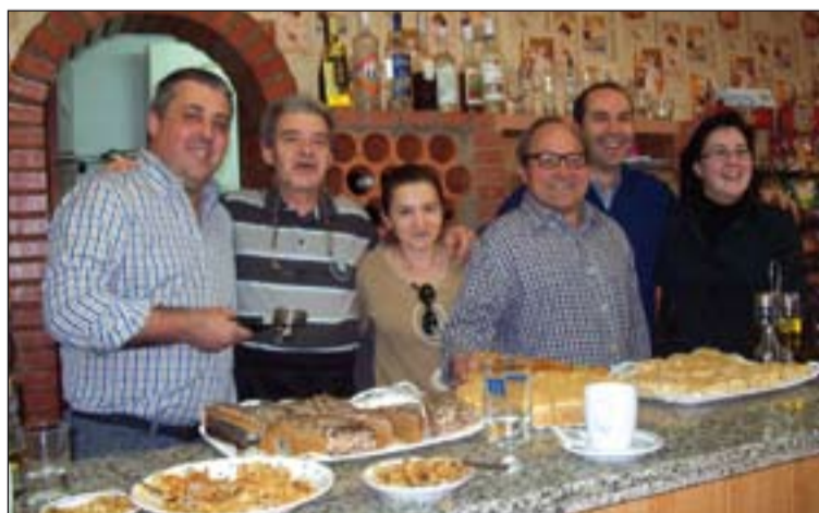
Inauguración del Bar Aloha.

Esta iniciativa se enmarca dentro del "Programa de Atención de Personas afectadas por la Crisis", que ha puesto en marcha Cáritas Diocesana de Mérida-Badajoz,