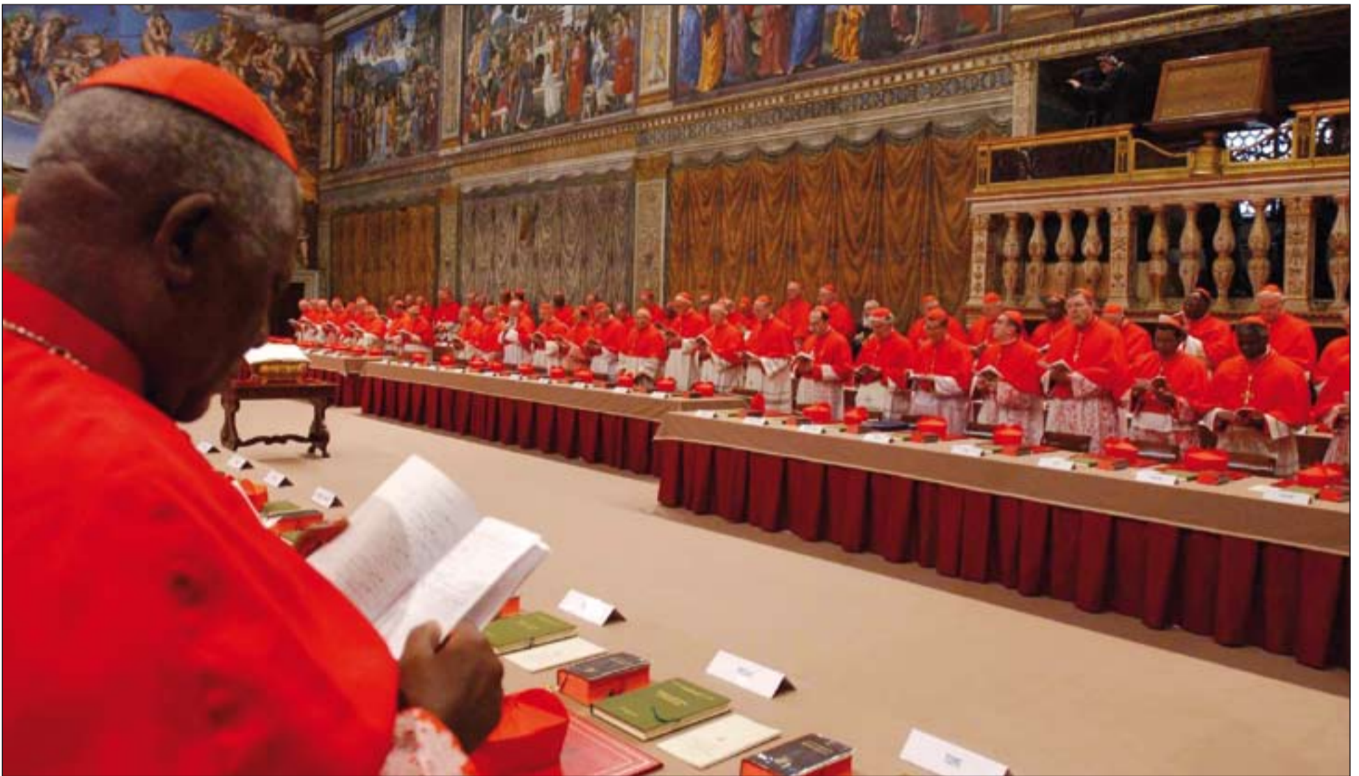
Los cardenales, en la Capilla Sixtina, al inicio del cónclave que eligió a Benedicto XVI como Pontífice.