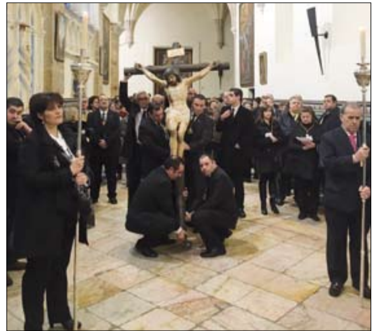
Vía Crucis del Cristo de la Misericordia por el claustro de la Catedral.

En el caso de la Catedral fue muy abundante la participación de los fieles, incluso durante la madrugada. Los sacerdotes de la ciudad ofrecieron meditaciones a lo largo de las 24 horas y estuvieron disponibles para confesar al significativo número de personas que quisieron acercarse al sacramento del Perdón.