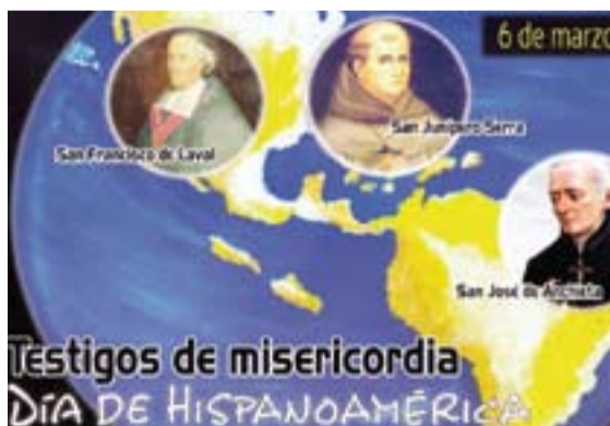
Cartel de la jornada.

A estos misioneros canonizados se refiere el lema y también el cartel de la Jornada. Estos