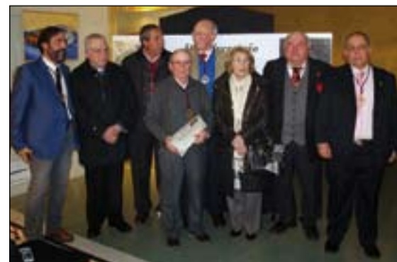
Los hermanos mayores de la cofradía durante estos 50 años.

la celebración de una eucaristía por los cofrades difuntos y el pasado sábado día 27, un acto conmemorativo en la Sala Centinela del Teatro Municipal que contó con la presencia de numerosos hermanos cofrades. Destacaron los momentos en que se leyó el acta de fundación y se hicieron entrega de los diplomas de honor a los hermanos fundadores y a los hermanos mayores que han sido desde 1966 hasta el 2016.