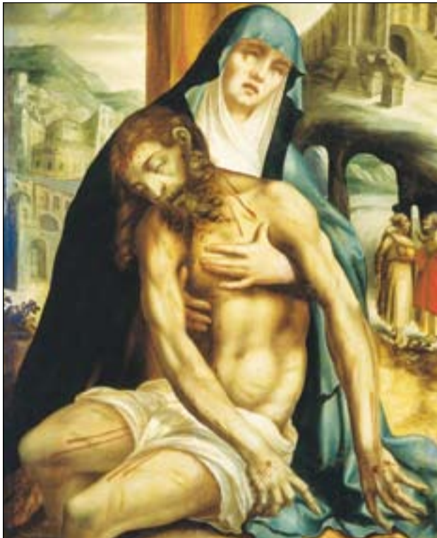
mar inútilmente a su Padre. Jesús decía: «Dios mío, Dios mío, ¿por qué me has abandonado?». Es la ora-

Ella sabía Quién era Jesús. Lo había llevado en su seno, lo había llevado a la luz. Ella conocía mejor que nadie el misterio de la concepción inmaculada de Jesús. Sabía que Él era realmente el Hijo unigénito del Padre. Pero allí, en el madero, en aquel primer Viernes Santo de la historia, el Hijo parecía lla-