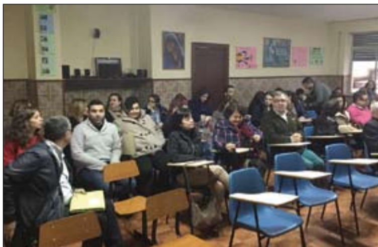
Nuevos alumnos de la extensión de aula en Don Benito.

Este martes se inauguraba una nueva extensión del Instituto Superior de Ciencias Religiosas "Santa María de Guadalupe", de nuestra Provincia Eclesiástica de Mérida-Badajoz, que cuenta ya con 150 alumnos, uno de los más numerosos de España